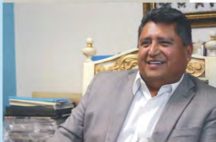
Una mujer luchadora

“Lo único que me ha tocado ver es gente contenta por el hecho de que regresa”, puntualizó.