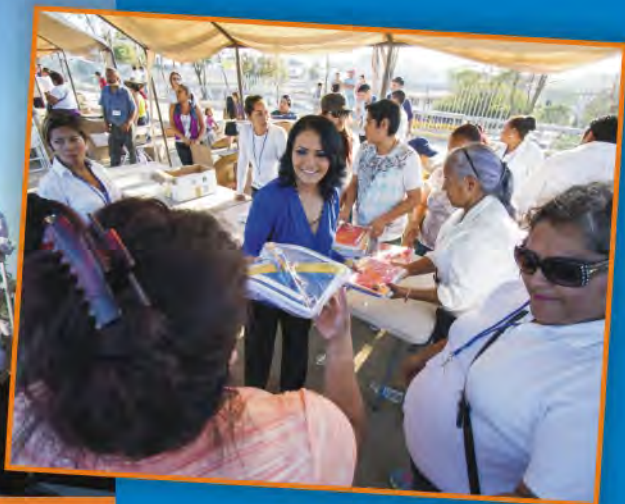
Antes de tomar protesta en San Lázaro