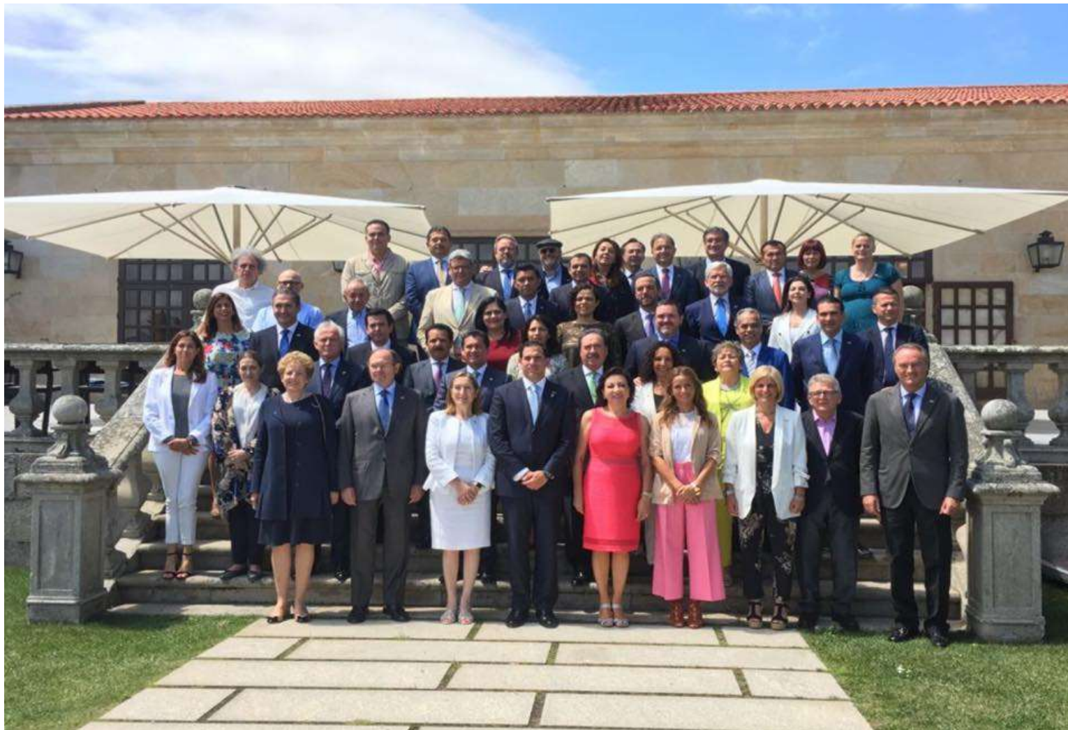
Foto oficial XV Reunión Interparlamentaria