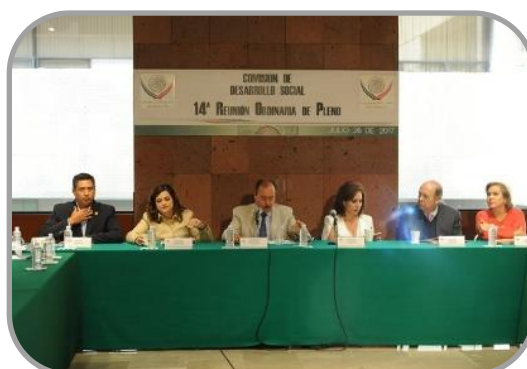
14ª Reunión Ordinaria 26 de Julio de 2017