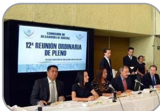
12ª Reunión Ordinaria 23 de Mayo de 2017