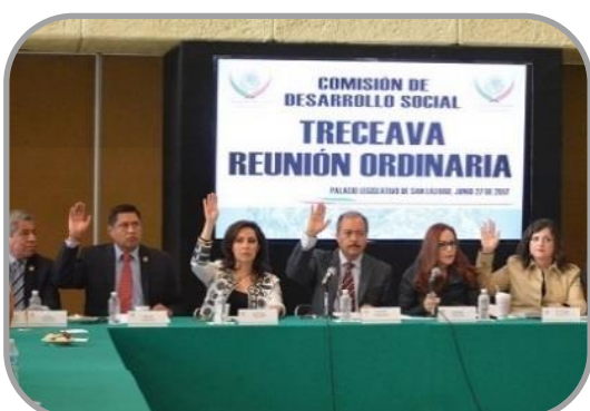
13ª Reunión Ordinaria 27 de Junio de 2017