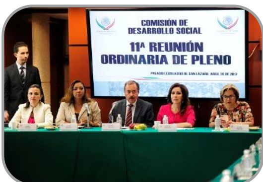
11ª Reunión Ordinaria 26 de Abril de 2017