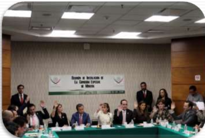
Foto: sesión de instalación de la Comisión Especial de Minería, 23 de octubre de 2016.

Por ello el 23 de octubre del 2016, los diferentes grupos parlamentarios dimos un voto de confianza para crear la Comisión Especial de Minería en la Cámara de Diputados para revisar la ley minera e impedir ocurran más actos de impunidad en torno al tema minero en el país.