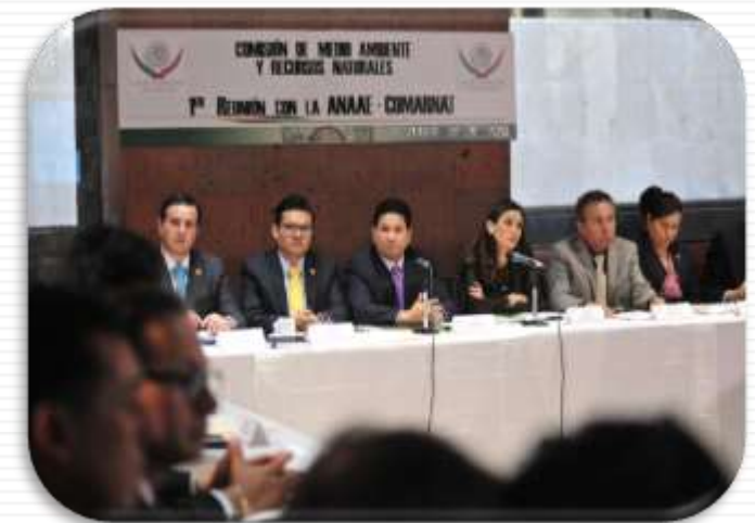
Foto: reunión de la Comarnat con la ANNAE, 28 de octubre de 2015.

La problemática ambiental que vivimos los mexicanos no se solucionará con acciones aisladas de cualquier orden de gobierno o sector, ésta, debe incluir bajo consenso una serie de acciones sistemáticas focalizadas con la participación de todos los actores, de ahí la importancia de fomentar la participación.