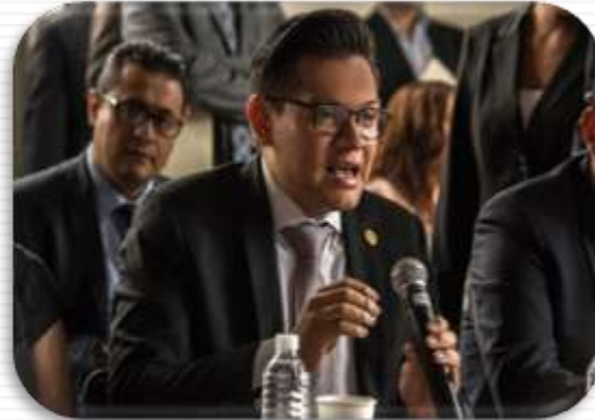
Foto: sesión ordinaria sobre la opinión del Presupuesto de Egresos de la Federación 2016.

Lamentablemente, las variables económicas para 2017 hacen previsible un nuevo ajuste presupuestal, de ahí que uno de los sectores más afectados sea el Fondo Metropolitano con un recorte de cerca del 70%.