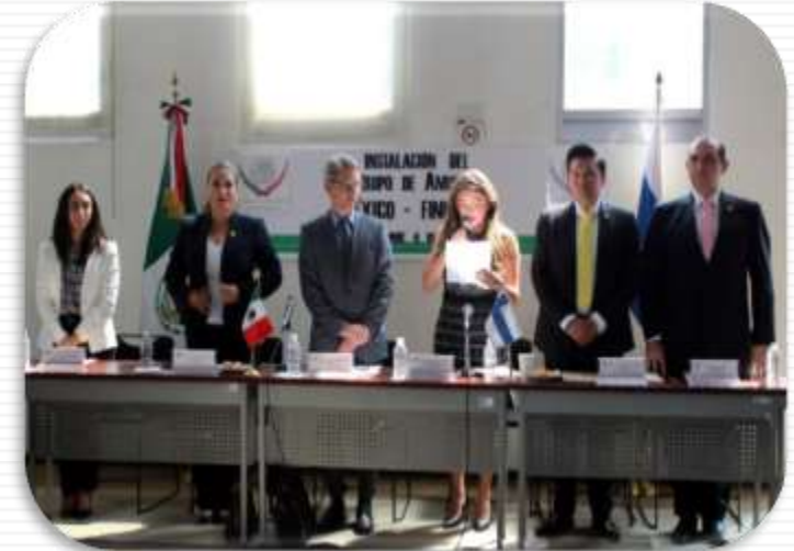
Foto: instalación del Grupo de Amistad México-Finlandia

Es un orgullo, formar parte de este Grupo de Amistad, estoy seguro se puede aprender mucho en materia de desarrollo sostenible de este país.