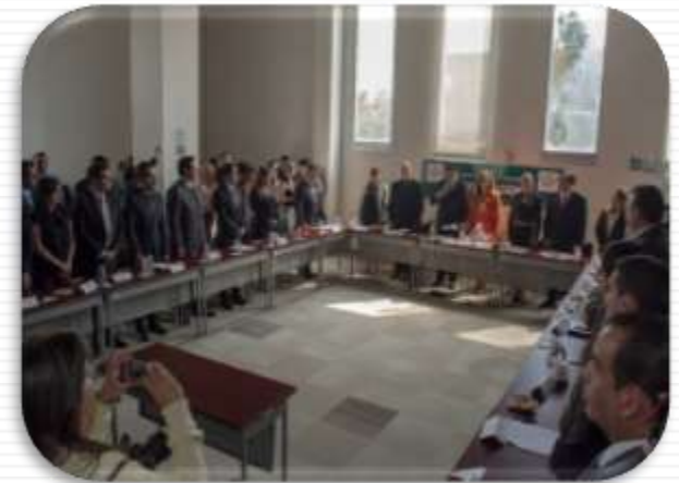
Foto: sesión instalación de la Comisión de Desarrollo Metropolitano.

Al tenor de esta perspectiva, los integrantes de la Comisión de Desarrollo Metropolitano, instalamos formalmente la comisión el 12 de octubre de 2015.