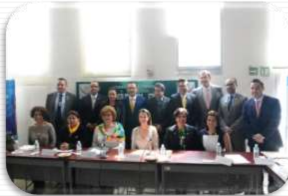
Foto: instalación de la Comisión de Ciencia y Tecnología, 8 de octubre de 2015.

Así, mi principal compromiso con el sector –del cual provengo y conozco las deficiencias por las que atravesamos los investigadores y científicos- es reforzar lograr que, usando la facultad exclusiva de la Cámara de Diputados para aprobar anualmente el Presupuesto de Egresos de la Federación, se invierta mayor presupuesto a la Ciencia y Tecnología, no por cumplir una de las metas del actual gobierno, sino porque es una cuestión de reconocimiento e impulso para el desarrollo del país.