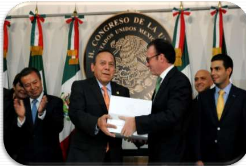
Foto: entrega del Paquete Económico 2016, en el centro, Presidente de la Mesa Directiva de la Cámara de Diputados, Diputado Jesús de Zambrano Grijalva y Dr. Luis Videgaray Caso, Secretario de Hacienda y Crédito Público.

En el presupuesto se incluyen todos los sectores que atiende el gobierno; es decir, el sector social, ambiental, educación, económico, de seguridad pública, defensa nacional, campo, tecnológico, energía, etcétera.