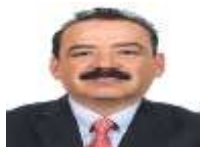
DIP. RAMÓN VILLAGÓMEZ GUERRERO PRI