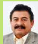
Sen. Isidro Pedraza Chávez PRD Hidalgo