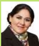
Sen. Diva Hadamira Gastélum Bajo PRI Lista Nacional