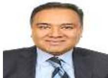
DIP. ULISES RAMÍREZ NÚÑEZ PAN