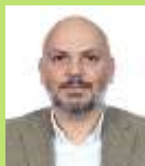
Dip. Germán Ernesto Ralis Cumplido MC Jalisco