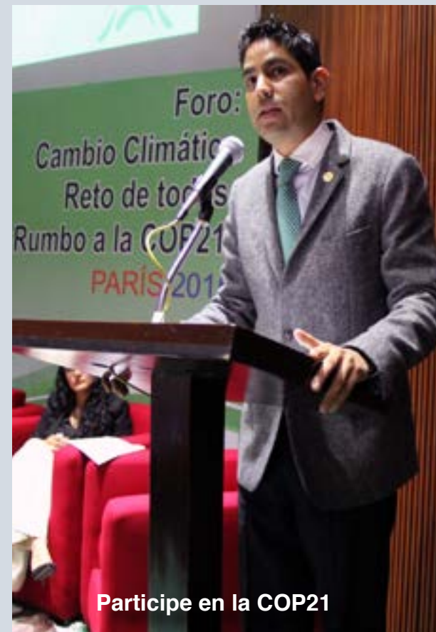
Participe en la COP21

5 Promovimos que los patrones que empleen jóvenes o que los prefieran en igualdad de circunstancias reciban el Vale del Primer Empleo como un incentivo fiscal