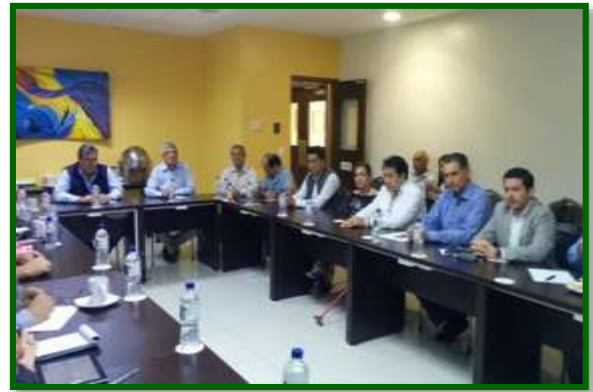
Reunión de trabajo con personal del Clúster Naval de Mazatlán, Sinaloa