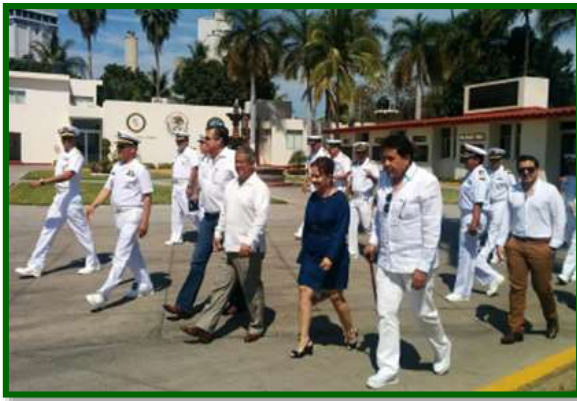
Visita a la Cuarta Zona Naval, Mazatlán, Sinaloa