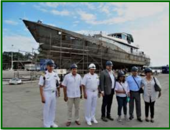
Recorrido por Astimar-1 y Patrullas Costeras en construcción