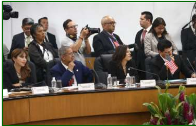
LIII Reunión Interparlamentaria México-Estados Unidos