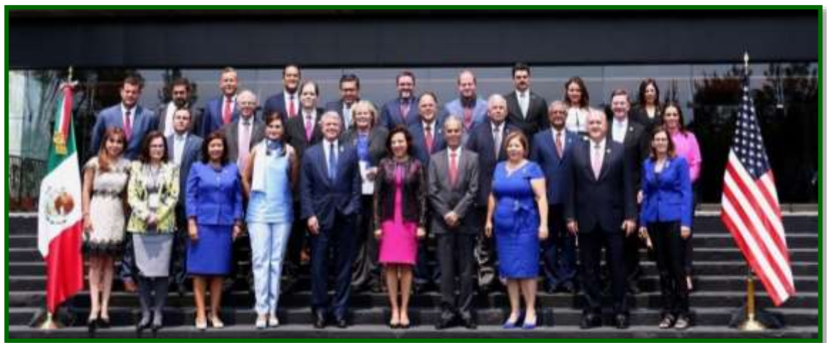
LIII Reunión Interparlamentaria México-Estados Unidos