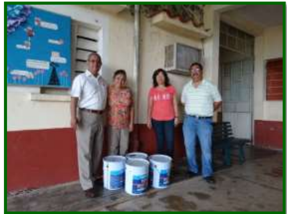
Escuela de Enfermería de Acayucan Entrega de impermeabilizante