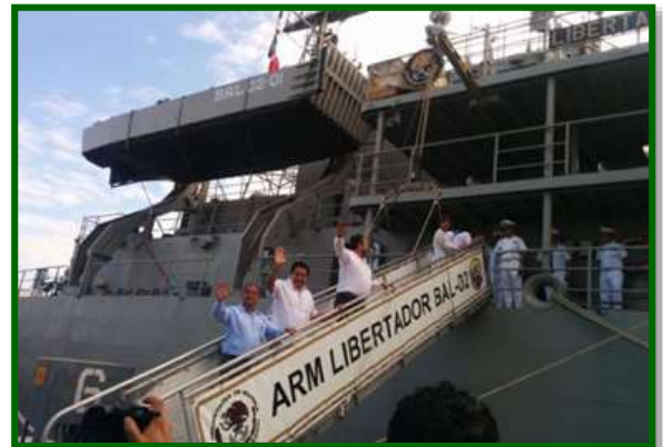
Visita a buques de la Armada de México