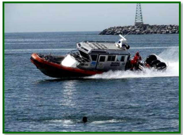
Práctica de la Brigada de Rescate