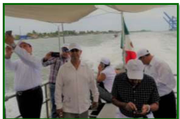
Recorrido por el Rio Tuxpan