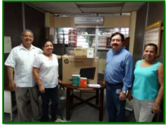
Escuela Secundaria General Acayucan Entrega de equipo de computo