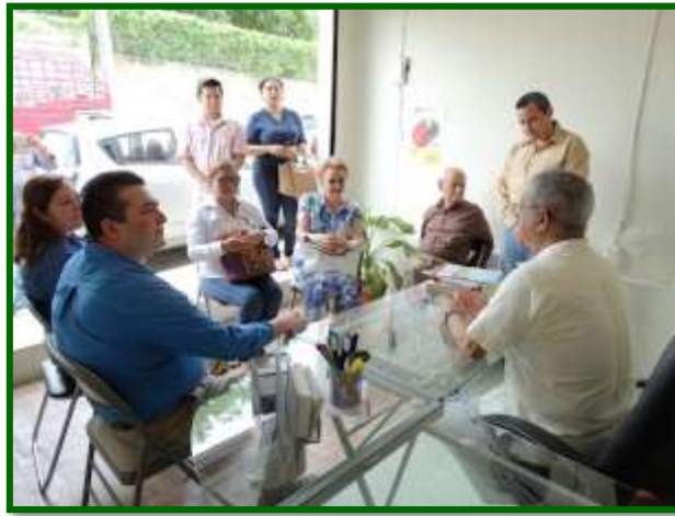
Atención a la ciudadanía en la Casa de Enlace en Acayucan, Veracruz