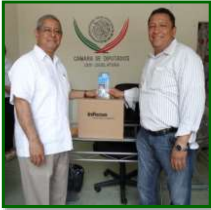
Instituto Tecnológico Superior de Acayucan Entrega de apoyos a la educación