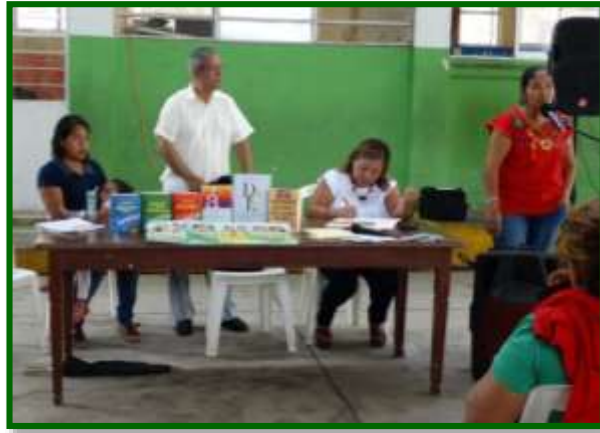
Escuela Pdte. Miguel Alemán (matutina) Entrega de material didáctico