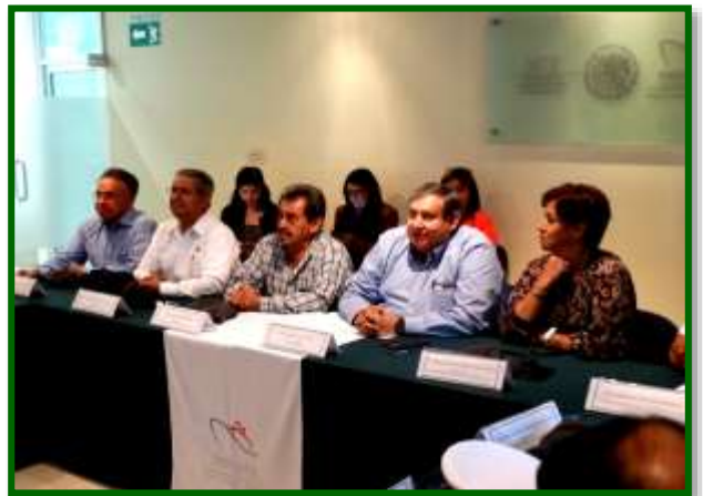
Servicios Portuarios de la API Ensenada