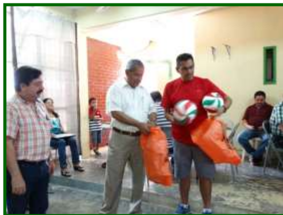
Escuela Secundaria General Acayucan Entrega de material deportivo