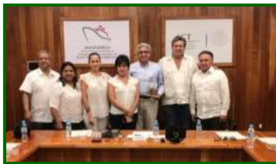
En Instalaciones de la API Manzanillo, Colima