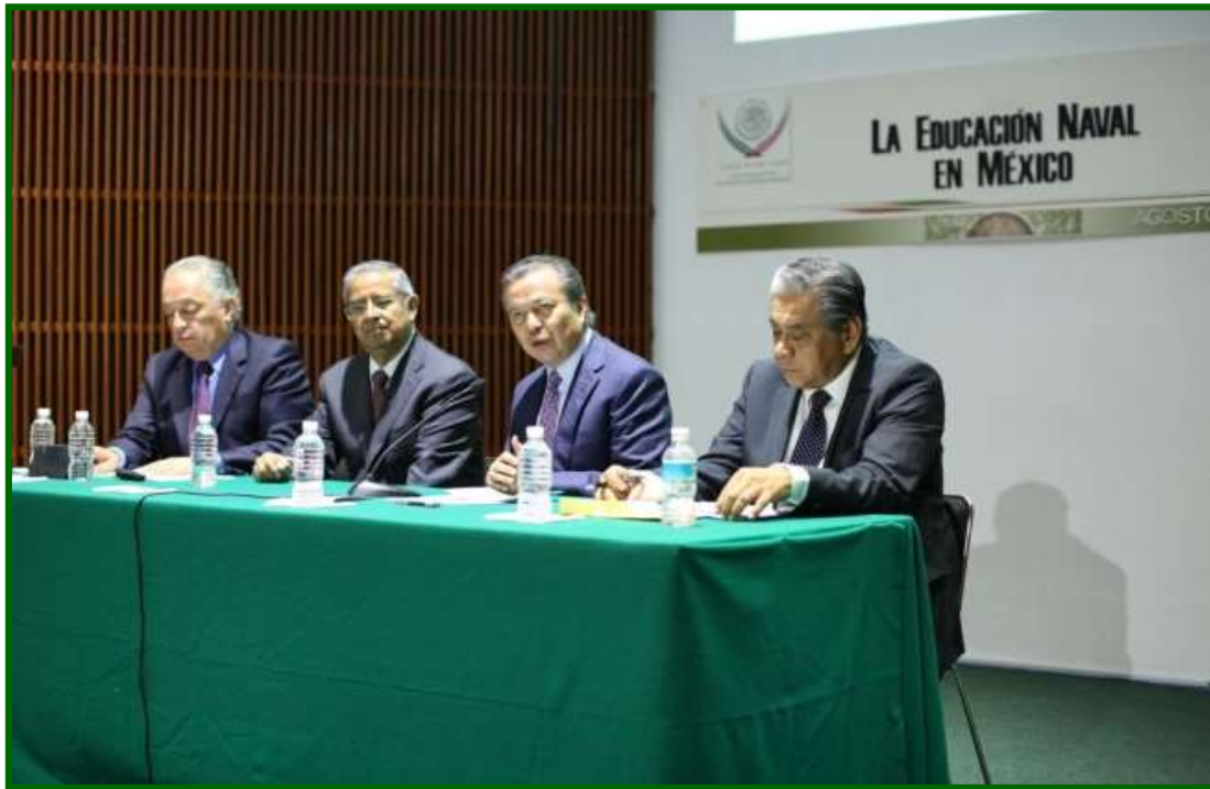
Foro: “La Educación Naval en México” (17 de agosto de 2017)