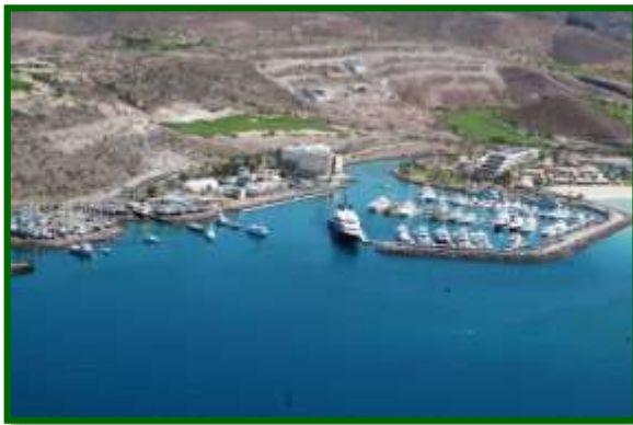
Marinas turísticas en la Paz