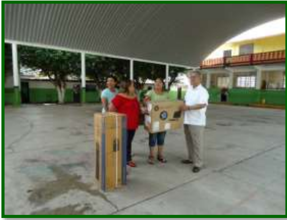
Escuela Pdte. Miguel Alemán (matutina) Entrega de equipo de sonido y de ayudas a la enseñanza