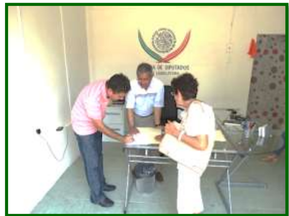
Atención a la ciudadanía en la Casa de Enlace en Acayucan, Veracruz