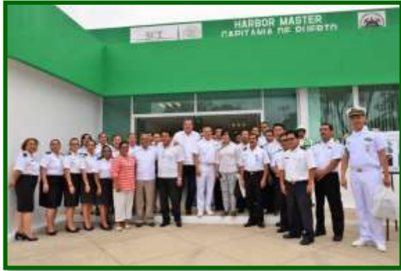
En La Capitanía de Puerto en Coatzacoalcos, Veracruz