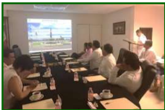
Presentación en Instalaciones de la Sexta Zona Naval Manzanillo, Colima