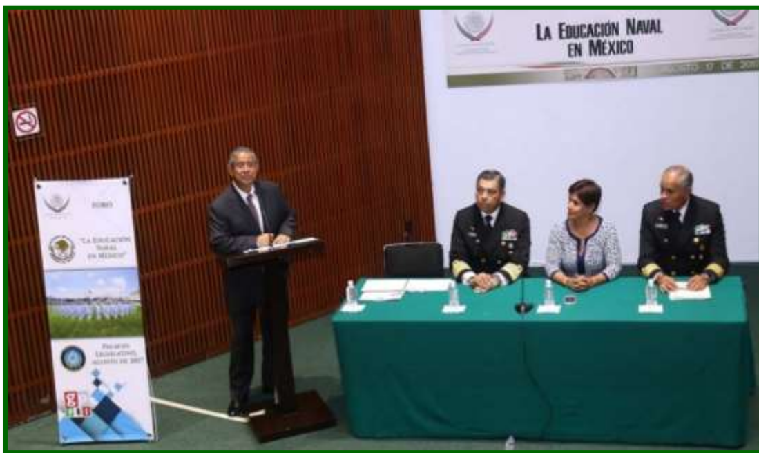
Foro: “La Educación Naval en México” (17 de agosto de 2017)