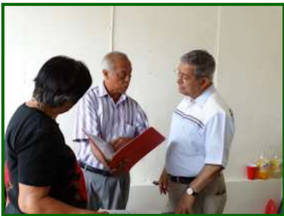
Atención a la ciudadanía en la Casa de Enlace en Acayucan, Veracruz