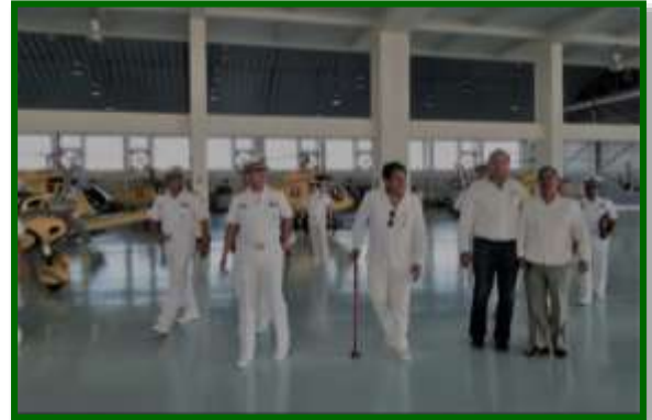
Demostraciones de la Base Aeronaval de La Paz, BCS