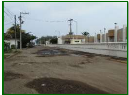
Antes del inicio de la obra