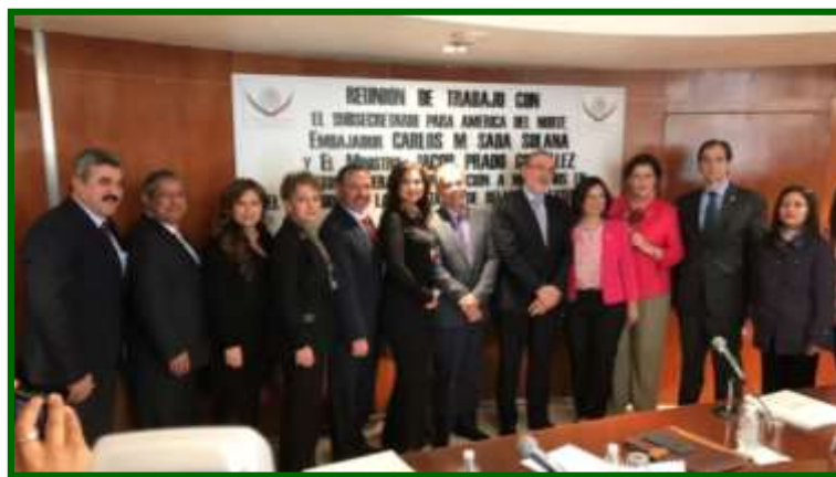
Reunión con el subsecretario para América del Norte

Respecto al Tratado de Libre Comercio estimó que será una negociación integral, “un paquete completo de temas que no se van a tratar por separado”.