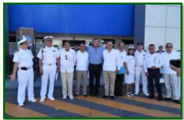
Recepción en API La Paz, BCS