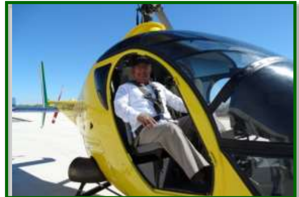
Alistamiento para sobrevuelo por la Bahía