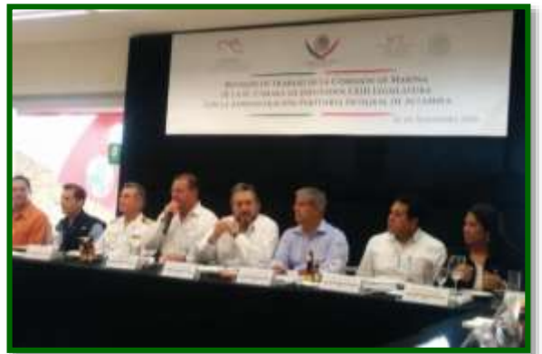
Presentación en Instalaciones de la API Altamira, Tamaulipas