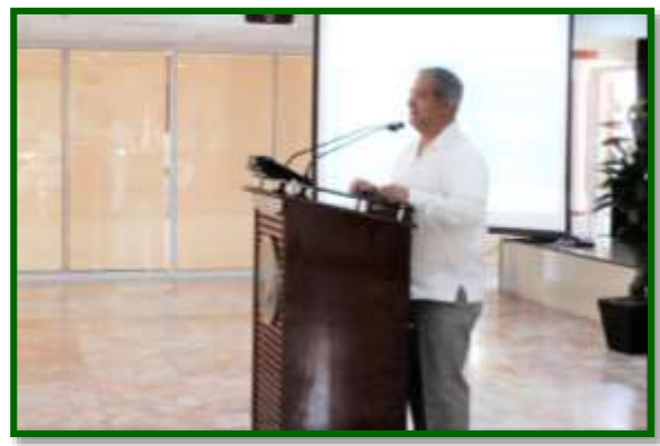
Agradecimiento a la Presentación en ZN-4