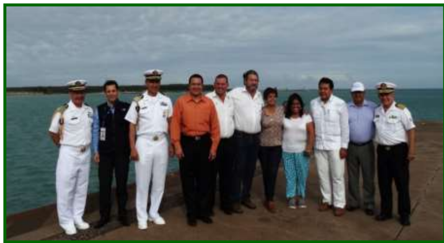
Recorrido por Recintos fiscales de API Altamira