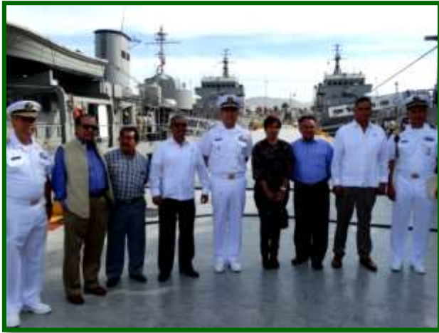
Visita a las instalaciones de la Segunda Región Naval