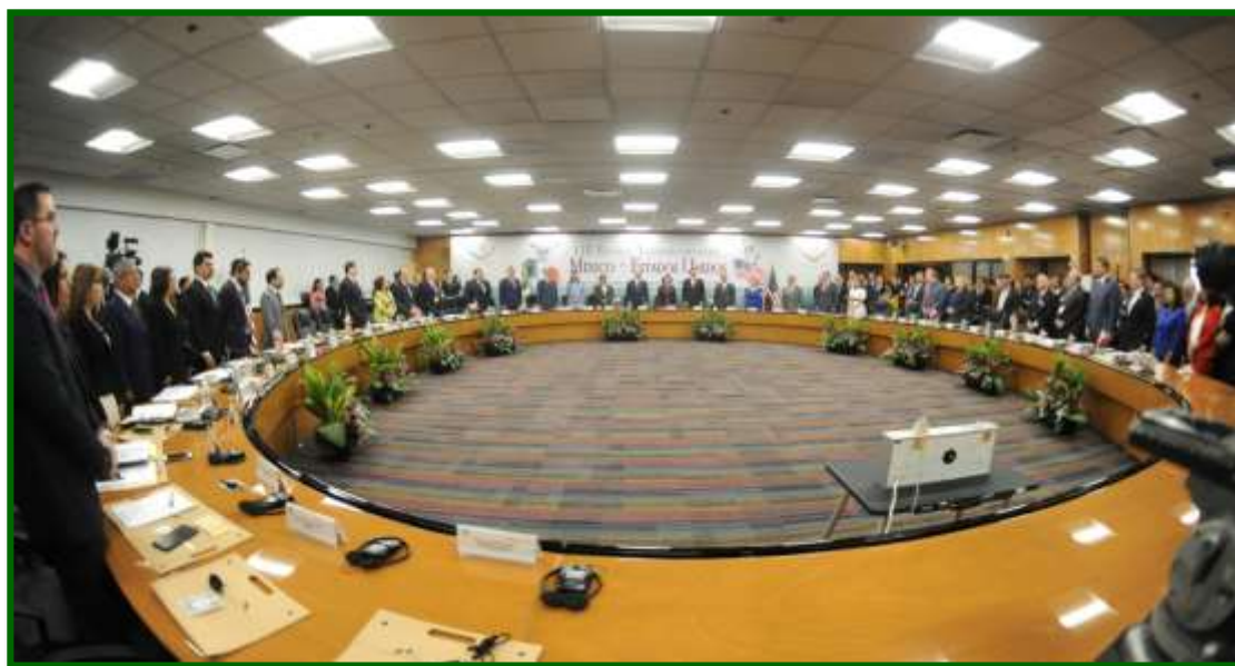
LIII Reunión Interparlamentaria México-Estados Unidos

Los integrantes de la delegación de la Cámara de Diputados del honorable Congreso de la Unión de México y de la delegación del Congreso de los Estados Unidos de América, convinieron la siguiente: