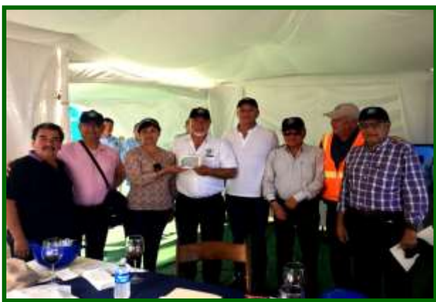
Visita a los Astilleros Progreso