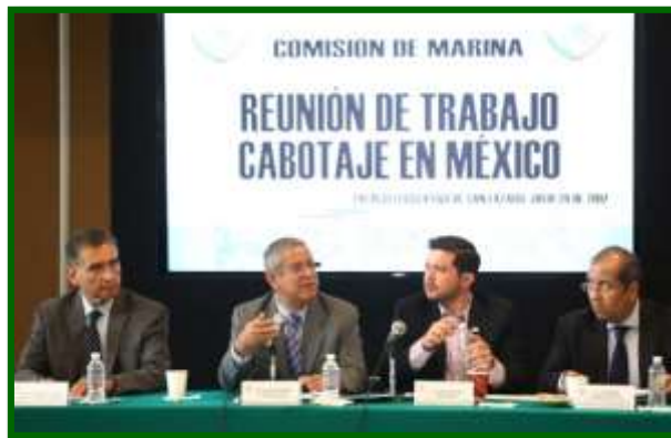
Reunión de Trabajo Cabotaje en México (20 de julio 2017)

Puertos y Marina Mercante se comprometió a agilizar una reunión en sus oficinas y apoyar el cabotaje en México. El titular de la Administración Central de Operación Aduanera de la Secretaría de Hacienda y Crédito Público se comprometió a revisar los lineamientos de las aduanas marítimas.