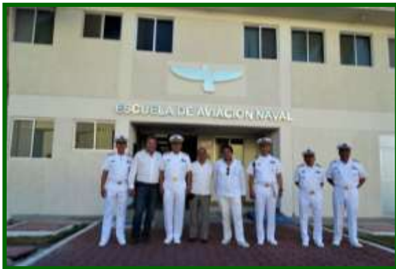
En la Escuela de Aviación Naval