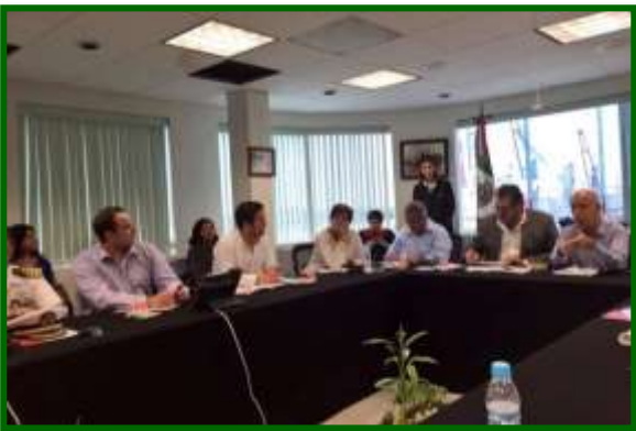
Presentación en oficinas de la API Tampico, Tamaulipas