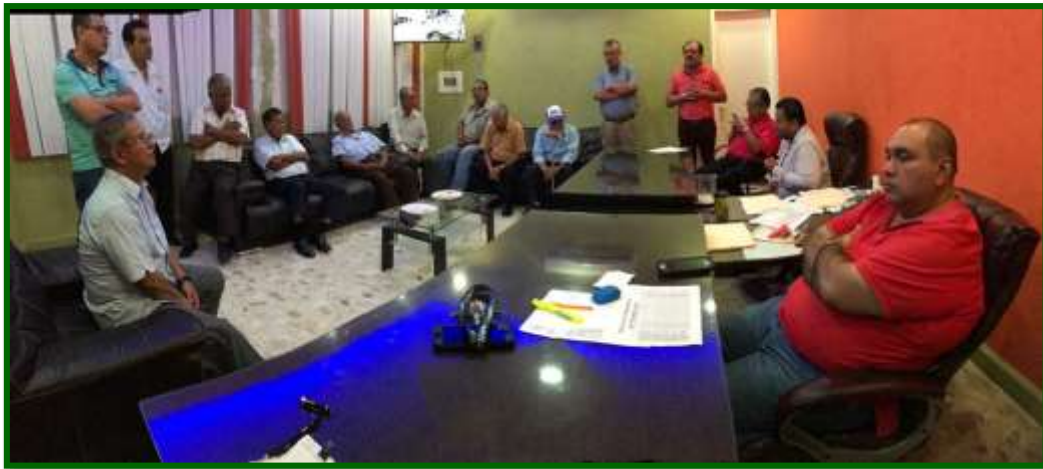
Reunión con transportistas, con problemas de seguridad social, en Acayucan, Ver.