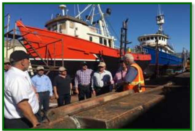
Recorrido por las Instalaciones de los Astilleros Progreso