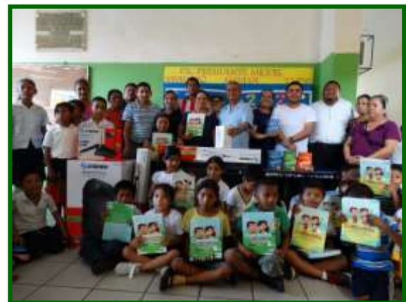
Escuela Pdte. Miguel Alemán (vespertina) Entrega de material didáctico y equipo de ayudas a la enseñanza