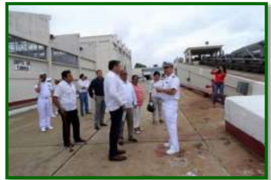
En el ASTIMAR-3 de Coatzacoalcos, Veracruz