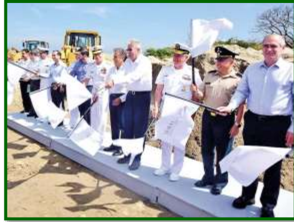
Inauguración de la Obra en la localidad de Antón Lizardo