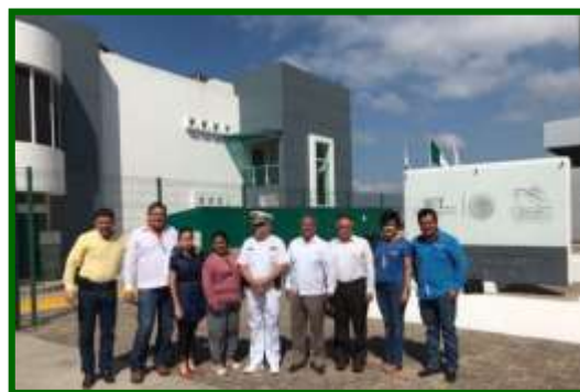
Visita a la Capitanía del Puerto de Manzanillo, Colima