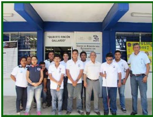
Centro de Atención para Estudiantes Discapacitados del CBTIS No. 48 Entrega de insumos de cómputo