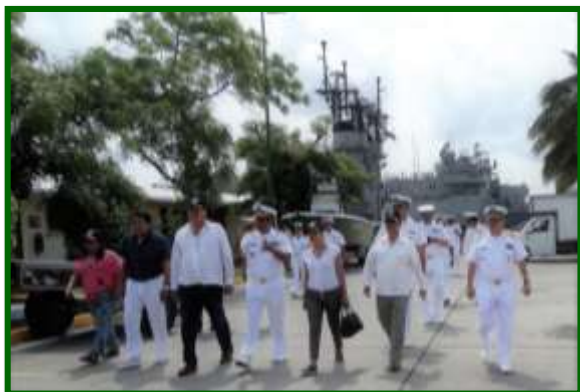
Áreas de la Fuerza Naval del Golfo En Tuxpan, Ver.