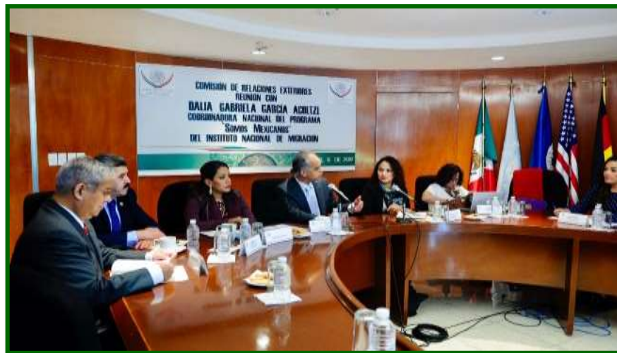
Reunión de trabajo con la Coordinadora Nacional del programa “Somos Mexicanos”

Durante la reunión, la Coordinadora afirmó que del 1 de enero al 31 de marzo de 2017, Estados Unidos deportó 38 mil 467 personas; en el mismo periodo de 2016, fueron 50 mil 69, es decir, 11 mil 602 menos. Informó que sólo 6 por ciento de la población repatriada cometió algún delito, aunque “se tiene que comprobar, porque hay casos de personas que son inocentes y están acusadas de transgresión de la ley, por lo que no tenemos que estigmatizar criterios. Nosotros nos basamos en quién tiene delitos aquí, en México”. Indicó además que el Instituto tiene módulos de repatriación en Tijuana, Mexicali, San Luis Río Colorado, Ciudad Juárez, Ojinaga, Ciudad Acuña, Piedras Negras, Nuevo Laredo, Reynosa y Matamoros, donde se apoya a los deportados a obtener su constancia de repatriación y copia certificada de la Clave Única de Registro de Población (CURP).