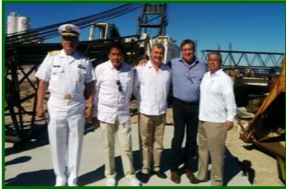
Visita a la Segunda Zona Naval en La Paz, BCS