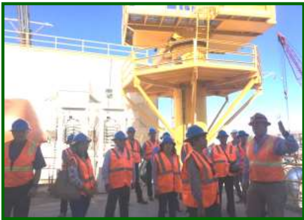
Visita a las instalaciones de Baja Aquafarms