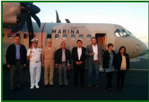
Visita a las Instalaciones de la Base Aeronaval de Tampico, Tamaulipas