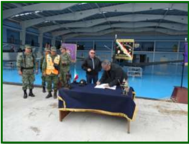
Viaje de Trabajo a la 4/a. Brigada de Policía Militar y Base Aérea Militar No. 14 en Apodaca, Nuevo León