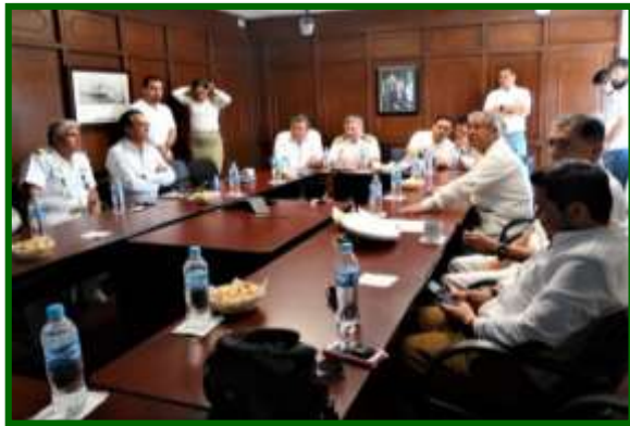
Visita a las Instalaciones de la API de Mazatlán, Sinaloa