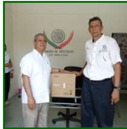
CEBTIS No. 48 Mariano Abasolo en Acayucan Entrega de apoyos a la educación