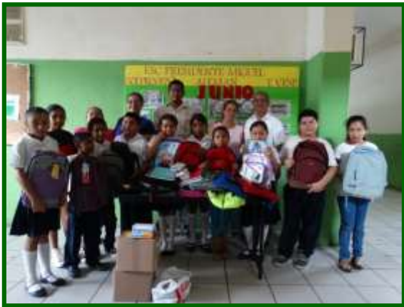
Escuela Pdte. Miguel Alemán (vespertina) Entrega de equipo de apoyos a la educación