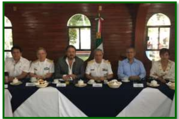
En las Instalaciones de la Primera Zona Naval, en Tampico, Tamaulipas