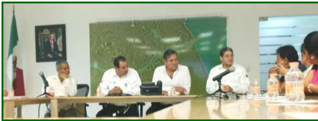
Visita a la Coordinación de Puertos y Marina Mercante de Tuxpan, Veracruz