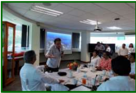
Presentación de la API Coatzacoalcos, Ver.