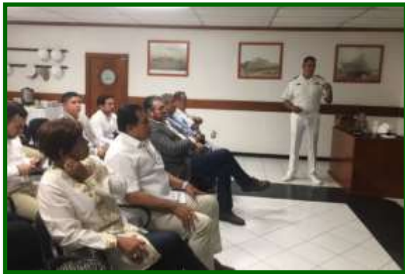
Presentación del Astillero de Marina No. 1