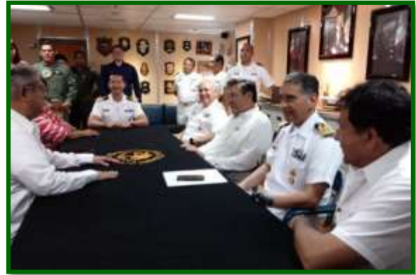
En la Cámara del ARM Guanajuato (PO-153)