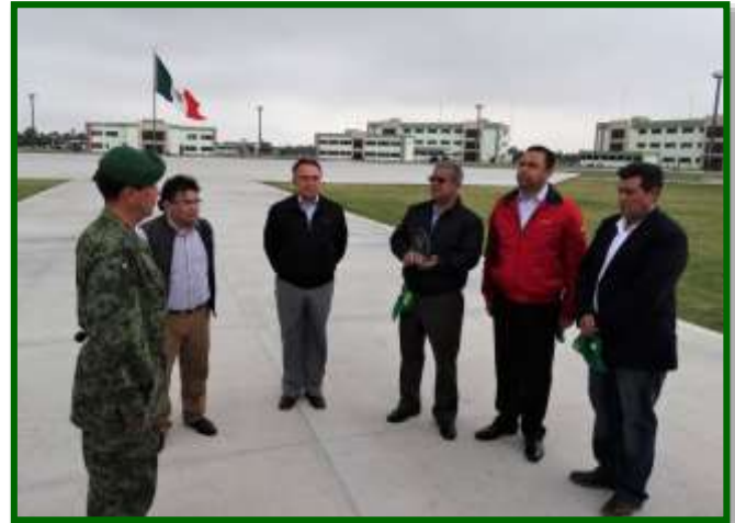
Viaje de Trabajo a la 4/a. Brigada de Policía Militar y Base Aérea Militar No. 14 en Apodaca, Nuevo León