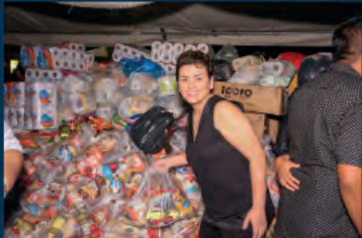
El 25 de septiembre, tras la evaluación y recuento de los daños ocasionados por el sismo del 7 de septiembre, continué con mi compromiso de ayuda a los damnificados del Estado de Chiapas, acudiendo a centros de acopio con la entrega de despensas y víveres para los damnificados.