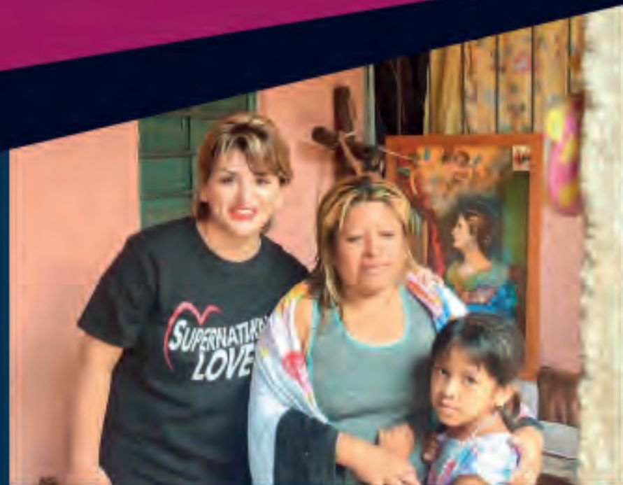
El 9 de septiembre de 2017 visité familias afectadas en colonias marginadas de la ciudad de Tuxtla Gutiérrez Chiapas