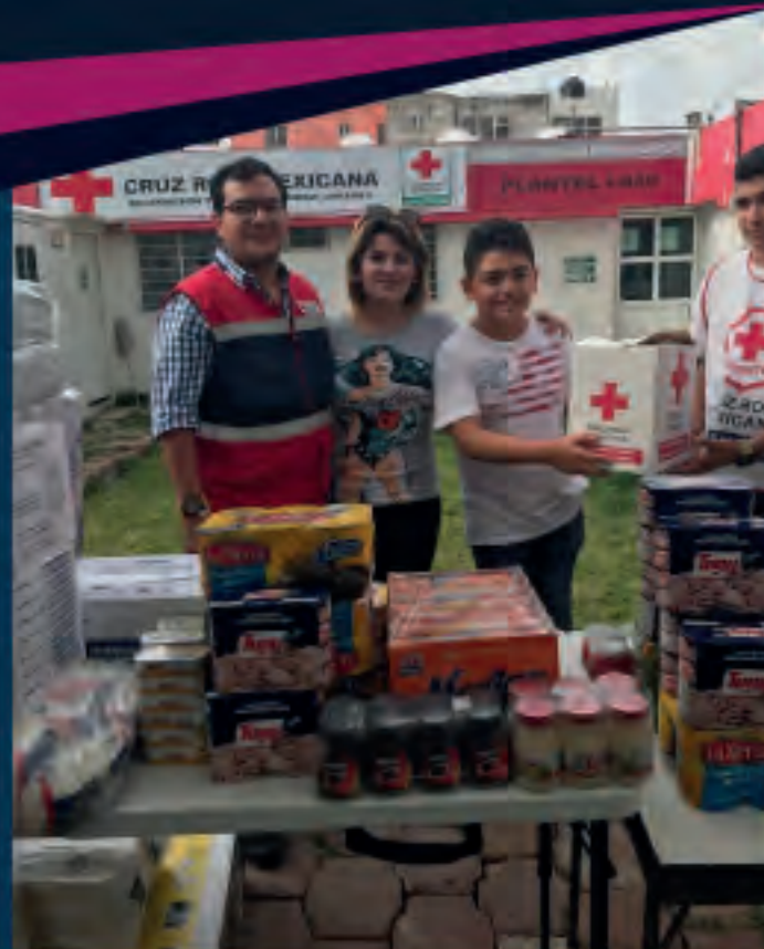
El 8 de septiembre de 2017 entregué personalmente víveres y artículos de limpieza a la Cruz Roja Chiapas para los afectados por el sismo ocurrido el 7 de septiembre

El 11 de septiembre participé en la reunión con el secretario de SEDESOL Luis Miranda, se determinaron equipos de trabajo integrados por autoridades federales y estatales para hacer frente a los daños causados por el sismo del pasado jueves 7 de septiembre de 2017.