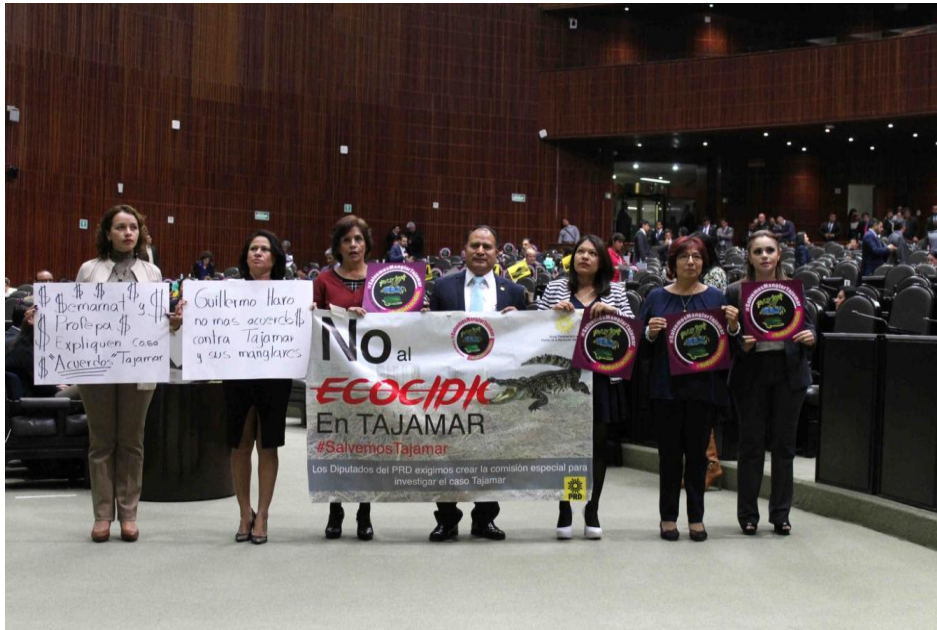
“EL MANGLAR NO SE VENDE, SE DEFIENDE” 3