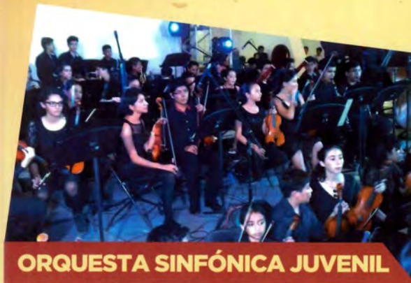
ORQUESTA SINFÓNICA JUVENIL

Gestioné recurso para beneficiar a más de 300 familias, con compromiso y decisión para que cuenten con una vivienda digna.