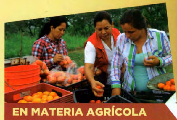
EN MATERIA AGRÍCOLA

Respaldando y apoyando a jóvenes, etiqueté y entregué 2 millones de pesos. A esta talentosa y maravillosa orquesta para solventar las necesidades y efectuar sus giras.