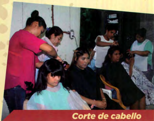
Corte de cabello