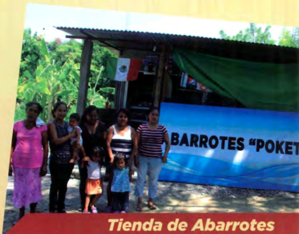
Tienda de Abarrotes