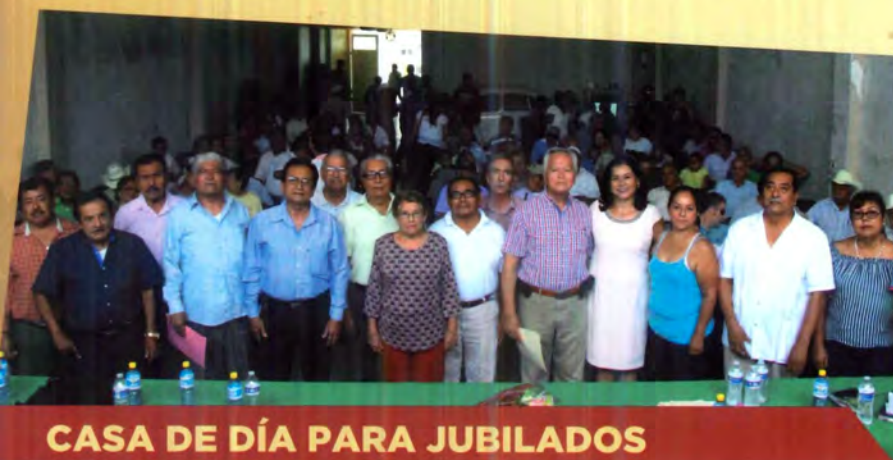
CASA DE DÍA PARA JUBILADOS

Se proyecta y gestiona los recursos para dotar de infraestructura moderna y hacer realidad el proyecto de un gran invernadero en el ejido Laguna del Mante, para el cultivo de jitomate y su organización mediante una cooperativa.