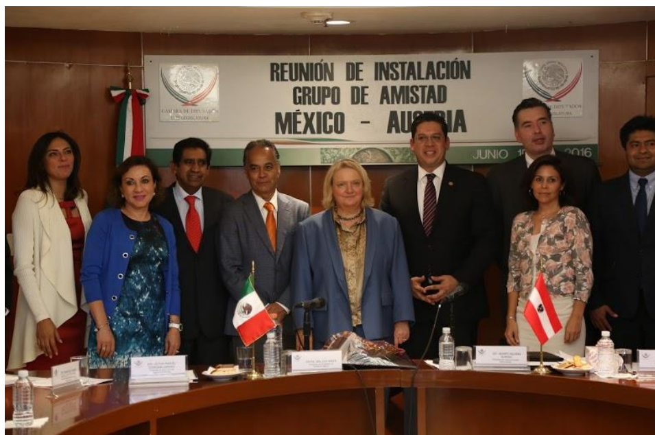
Instalación del Grupo de Amistad México-Austria