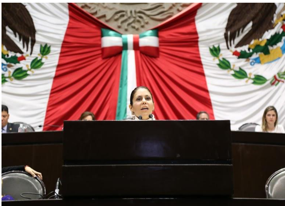
Intervención sobre la reforma política de la Ciudad de México PRODUCTIVIDAD LEGISLATIVA