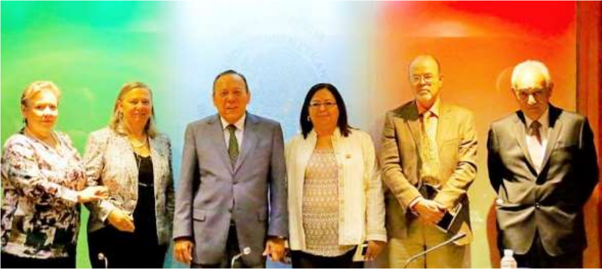
Instituto Nacional para la Evaluación de la Educación (INEE)

Rectores de las universidades de Guerrero, Oaxaca, Michoacán, Morelos, Nayarit y Chiapas