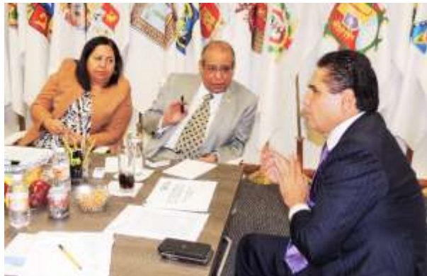
Gobierno de Michoacán

28 de octubre del 2015.- Como presidenta de la Comisión de Educación, organicé en la Cámara de Diputados el “Foro de Evaluación del Gasto Educativo en México” en el que participaron integrantes de la Junta de Gobierno del Instituto Nacional para la Evaluación de la Educación (INEE), quienes nos dieron a los legisladores mayor información para la asignación de recursos en materia educativa en el Presupuesto de Egresos de la Federación 2016.