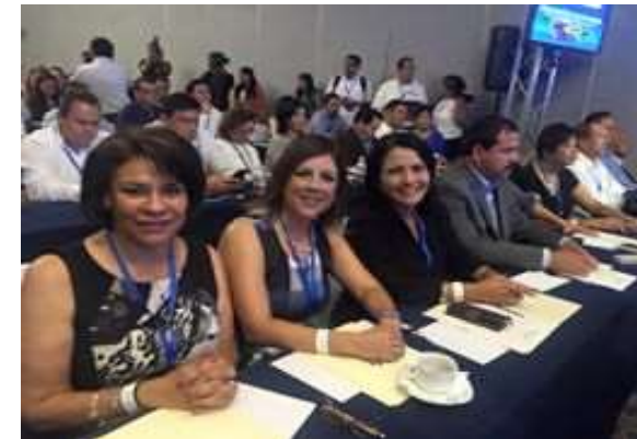
24 de Agosto del 2015 Entrega de Constancia de Asignación de Diputados Electos por el Principio de Representación Proporcional expedida al Partido Acción Nacional por el Consejo General del INE