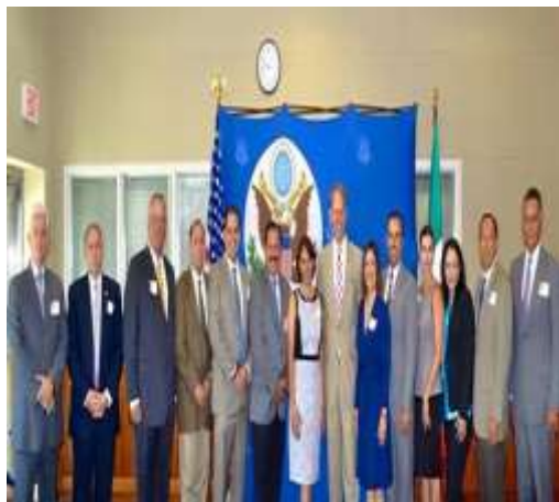
20 de Agosto del 2015 Reunión de trabajo con el Consul General de Estados Unidos en Tijuana William A. Ostick con jurisdicción en la Península de Baja California