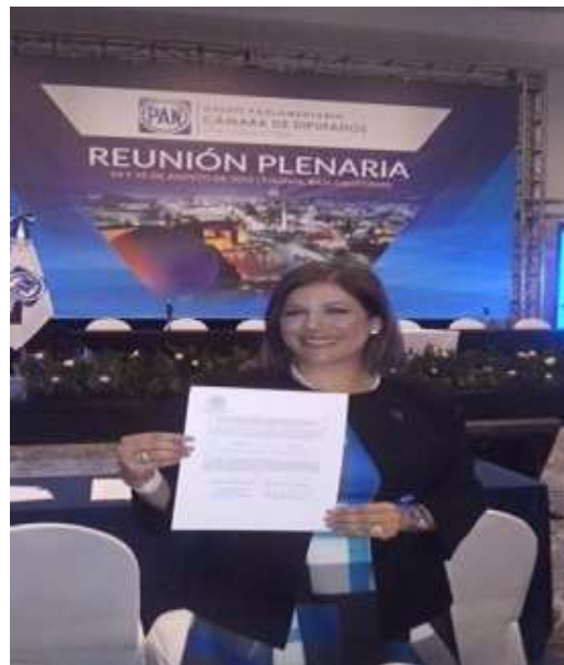
24 de Agosto del 2015 Reunión Plenaria del Grupo Parlamentario del PAN, con mucho entusiasmo de representar a los Bajacalifornianos en la LXIII Legislatura Sesión consecutiva