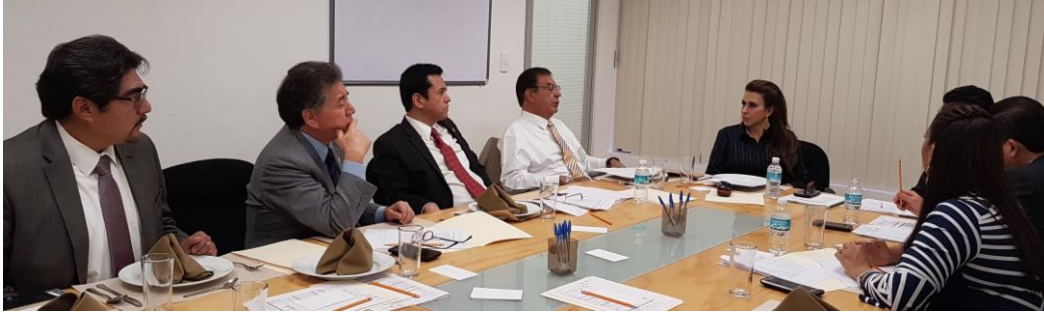
REUNIÓN DE JUNTA DIRECTIVA. PREPARANDO LOS TEMAS PARA LA 8ª REUNIÓN