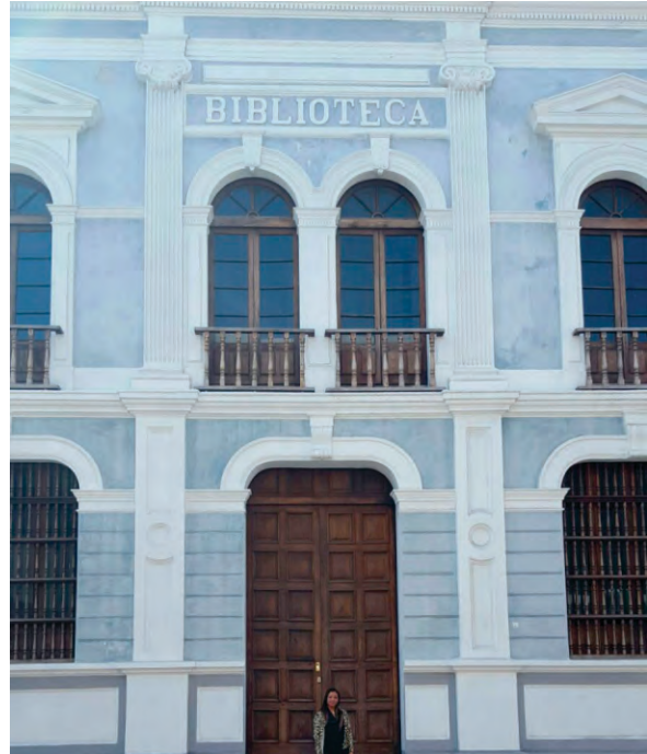
Hoy día que hemos concluido el proyecto

Considero que fomentar la cultura en México es trascendental para el desarrollo de nuestro país, ya que fortalece nuestra identidad, amplía nuestra educación y nos permite contribuir y enriquecer el mundo; asimismo, la cultura es un legado con el que se permite transmitir conocimiento y experiencias para las futuras generaciones.