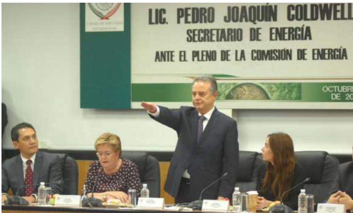
Comparecencia del Lic. Pedro Joaquín Coldwell ante la comisión

La cual tuvo verificativo el día 13 de octubre de 2016, en la que se revisaron los temas de medio ambiente y de las estaciones de medición de temperatura de la Comisión Nacional del Agua y propuestas para cambiarlas de ubicación.