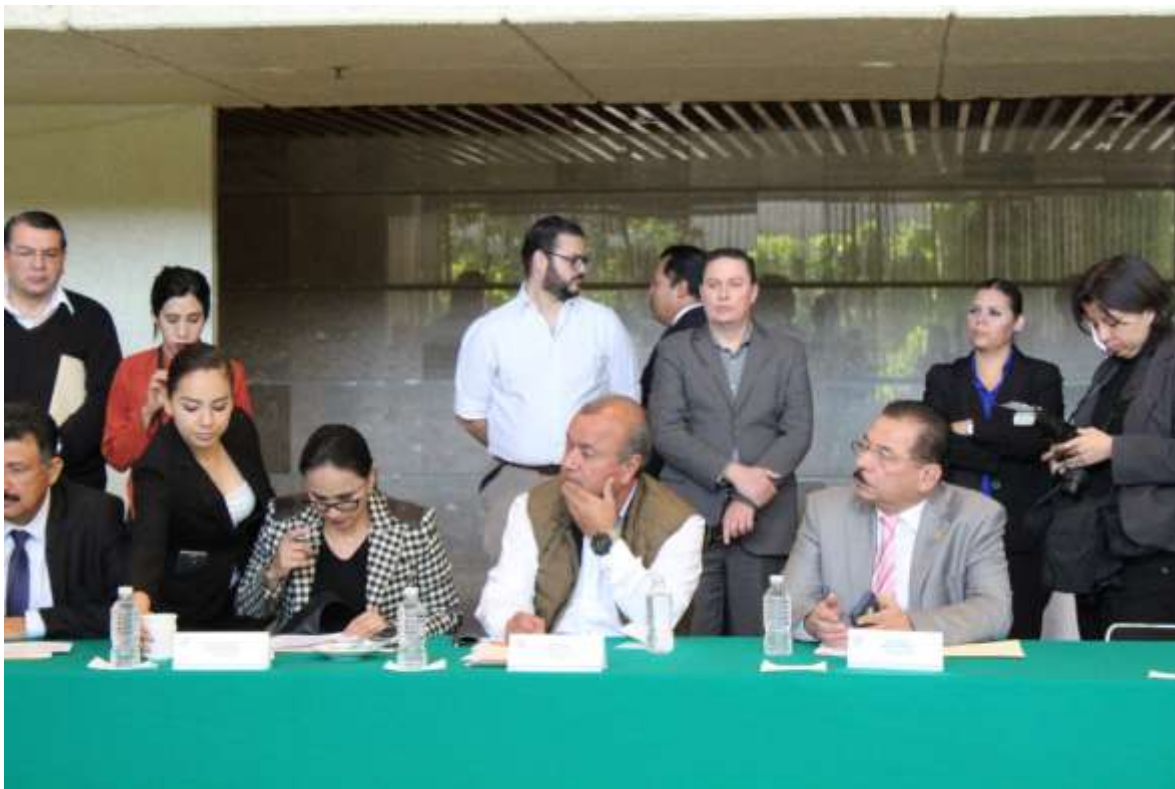
Reunión ordinaria de la comisión