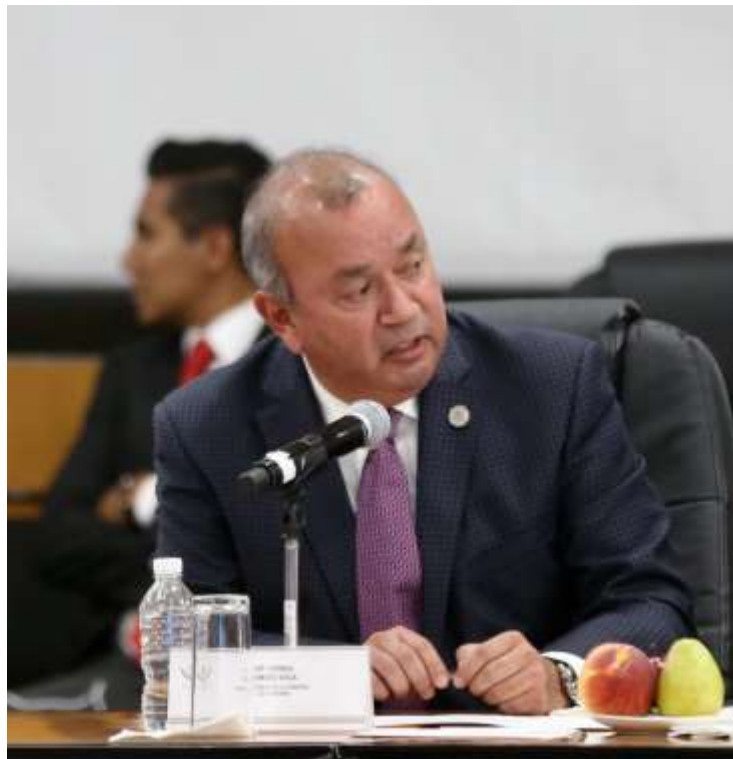
Intervención durante la comparecencia del Secretario de Economía

– En cumplimiento al artículo 39 de la Ley Orgánica del Congreso General de los Estados Unidos Mexicanos, una de las principales funciones de las comisiones constituye la elaboración de dictámenes. La Comisión de Economía, atenderá con toda oportunidad los turnos de iniciativas, proposiciones con punto de acuerdo, minutas y demás asuntos que reciba, apegada siempre al Reglamento y a las mejores prácticas parlamentarias.