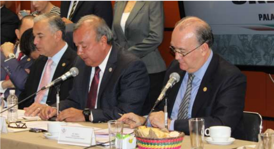
Reunión ordinaria de la comisión