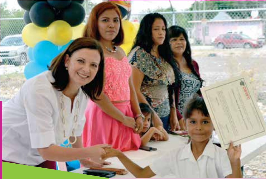
Durante la entrega de diplomas y reconocimientos en la Escuela Primaria y Prescolar Comunitaria "Nuevo Amanecer", en la ciudad de Reynosa Tamaulipas, 8 de julio de 2017.