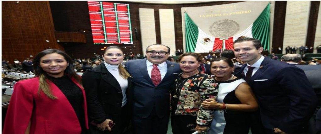
Instalación de la Mesa Directiva