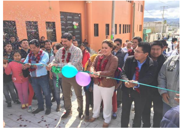
9 de marzo Recorrido, Universidad Abierta y a Distancia de México