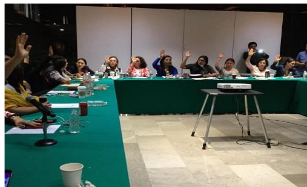
20 de octubre, Reunión de la Comisión de Igualdad de Género, PRESUPUESTO