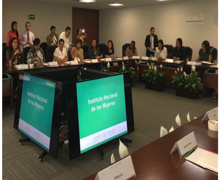
29 de marzo Reunión con el Consejo Consultivo de INMUJERES