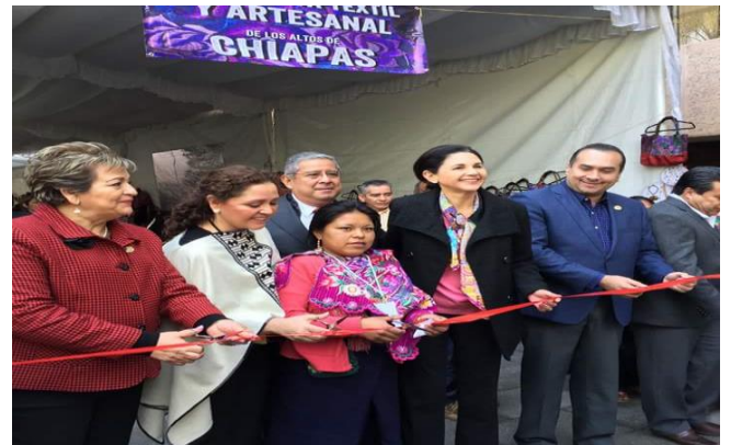
Inauguración Expo Venta Textil y Artesanal

comercialización de la misma, se llevó a cabo en la Cámara de Diputados la “Expoventa Textil y Artesanal de Los Altos de Chiapas”, en el mes de diciembre de 2016, generando con ello una dinámica de promoción cultural e interacción económica en beneficio de diversas comunidades artesanales y más de 100 familias de la región.