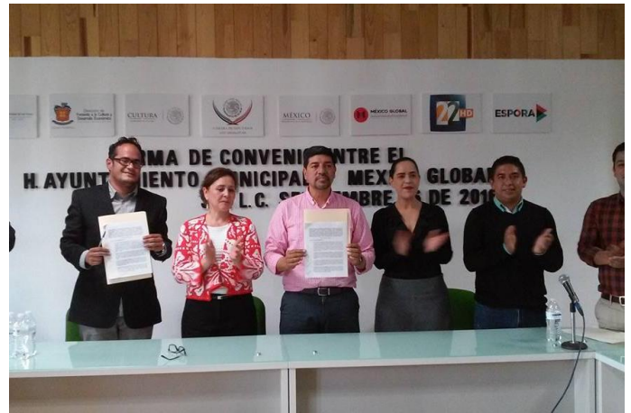
29 de septiembre Firma de convenio con el H. Ayuntamiento de San Cristóbal de las Casas, México Global