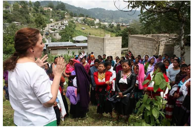
13 de mayo Reunión con Mujeres de Spuilhó, del Municipio de Huixtán