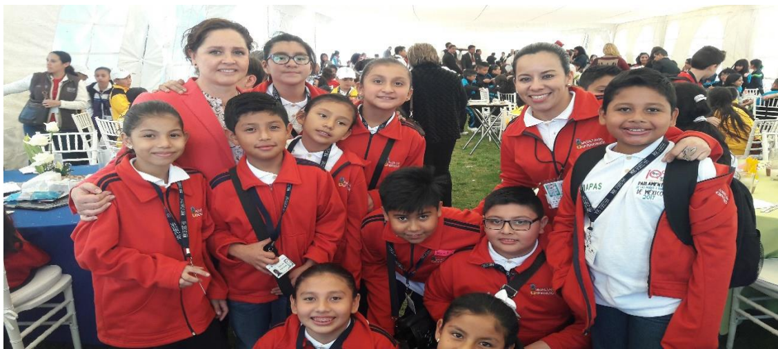
Diputados Infantiles por Chiapas

Las y los niños que participaron promovieron sus propuestas destacando temas como: familia, valores, medio ambiente, contaminación, educación, seguridad, participación, justicia, acceso a una vida libre de violencia, migración, pobreza, así como la defensa el ejercicio pleno de los derechos de la niñez, entre otros, concluyendo con el documento denominado “Declaratoria de los Trabajos del Décimo Parlamento”.