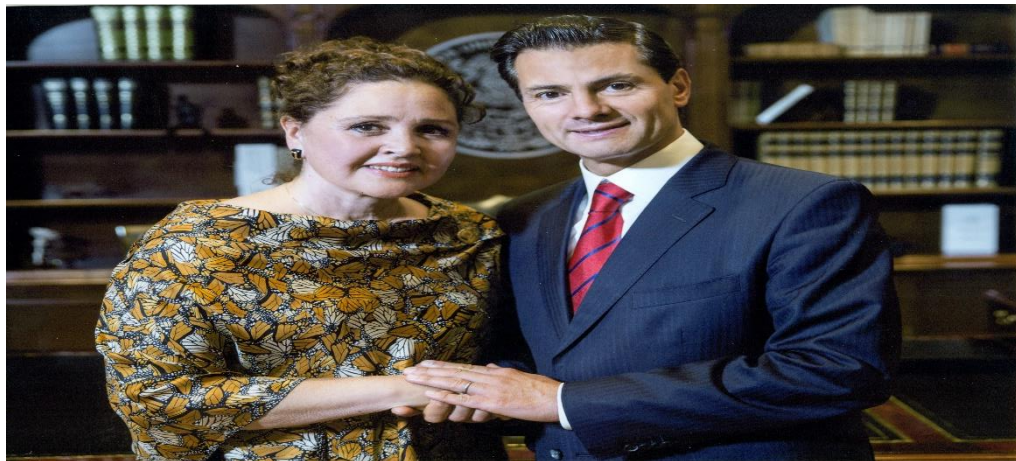
Con el Presidente de México, Lic. Enrique Peña Nieto