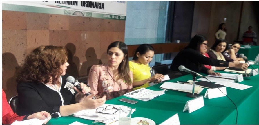
1 de marzo Reunión de Comisión de Igualdad de Género con enlaces de SAGARPA

Se efectuaron siete reuniones ordinarias, durante las cuales se realizó el análisis de temas relevantes como el proyecto de presupuesto transversal 2017 para la igualdad entre hombres y mujeres; propuestas de reforma a la legislación así como exhortos a diversas autoridades de los tres órdenes de gobierno a fin de fortalecer las acciones en favor de la igualdad de género.