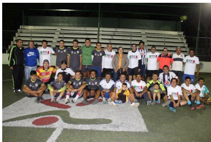
Este 2017 hicimos buen equipo con la Liga de Fútbol Infantil y Juvenil del Municipio de Zamora, gracias por invitarme a su posada

Las puertas de mi Casa de Enlace están abiertas para atender a toda la ciudadanía, el cual es un espacio de gestión y apoyo para quienes acuden a ella. Les reitero mi compromiso para seguir en ésta ruta y para seguir construyendo un mejor México para todos, pero sobre todo para mi querido Estado Michoacán. Hoy con tres años de trabajo legislativo, no me resta más que externar mi profundo agradecimiento a quienes me dieron su confianza para representarlos en la LXIII legislatura de la Honorable Cámara de Diputados; mi trabajo legislativo y de gestión ciudadana siempre fue hecho en pro del bienestar de los mexicanos, de los michoacanos y particularmente de mis representados en el Distrito V electoral. A las autoridades federales, estatales y municipales, que con su colaboración pudimos atender la mayoría de las gestiones requeridas en su momento procesal oportuno.