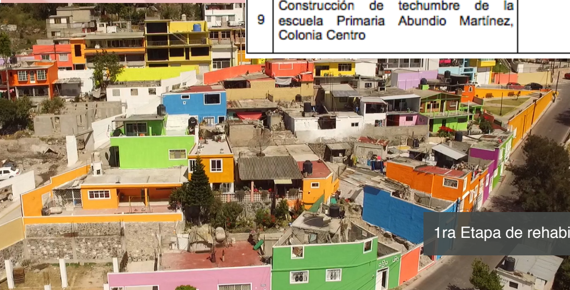
1ra Etapa de rehabilitación Col. 16 de Enero, Tula