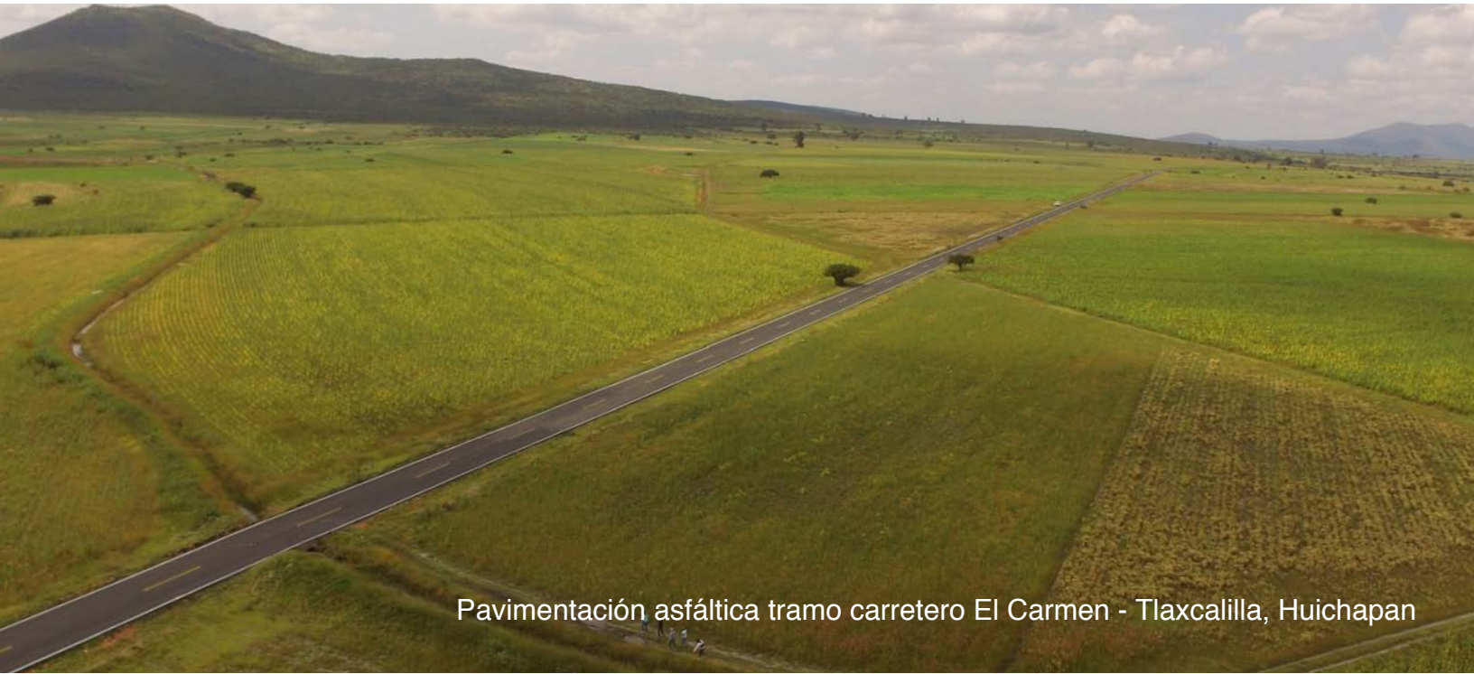
Pavimentación asfáltica tramo carretero El Carmen - Tlaxcalilla, Huichapan