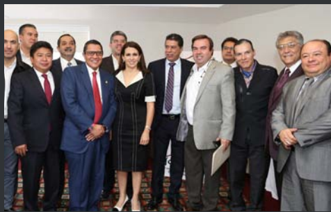
En reunión de trabajo con FONHAPO y CONOREVI.