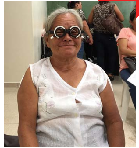
Beneficiaria de Huejutla a la que se le realizó optometría.