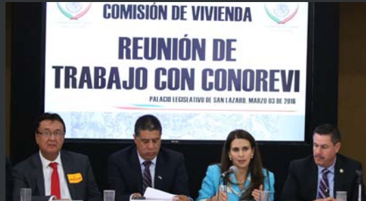
Reunión de trabajo con el Consejo Nacional de Organismos Estatales de Vivienda.