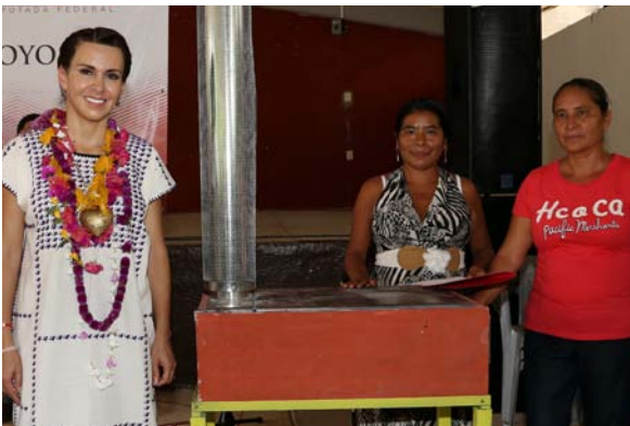
En Tlalnepanco durante la entrega de 26 estufas ecológicas.

Otro de los grandes problemas que presentan las viviendas rurales son las cocinas con fogones de leña que pueden perjudicar la salud de los habitantes, por esta razón, en conjunto con la Secretaría de Desarrollo Social del Gobierno del Estado, se entregaron 134 cocinas ecológicas en en 6 localidades de los municipios de Yahualica, Tepehuacán, Huejutla de Reyes y Huautla.