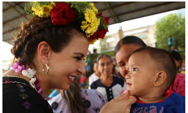
Conviniendo con niños huastecos durante las posadas decembrinas.