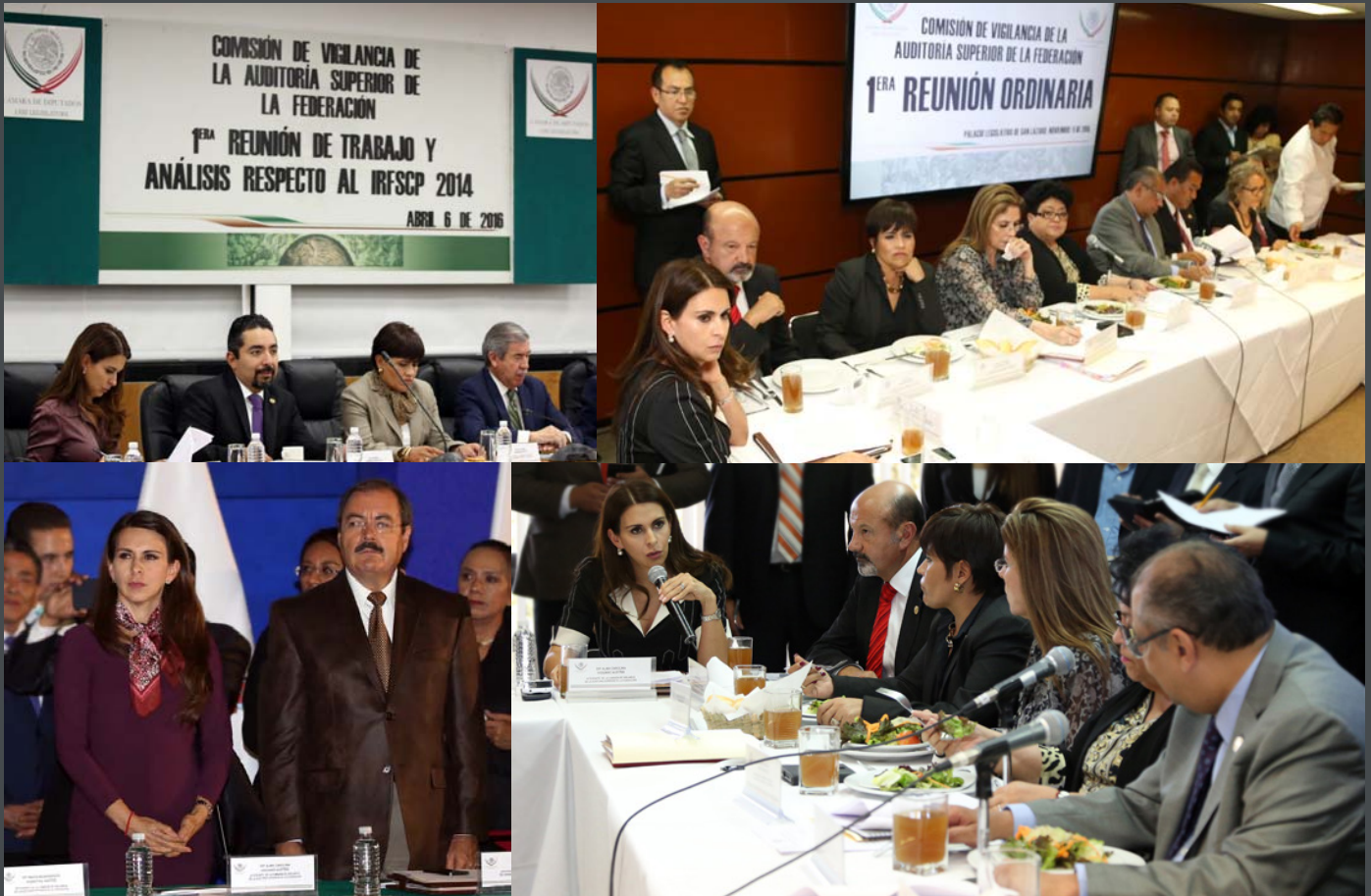
Reuniones Ordinarias de la Comisión de Vigilancia de la Auditoría Superior de la Federación.

Como integrante de la Comisión de Vigilancia de la Auditoría Superior de la Federación, asistí a las cinco reuniones ordinarias en las que revisamos el Informe del Resultado de la Fiscalización Superior de la Cuenta Pública 2014; analizamos y formulamos nuestra opinión sobre la nueva Ley Federal de Transparencia y Acceso a la Información Pública y, por último, hemos dado seguimiento a la construcción de la Nueva Sede de la Auditoría Superior de la Federación.