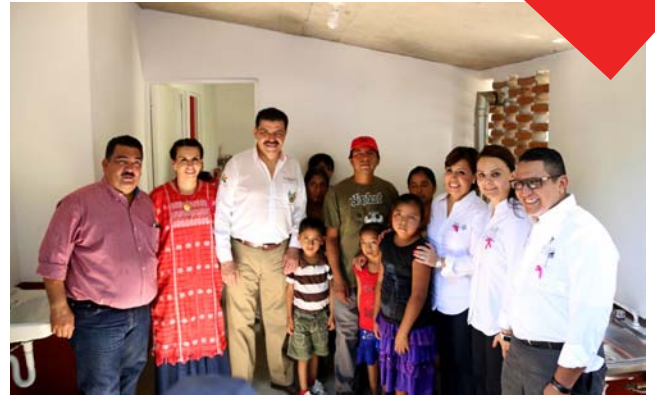
Con el exgobernador Francisco Olvera y la secretaria de SEDATU Rosario Robles en la entrega de Acciones de Vivienda en la huasteca hidalguense.

En coordinación con la Comisión Nacional de Vivienda (CONAVI) se han gestionado 100 créditos que incluyen un subsidio del Gobierno Federal por la mitad del costo de la vivienda, beneficiando al mismo número de familias en diferentes municipios de la Sierra y la Huasteca del sector transporte, comercio y trabajadores de gobiernos municipales.