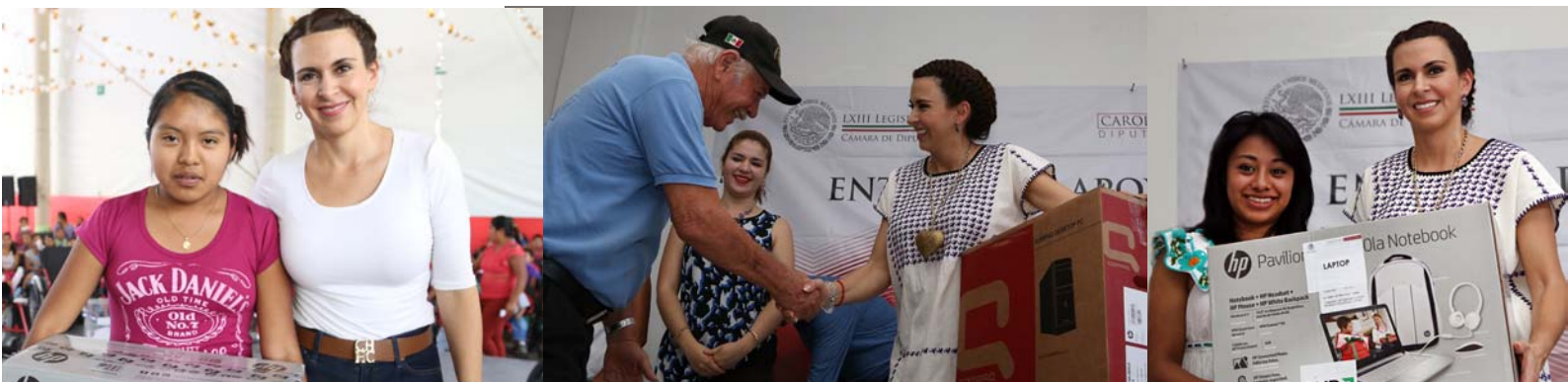
Entrega de equipos de cómputo a beneficiarios de Tepehuacán de Guerrero y Huejutla.