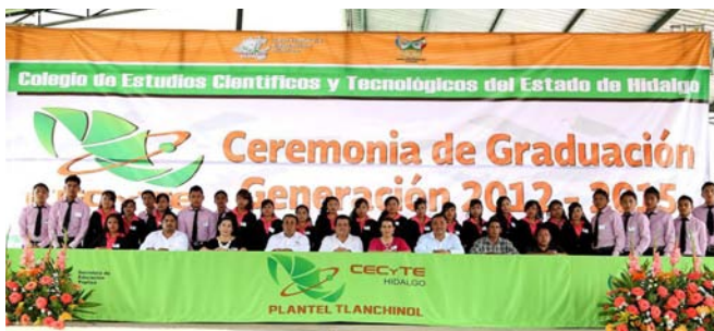
Graduación del CECyTE, plantel Tlanchinol.