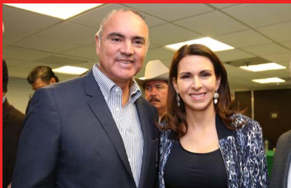
Con el secretario de SAGARPA, José Eduardo Calzada Rovirosa

Con el apoyo de la Agencia del Programa Especial de Seguridad Alimentaria (PESA), Enlace Rural Agroambiental, A. C., se han integrado proyectos agropecuarios encaminados a desarrollar cadenas productivas en la Sierra por un monto de 2.5 millones de pesos.