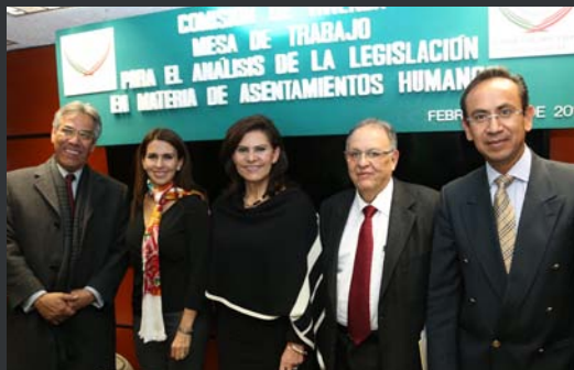
Reunión de las Comisiones de Vivienda de la Cámara de Senadores y Diputados con funcionarios de SEDATU.