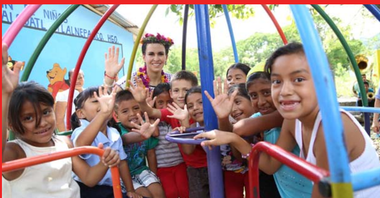
Conviniendo con niños de la comunidad de Tlalnepanco de la Escuela Topiltzin Quetzalcóatl

Papatlatla, municipio de Calnali con 800 niños. Acoyotla, municipio de Tepehuacán de Guerrero con 1000 niños. Chichiltepec, municipio de Tlanchinol con 800 niños. Los Puentes, Ixtlahuac y Tlacuapan, municipio de Huautla con 800 niños.