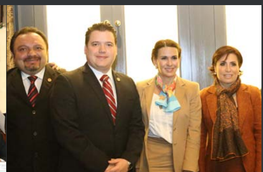
Reunión de la Junta Directiva de la Comisión de Vivienda con la Secretaria de SEDATU, Mtra. Rosario Robles.