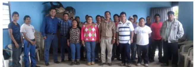
Beneficiarios del Programa de Empleo Temporal

$2.4 MDP para rehabilitar 69 kilómetros de carretera