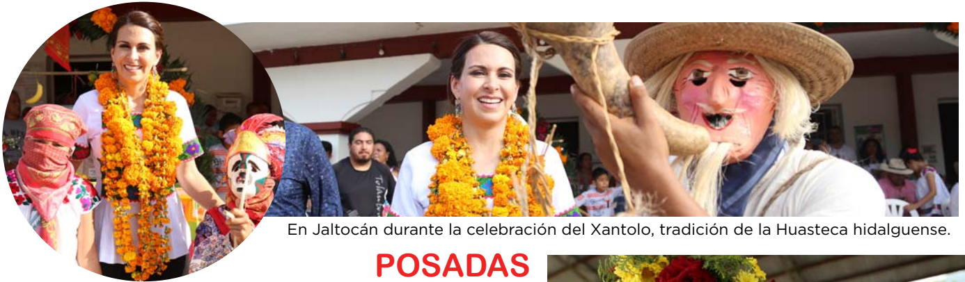
En Jaltocán durante la celebración del Xantolo, tradición de la Huasteca hidalguense.