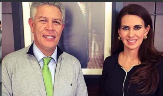
Con el Lic. David Penchyna, director del INFONAVIT.