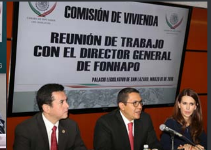
Con el Lic. Ángel Islava, director general de FONHAPO.