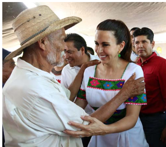
Saludando a padres de familia quienes a diario se esfuerzan por el bienestar de sus familias.

Se han apoyado 162 fiestas patronales en el distrito en el mismo número de localidades y colonias, beneficiando a 10 mil personas.