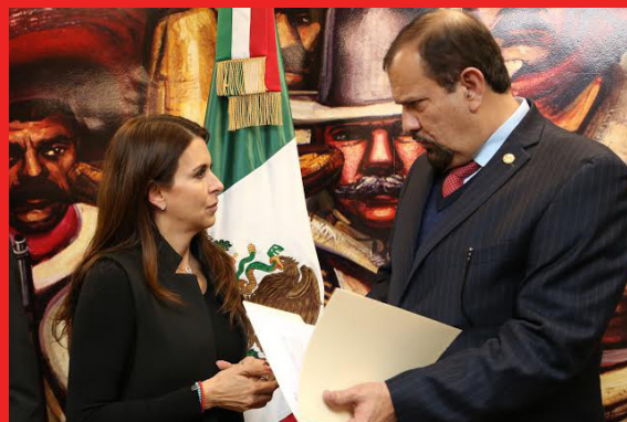
Con el senador Manuel Cota Jimenez, dirigente de la Confederación Nacional Campesina