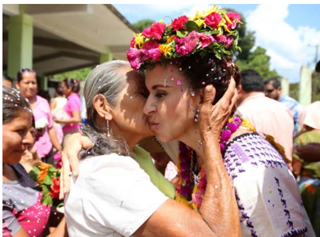
Junto a mujeres huastecas, destacadas por ser trabajadoras y grandiosas madres.