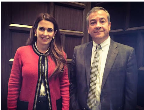
Con el subsecretario de la STPS, Ignacio Rubí.