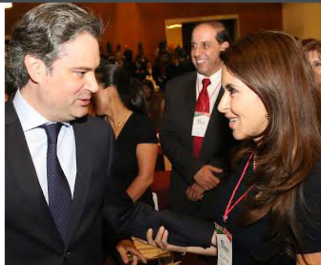
Con el secretario de Educación Pública, Mtro. Aurelio Nuño.