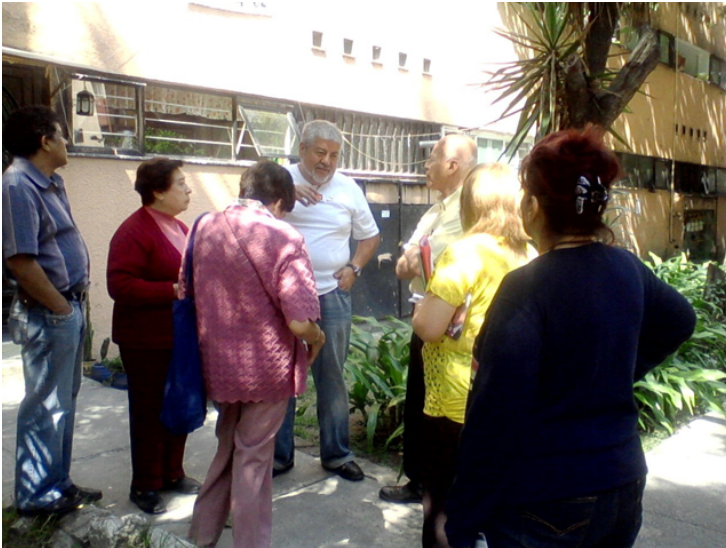
Recorrido Unidad Habitacional Lindavista Vallejo, 9 de octubre de 2012