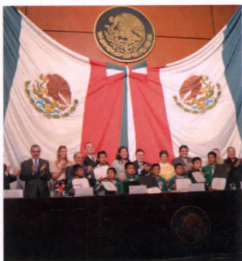
Entrega de reconocimiento a los niños Campeones descalzos de la Montaña "Triquis"

La Comisión de Deporte es una de las más activas en la LXII Legislatura, con la finalidad de tomar acuerdos relativos a las diversas tareas de la misma, durante este periodo hemos tenido un total de 14 reuniones con el Pleno de la Comisión y la Junta Directiva se ha reunido en cinco ocasiones. En lo que respecta a la actividad legislativa de la Comisión, durante este periodo han sido dictaminados los siguientes asuntos, entre iniciativas y proposiciones con punto de acuerdo: