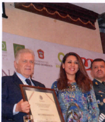
Entrega de Reconocimientos a la Comisión Nacional de Cultura Física y Deporte y al Comité Olímpico Mexicano, por la Comisión de Deporte de la LXII Legislatura.

Los apoyos consisten en 84 solicitudes de apoyos con material deportivo, para jóvenes deportistas destacados de distintos estados, 10 solicitudes de becas económicas, 18 solicitudes de beca para acudir a practicar algún deporte o a instalaciones deportivas de las distintas delegaciones del Distrito Federal