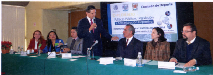
Ceremonia de clausura del Diplomado Políticas Públicas Legislación y Administración Deportiva encabezado por el Presidente de la Mesa Directiva el Dip. Silvano Aureoles Conejo.

gobiernos y organismos vinculados al deporte, se realizó un profundo análisis en torno a los factores más sustantivos para actualizar las prácticas, políticas, normas y la percepción del deporte mexicano, que genere propuestas para fortalecerlo a la altura de la capacidad competitiva, de la dinámica poblacional y del liderazgo que tiene México. Asistieron 85 personas.