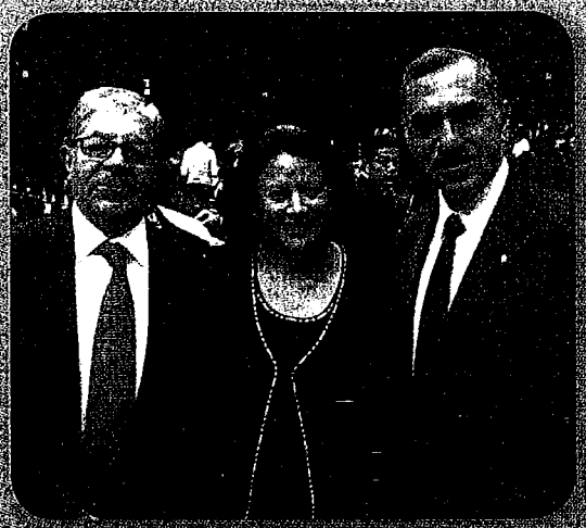
19 de abril 2013 Firma de Convenio de Colaboración con Ingenieros