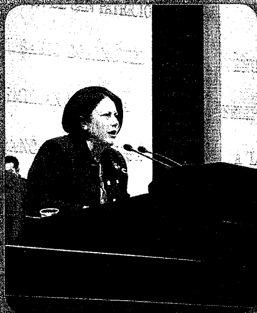
2 de abril de 2013 Conferencia de Prensa en el Ministerio de Cooperación con el Extranjero

"Necesitamos una educación inclusiva con maestros capacitados, que no discrimine y que ofrezca servicios educativos adaptados que garanticen su permanencia en los sistemas de educación. Los niños con autismo tienen el mismo derecho a la educación que los demás".