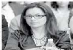
La legisladora vendrá a "reforzar la operatividad de las campañas", según se informó.

La delegada se integra a los trabajos de campaña el próximo domingo, cuando estas den inicio en las cabeceras distritales, precisó Martínez Arellano.