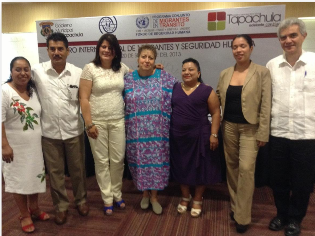
Cónsules de Países Centro y Sur Americanos

Tener un Marco Jurídico que permita a las Naciones participantes, tratar a los migrantes con las mismas oportunidades en cada uno de los países en que se encuentren esos probables connacionales y que se encuentran en situación de migrante, con la finalidad de proteger sus derechos humanos, su desarrollo social y el acceso a la justicia.