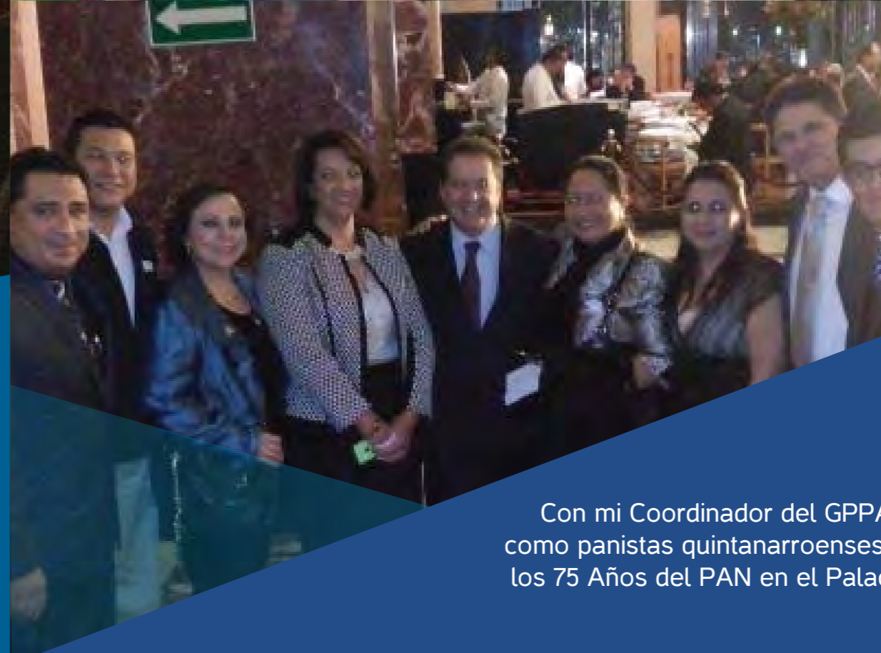
Con mi Coordinador del GPPAN y su esposa, así como panistas quintanarroenses, en los festejos de los 75 Años del PAN en el Palacio de Bellas Artes.