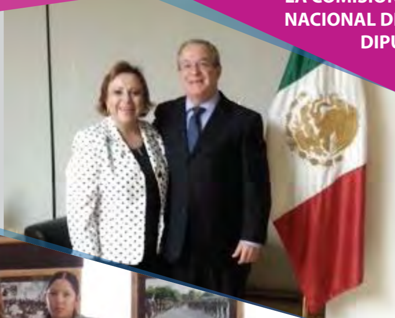
Con el Lic. Monte Alejandro Rubido, Comisionado Nacional de Seguridad Pública.