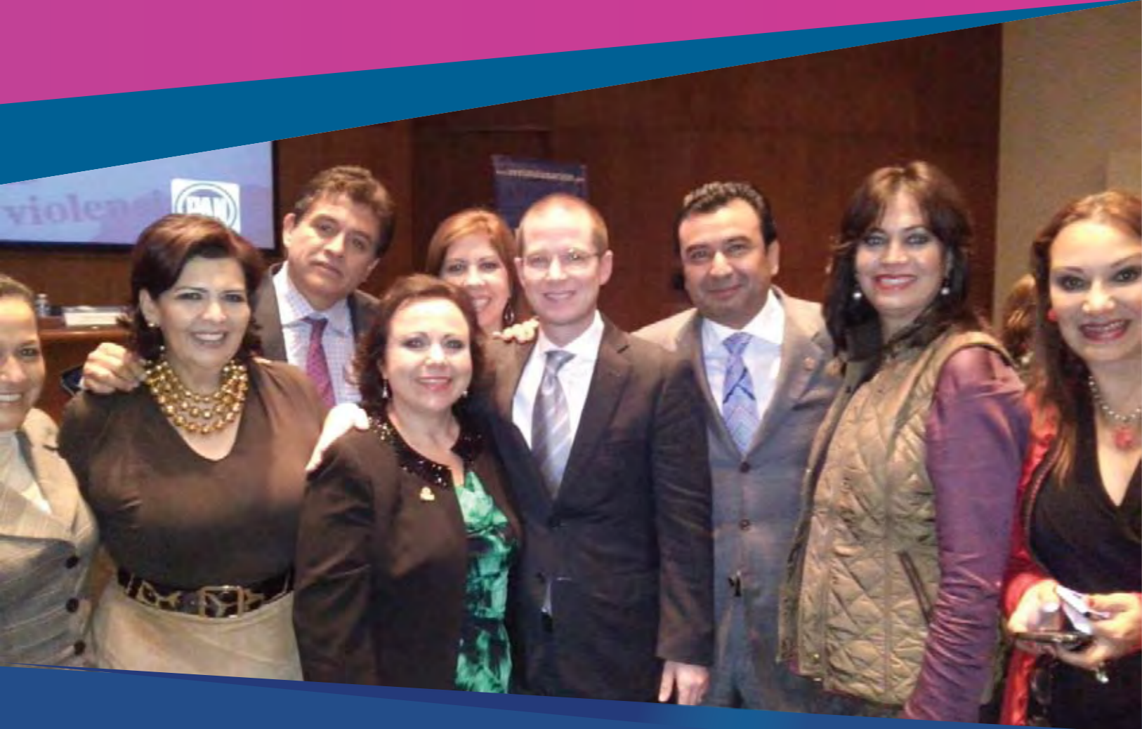
Presente en el 73 Aniversario de la Revista La Nación y el lanzamiento de su versión digital, como órgano informativo oficial del PAN.