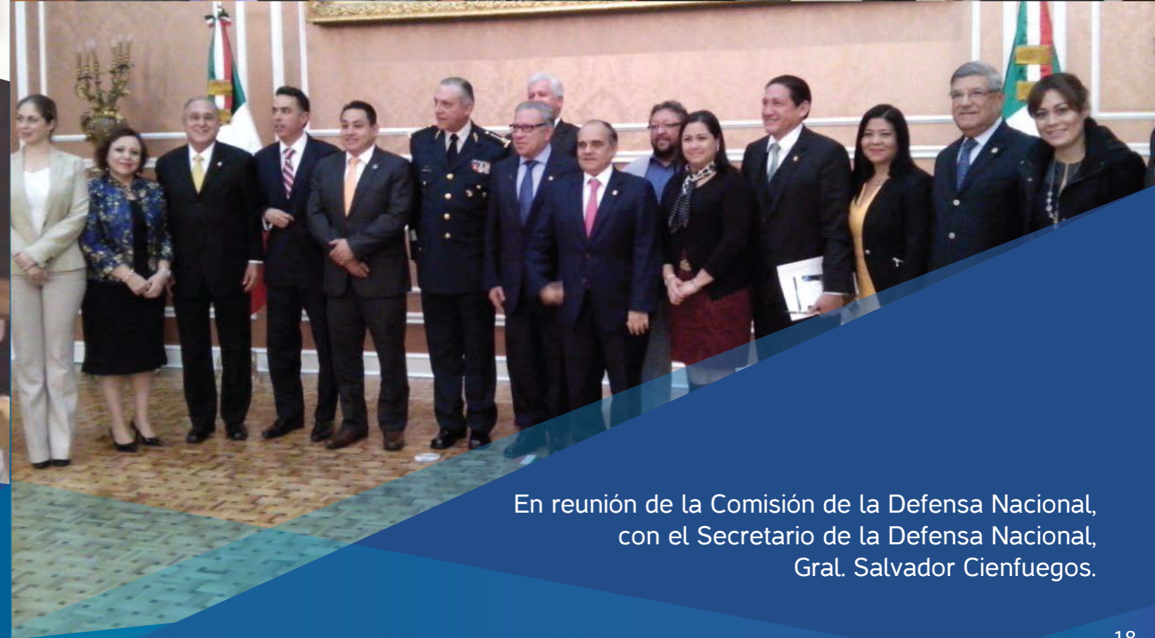
En reunión de la Comisión de la Defensa Nacional, con el Secretario de la Defensa Nacional, Gral. Salvador Cienfuegos.