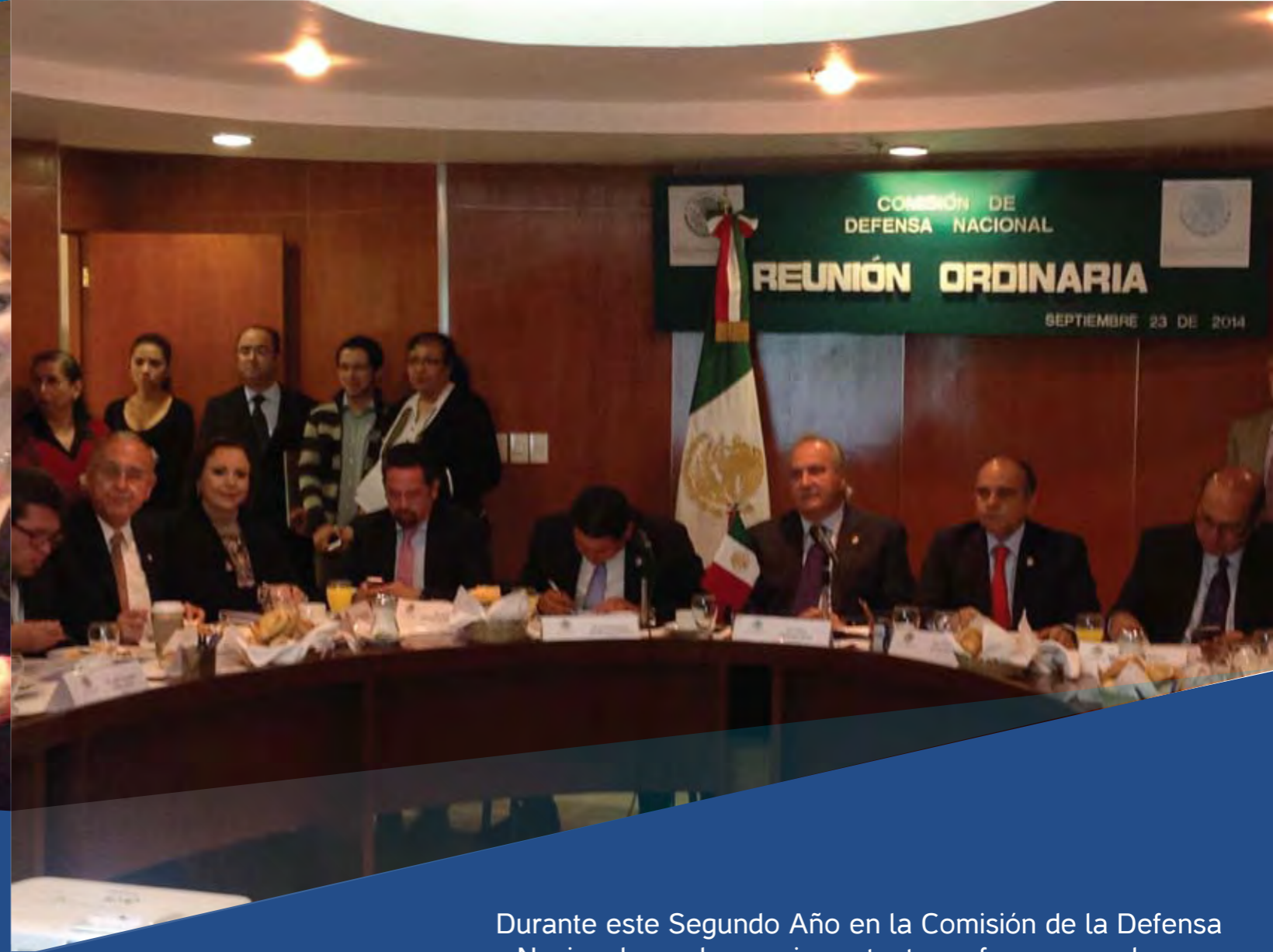
Durante este Segundo Año en la Comisión de la Defensa Nacional, aprobamos importantes reformas que buscan fortalecer las labores del Ejército y la Armada de México.