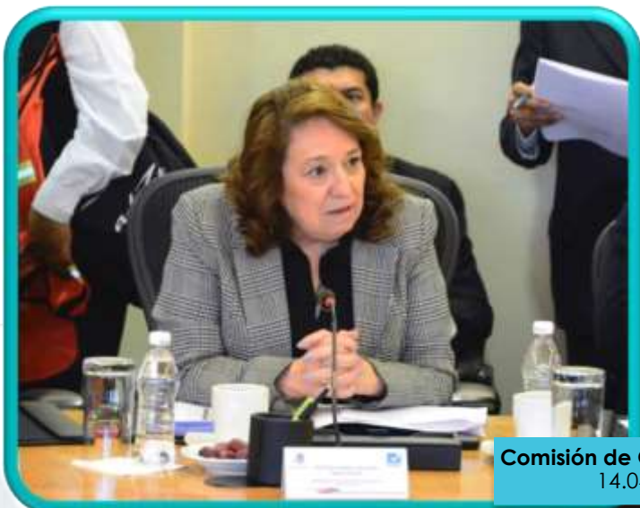
Comisión de Gobernación 14.04.15

Ratificamos nuestra disposición de diálogo y acuerdos para la gobernabilidad de la Cámara de Diputados, siempre bajo el principio del respeto a las minorías parlamentarias y el derecho a fijar la propia postura y expresar libremente la opinión.