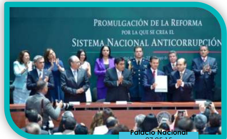
Palacio Nacional 27.05.15