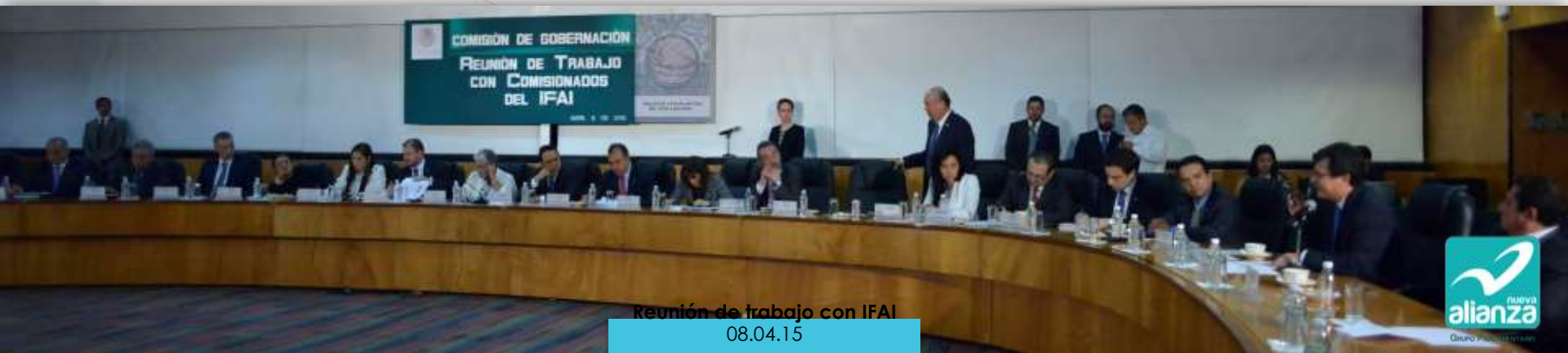
Reunión de trabajo con IFAI 08.04.15

Nuestra postura fue de absoluto respaldo a todas las acciones legislativas que impliquen incrementar los niveles de transparencia en la gestión gubernamental y el ejercicio de los recursos públicos.