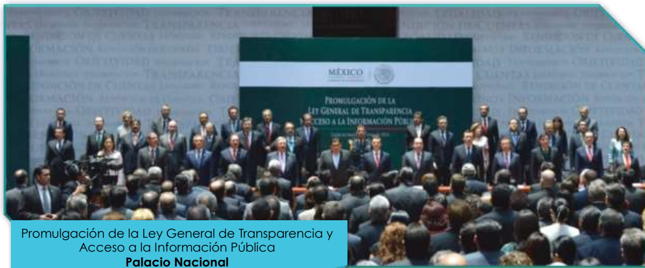
Promulgación de la Ley General de Transparencia y Acceso a la Información Pública Palacio Nacional 18.03.15