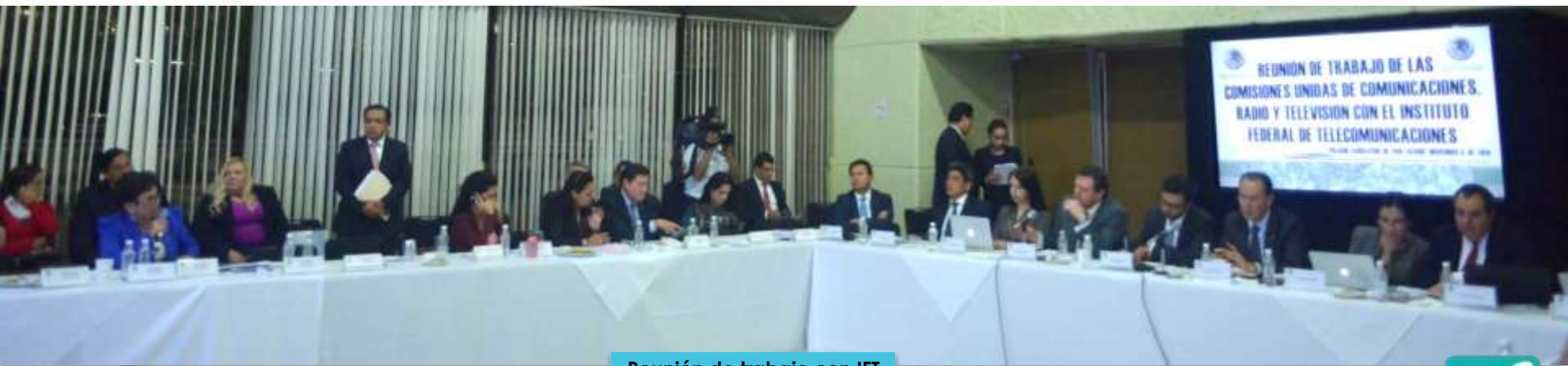
Reunión de trabajo con IFT 04.11.14

Se revisaron avances en aplicación de la reforma, con especial atención en el tema de la portabilidad numérica que por esos días estaba por vencer el plazo para su instrumentación por parte del IFT.