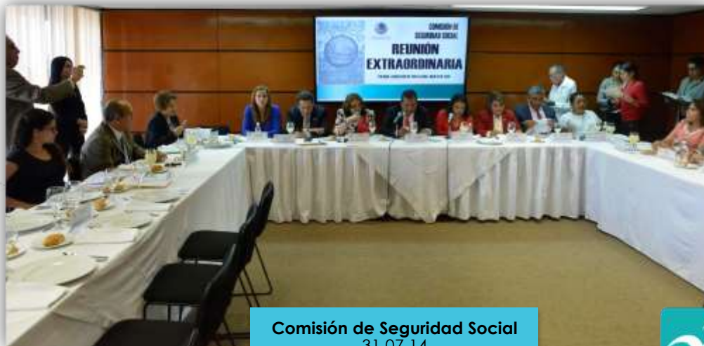
Comisión de Seguridad Social 31.07.14