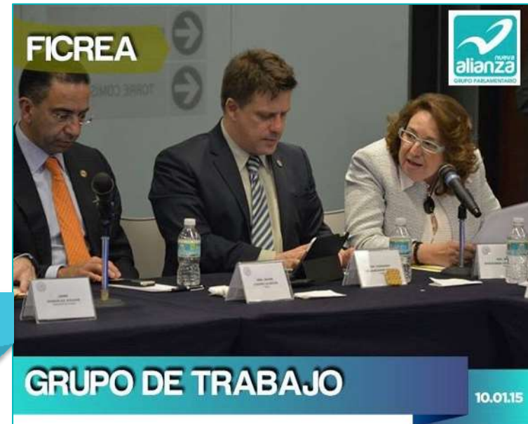
GRUPO DE TRABAJO