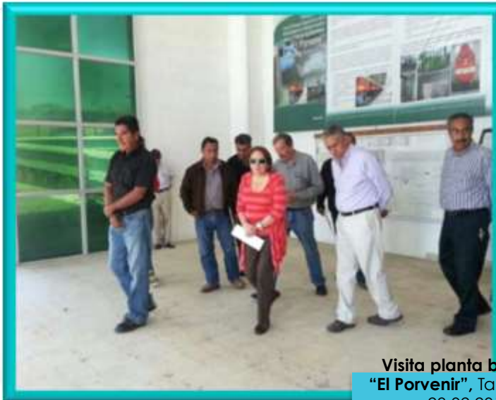
Visita planta bombeo "El Porvenir", Tamuín, SLP 28.02.2014

Reiteramos que debe revisarse la problemática de otros estados, de manera especial, el proyecto Monterrey VI y su viabilidad.