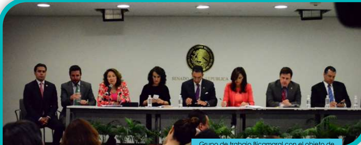
Grupo de trabajo Bicameral con el objeto de modificar la ley de ahorro y crédito popular para atender el caso FICREA

Ley de Ahorro y Crédito Popular: solución al caso FICREA. Ante el fraude cometido en FICREA, la Comisión procesó un paquete de reformas legales que incluía la expedición de la Ley de Ahorro y Crédito Popular; el objeto es fortalecer la regulación y la prevención de fraudes en el sector financiero popular.