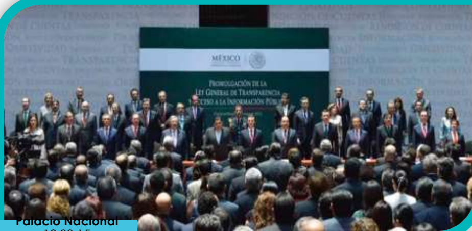
Palacio Nacional 18.03.15

La aprobación de la Reforma Constitucional que crea el Sistema Nacional Anticorrupción y de la Ley General de Transparencia y Acceso a la Información Pública , eran las reformas pendientes que finalmente se aprobaron en febrero y abril de 2015, respectivamente.