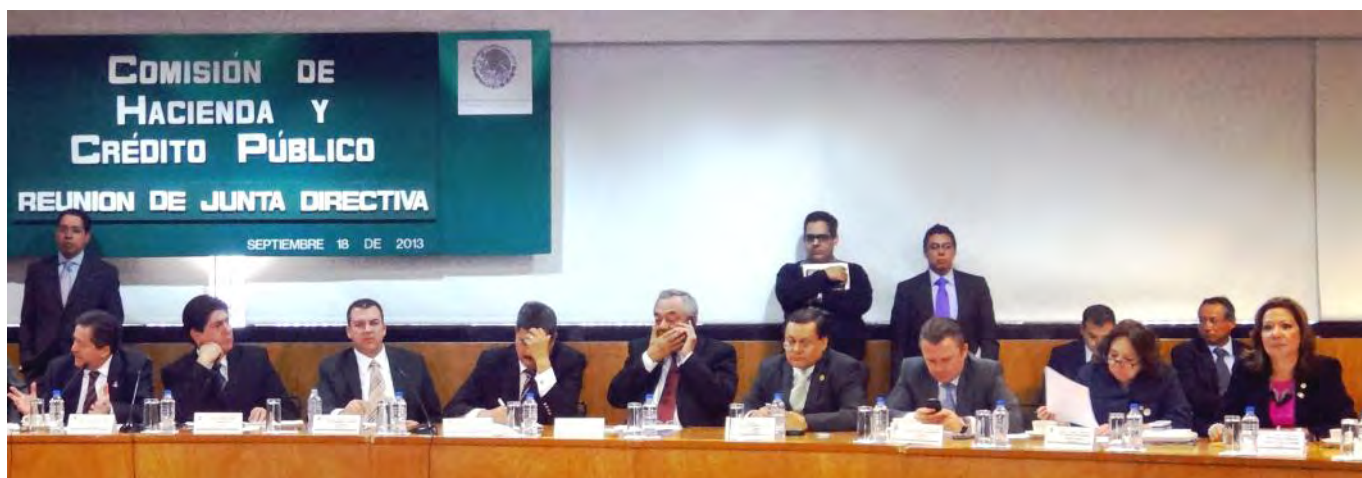
Diputados integrantes de la Junta Directiva de la Comisión de Hacienda y Crédito Público.

También se realizaron 4 audiencias públicas para abordar el tema de las iniciativas de la Reforma Hacendaria, en los que participaron académicos, colegios de profesionistas, productores y organizaciones de todo el país.