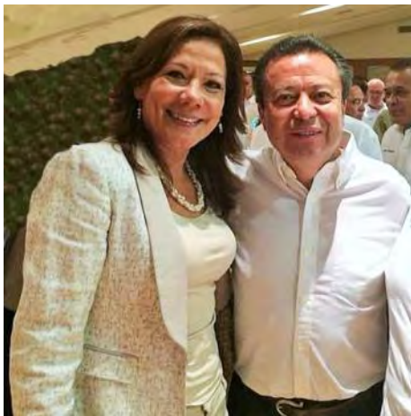
Dr. César Camacho, Presidente Nacional del PRI