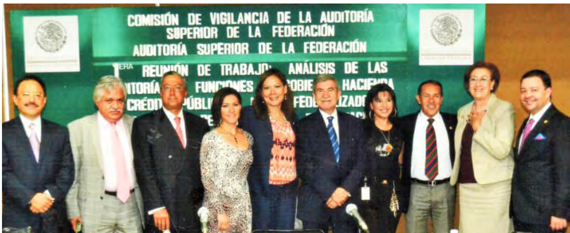
C.P. Juan Manuel Portal Titular de la ASF, presentando los informes de la cuenta pública a los integrantes de la Comisión de Vigilancia de la Auditoría Superior.

En materia de cobertura, la fiscalización se llevó a cabo en 127 dependencias y entidades, correspondientes a los tres Poderes de la Unión, a 4 organismos constitucionalmente autónomos, a 19 universidades públicas, a los 32 gobiernos de las entidades federativas; además se auditaron los fondos federales en 190 gobiernos municipales, y en 7 demarcaciones territoriales del Distrito Federal.