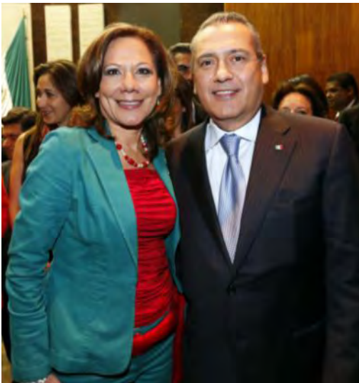
Diputado Manlio F. Beltrones, Coordinador del Grupo Parlamentario del PRI en la Cámara de Diputados