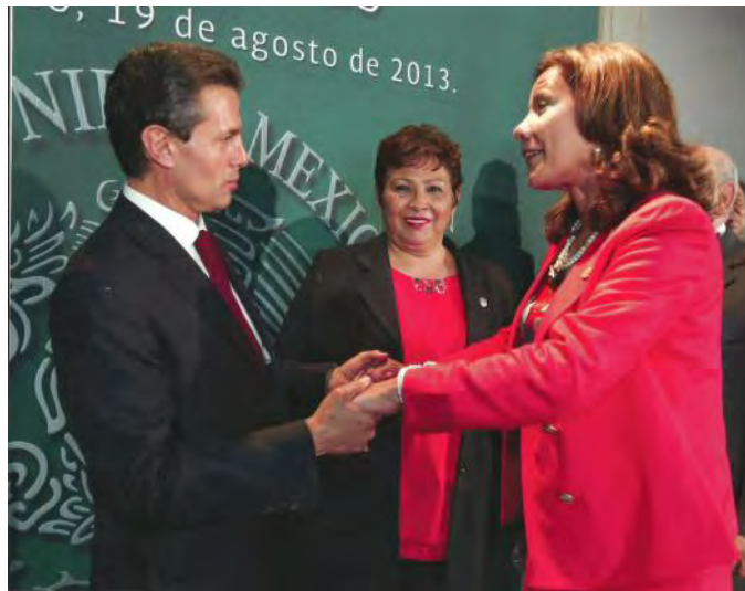
Lic. Enrique Peña Nieto, Presidente de la República.