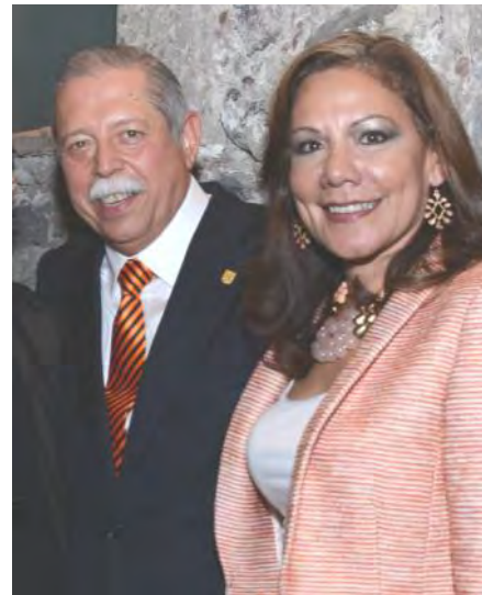
Ing. Egidio Torre Cantú, Gobernador Constitucional de Tamaulipas