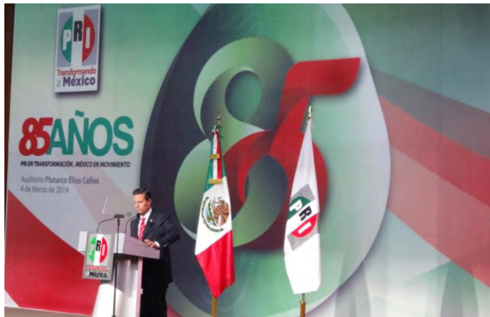
85° aniversario del PRI, presidido por el Lic. Enrique Peña Nieto.