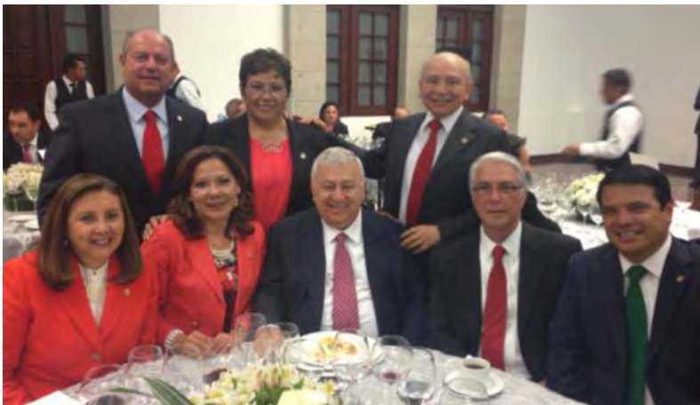
Diputados y Senadores con el Lic. Emilio Chuayffet.