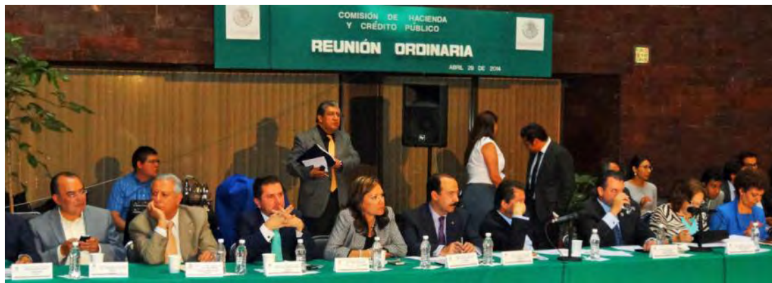
Diputados integrantes de la Comisión.

Participé en la Comparecencia del Dr. Agustín Carstens Carstens, Gobernador del Banco de México y del Lic. Jaime González Aguadé, Presidente de la Comisión Nacional Bancaria y de Valores, en la cual habló sobre las disposiciones de carácter general aplicables a las Redes de Medios de Disposición.