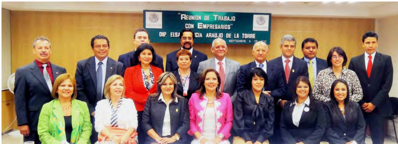
Reunión de trabajo con empresarios de diferentes estados del país en la Cámara de Diputados.