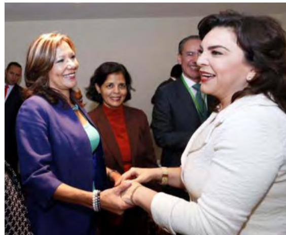
Ivonne Ortega, Secretaria del PRI Nacional.