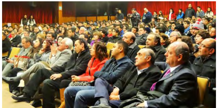
Funcionarios de la Universidad y de diversas instituciones, docentes y alumnos universitarios.