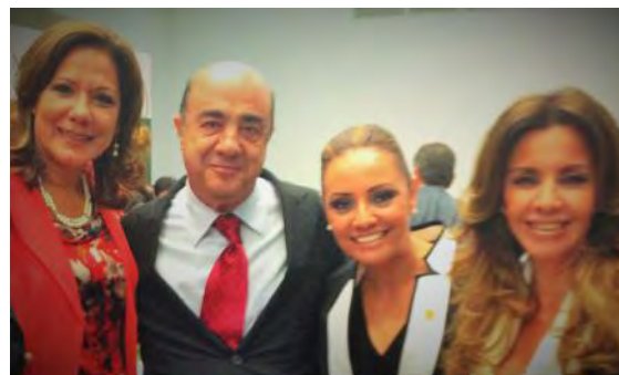
Procurador General de la República, Jesús Murillo Karam con Diputadas.