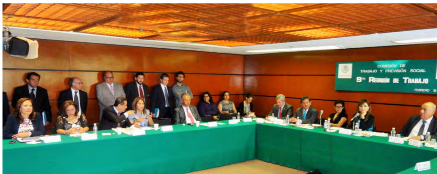
Diputados integrantes de la Comisión.