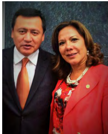
Secretario de Gobernación Miguel Osorio Chong.

Los Diputados y Senadores asistimos a la Residencia de los Pinos a un convivio con el Presidente Enrique Peña Nieto en el cual tuvimos la oportunidad de platicar sobre las reformas transformadoras, así como también dialogamos con los Secretarios de Gobernación, de Educación y el Procurador General de la República con quienes nos comprometimos a trabajar juntos por México.