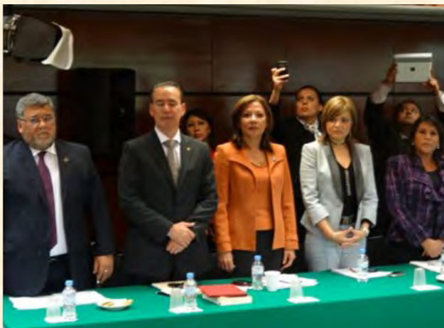
Comisión de Trabajo y Previsión Social