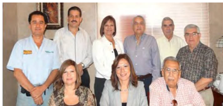
Ex Presidentes de Canaco Servytur Victoria.