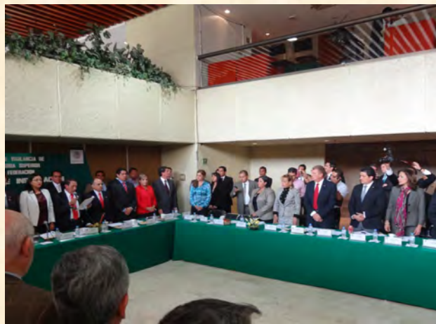
Comisión de Vigilancia de la Auditoría Superior de la Federación