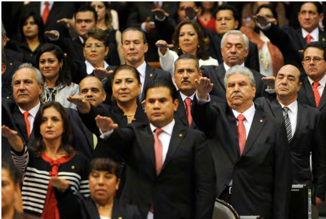
Dip. Elsa Patricia Araujo en toma de protesta junto a los diputados Rosalba de la Cruz, Marco Antonio Bernal, Carlos Aceves y del Olmo, Manlio Fabio Beltrones, Jesús Murillo Karam, Lourdes Quiñones, Héctor Gutiérrez de la Garza, Manuel Añorve, Francisco Arroyo Viera.

El 29 de agosto de 2012 se realizó la Toma de Protesta de los miembros de la LXII Legislatura de la Cámara de Diputados, la cual tuvo lugar en el Palacio Legislativo de San Lázaro en la Ciudad de México, en ella participamos los 500 diputados electos.