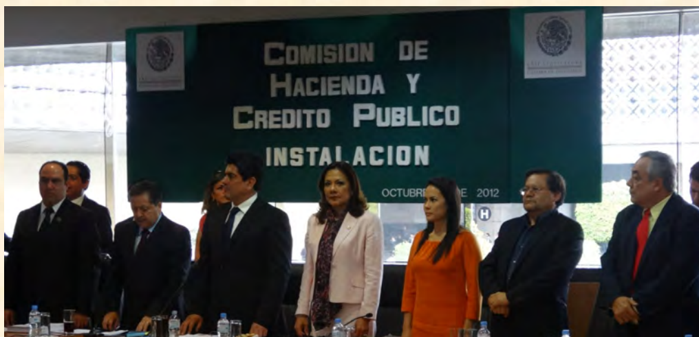
Comisión de Hacienda y Crédito Público