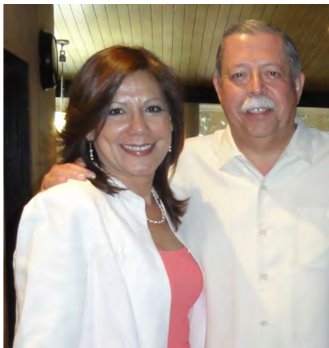
Ing. Egidio Torre Cantú, Gobernador Constitucional de Tamaulipas.