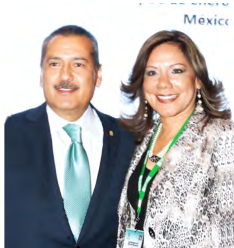
Diputado Manlio Fabio Beltrones, Coordinador del Grupo Parlamentario del PRI en la Cámara de Diputados