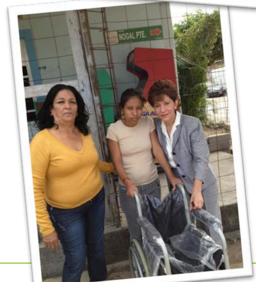
Visita y entrega de apoyos a los adultos mayores de la Col. Caminera