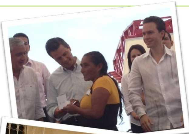
Presentación del Programa de la Frontera Sur en Catazajá