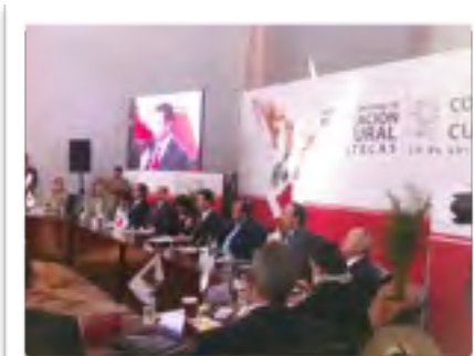
Encuentro Nacional de Planeación Cultural CONAGO