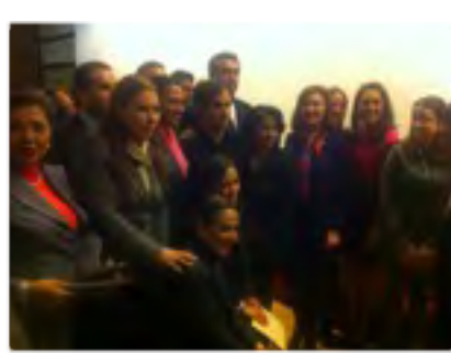
Reunión con representantes y realizadores del cine en México