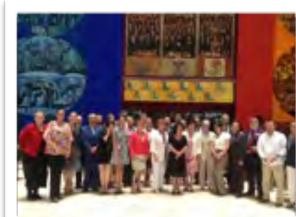
Reunión con integrantes del Subsector Cultural