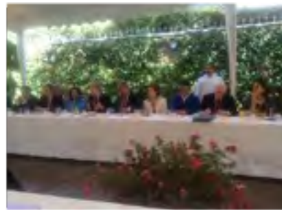
Reunión con el Lic. Rafael Tovar y de Teresa, Presidente del Consejo Nacional para la Cultura y las Artes