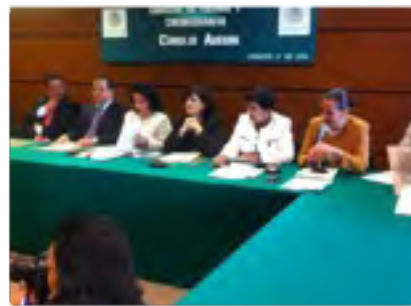
Reunión con el Consejo Asesor de la Comisión