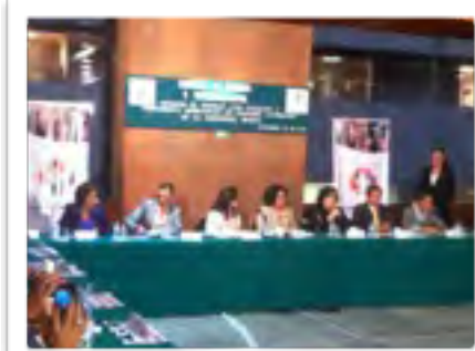
Reunión con los Presidentes Municipales de las Ciudades Patrimonio del País