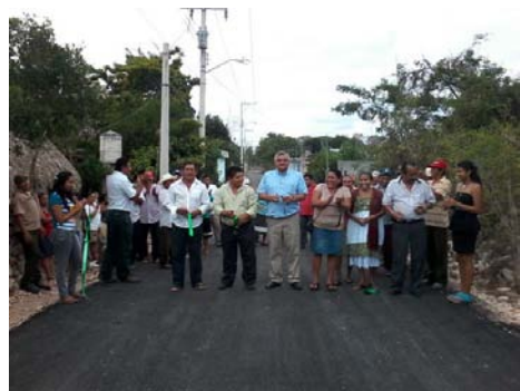
Inaugurando 1,100 Mts. de carretera en Cantamayec