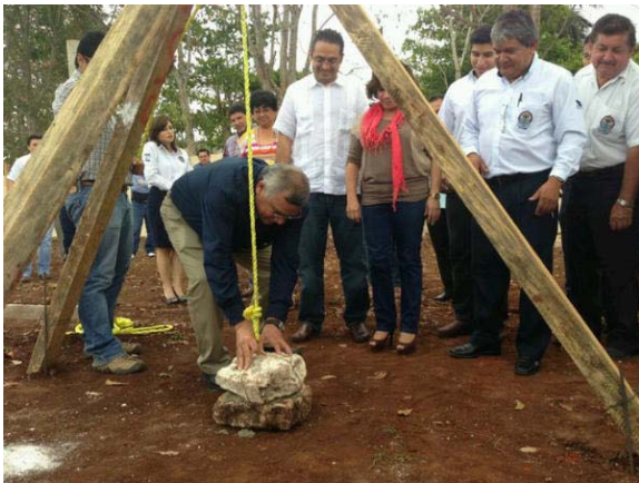
1a Piedra de la 2a Etapa de Edificios Académicos del Instituto Tecnológico de Tizimín