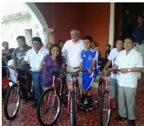
Hicimos entrega de 4 bicicletas a jóvenes estudiantes de Ichmul, Comisaría de Chikindzonot con el apoyo del gobernador Rolando Zapata