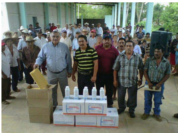
Entregando equipos de sonido digital y apoyos para ejidatarios de Tzucacab