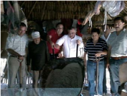
Entregando pisos de cemento en el municipio de Chichimilá