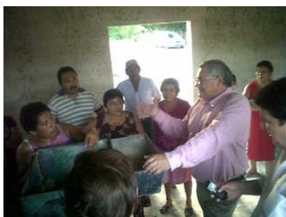
Inauguración del molino de nixtamal en Xpanha Toro, comisaría de Tizimín