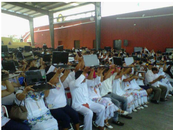
Acompañando en Yaxkukul al Gobernador Rolando Zapata en la Presentación del Programa Bienestar Digital