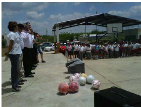
Entregando apoyos en la Primaria José María Iturrual de Traconis

De manera específica, he realizado esfuerzos por gestionar recursos federales para la ampliación, remodelación o construcción de espacios deportivos adecuados para nuestros deportistas, así mismo he podido entregar 500 paquetes de material deportivo, así como balones de futbol, basquetbol, voleibol, pelotas, bates y guantes de beisbol, redes y trofeos, entre otros.