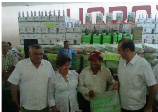
Apoyos del programa “peso a peso” para los productores de la UGROY