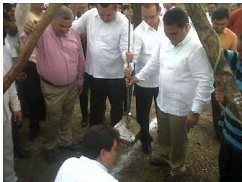
En la Primera Piedra del Campo de béisbol de la Hacienda Oxman en Valladolid