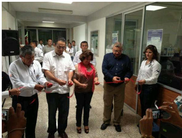
Inauguración del Nuevo Equipamiento de los Laboratorios del Tecnológico de Tizimín