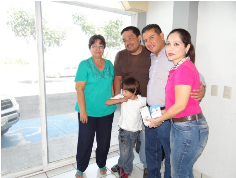
Entrega de medicamentos a familias de escasos recursos

También entregue alrededor de 80 apoyos para la adquisición de aparatos auditivos, además de medicamento y el pago de consultas a más de 75 familias.