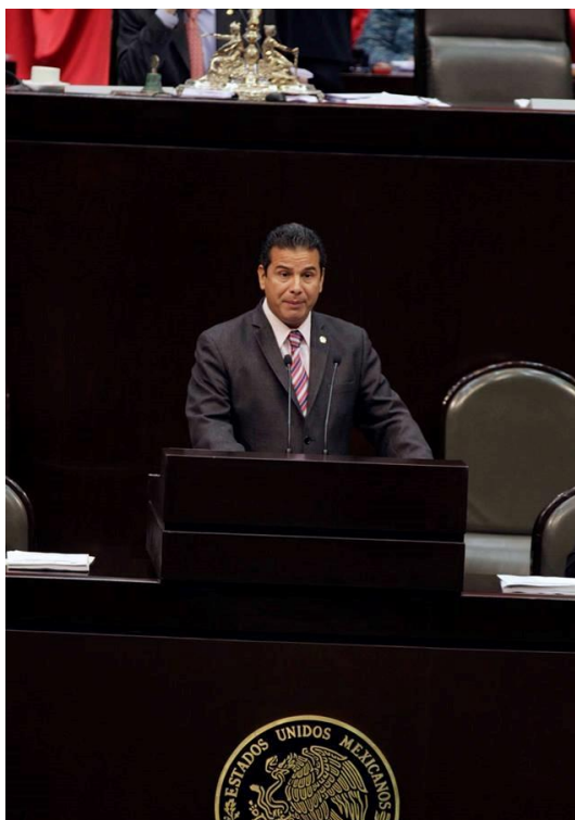
Presentando el posicionamiento del grupo parlamentario PRI