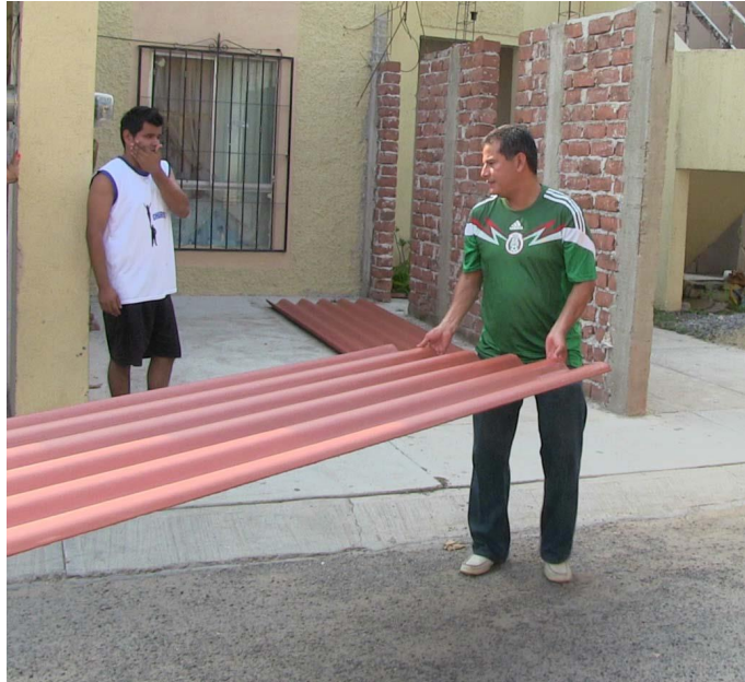
Entrega de laminas a bajo costo.

Consciente de la necesidad de mejorar las condiciones de vida de cientos de familias de escasos recursos, realice la entrega de láminas de asbesto, cemento e impermeabilizante a más de 4 mil 400 familias.