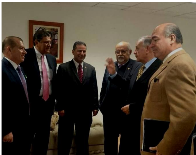
Diputados federales por Colima, analizando el presupuesto de egresos para 2015.

En los municipios correspondientes al distrito federal electoral número dos que represento, se aprobo un presupuesto de egresos superior a los dos mil millones de pesos que comprende los municipios: