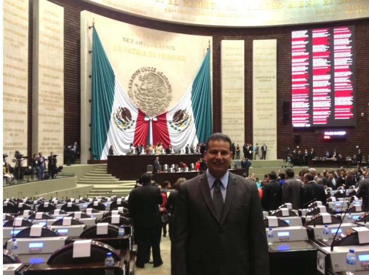
Dip. Francisco Alberto Zepeda González en la Cámara de Diputados.

El 1° de septiembre de este año, Francisco “Pico” Zepeda, su servidor cumplí dos años de haber asumí el compromiso que el pueblo me encomendó al designarme diputado por el segundo distrito federal electoral por los municipios de Manzanillo, Tecomán, Armería y Minatitlán del Estado de Colima; mis principales objetivos siguen siendo llevar la voz de los colimenses al máximo foro de los mexicanos para cumplir con las expectativas de los habitantes del distrito que represento.