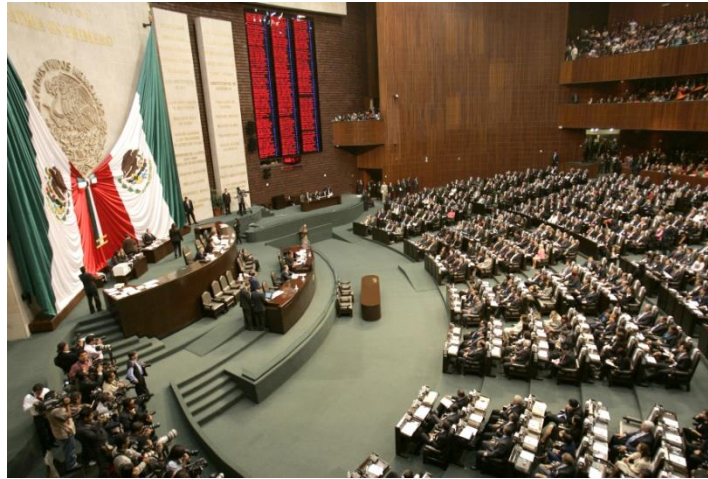
Cámara de Diputados con excelentes resultados.

Presente en tribuna el dictamen para modificar la ley y establecer responsabilidades de los concesionarios de los servicios auxiliares terrestres (grúas) en beneficio de los usuarios.