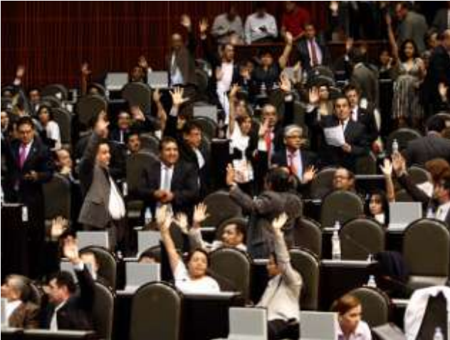
Diputados de la LXII emitiendo su voto.

En el pleno de la Cámara de Diputados buscando beneficios para los mexicanos.