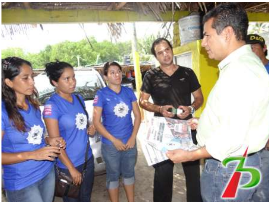
Dialogando con el equipo de futbol femenino Aduaneras de Manzanillo