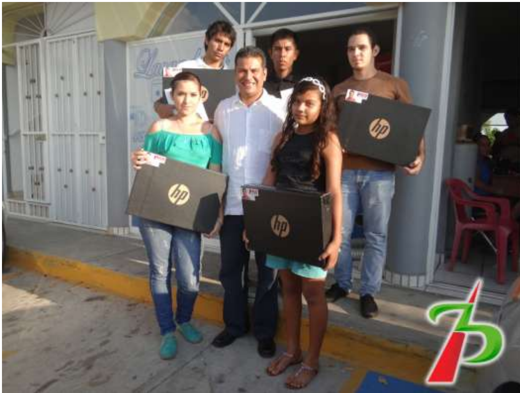
Realizando la entrega de computadoras para jóvenes de nivel Medio Superior