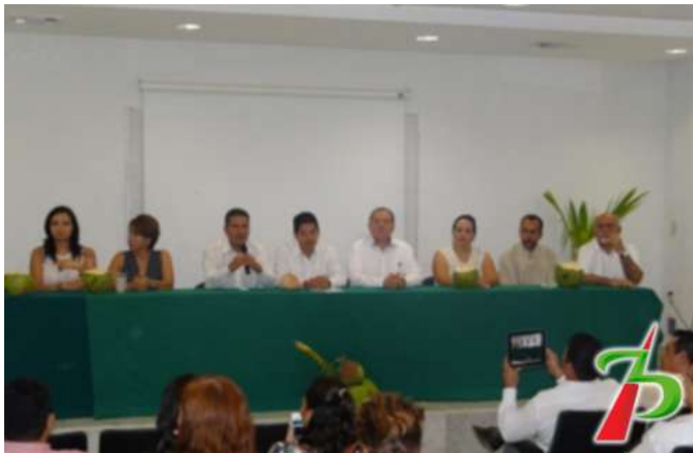
Rueda de prensa de la Comisión Especial de Impulso a la Agroindustria de la Palma de coco y sus derivados en el Municipio de Manzanillo, Colima.