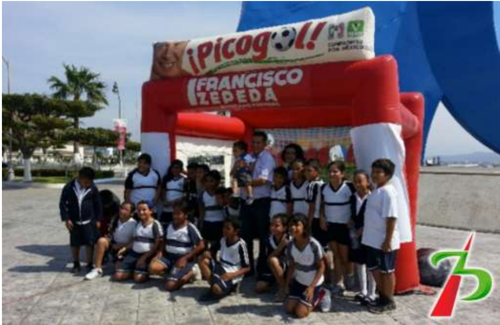
Promoviendo el deporte en las plazas públicas del Distrito que representa