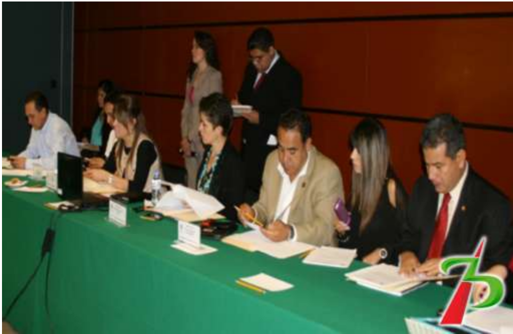
Participando en Reunión de Trabajo en la Comisión de Juventud.