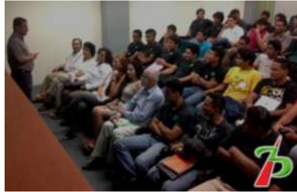
Universidad Tecnológica de Manzanillo

Dialogamos con representantes del Organismo Nacional de Mujeres Priistas (OMNPRI) Juvenil, en el PRI Nacional, en la ciudad de México.