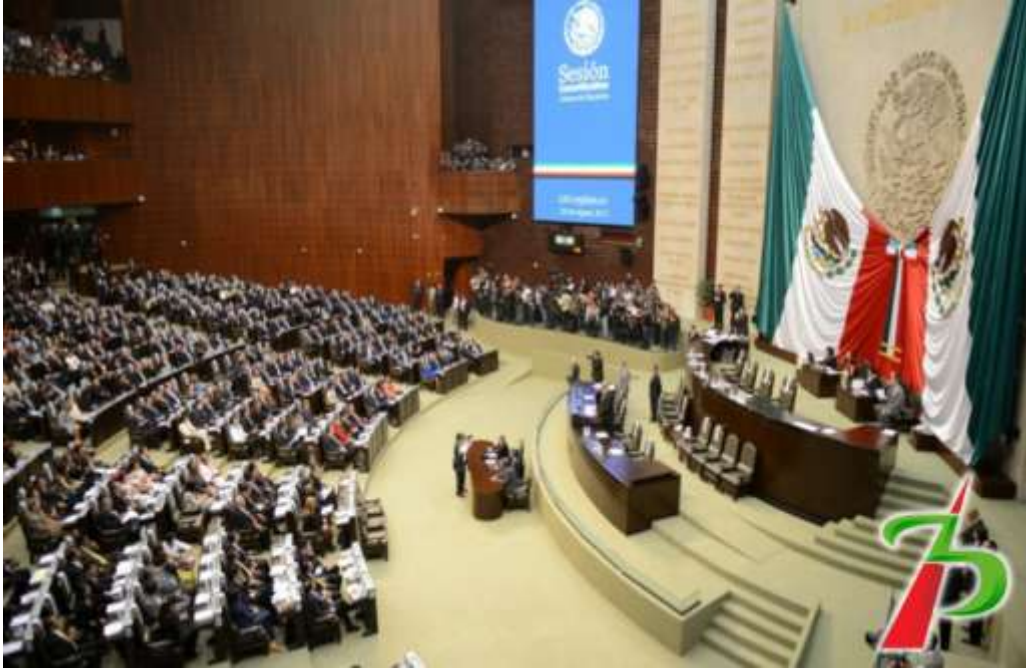
Sesión de Instalación de la LXII Legislatura.