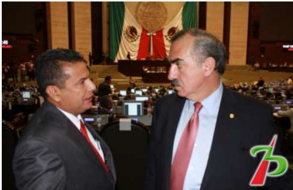
Dialogando con el presidente de la Comisión de Deporte, Felipe "el tibio" Muñoz, Medallista olímpico de México 1968.