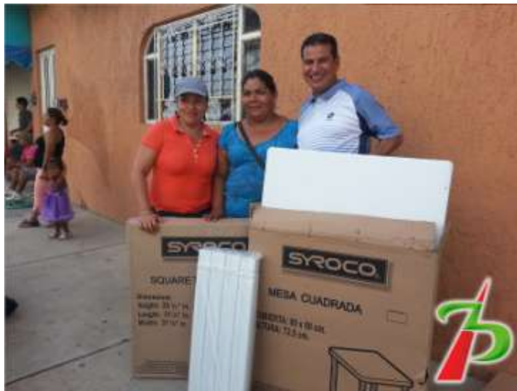
Impulsando la creación de micro negocios

Cumpliendo con la entrega de medios para la impartición de cursos para amas de casa