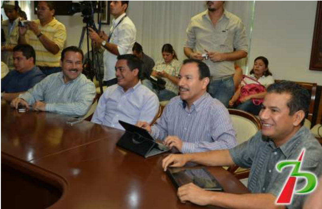
En reunión para coordinar trabajos con presidentes municipales del Estado de Colima