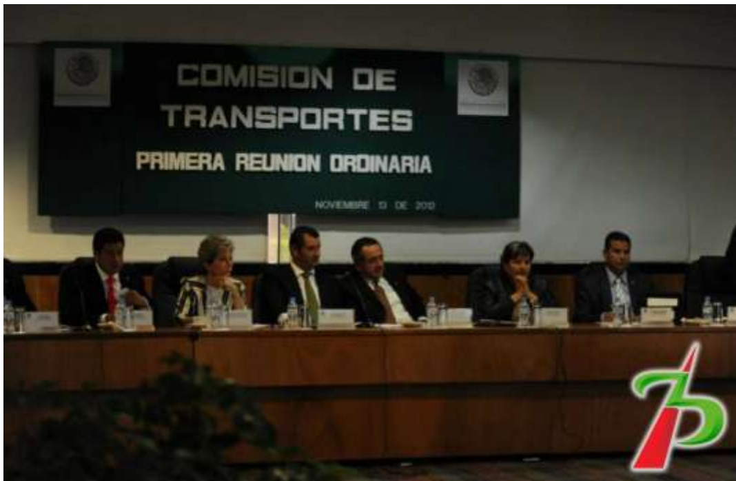
Participando en la primer Reunión ordinaria de la Comisión de Transportes.