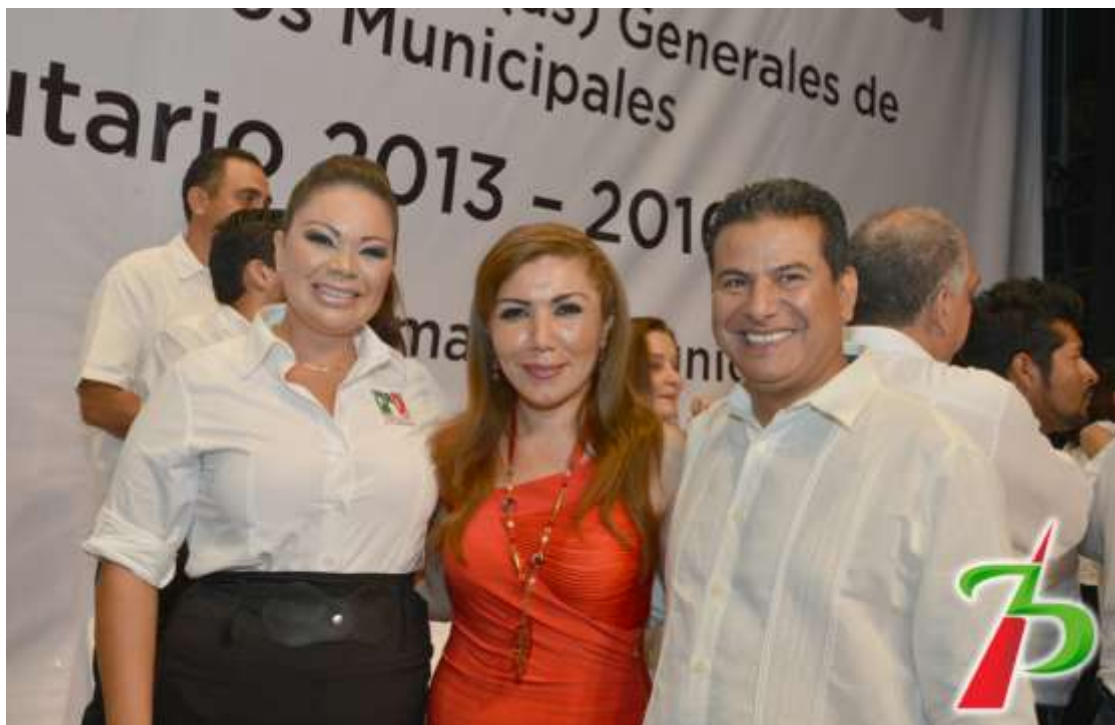
Trabajos en conjunto con la Senadora Itzel Ríos y con su suplente Dunia de la Vega