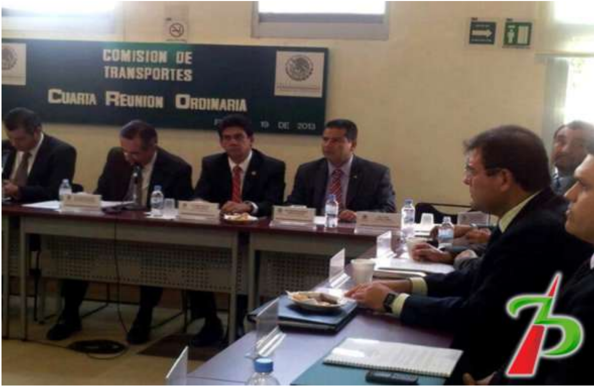
Participando en la cuarta Reunión Ordinaria de la Comisión de Transportes.