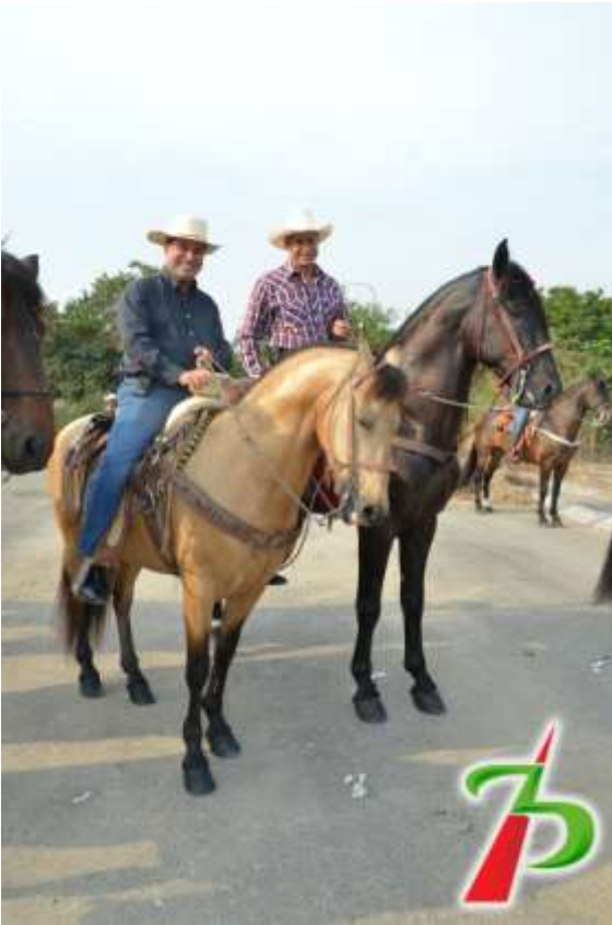
Acompañando al Gobernador del Estado Mario Anguiano Moreno en las Festividades del Distrito Federal Electoral II