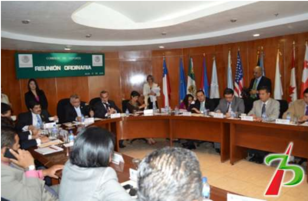
Reunión Ordinaria de la Comisión de Deporte.