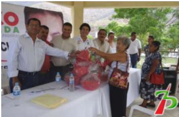
Apoyo de regalos a presidentes de colonias del Distrito Federal Electoral II