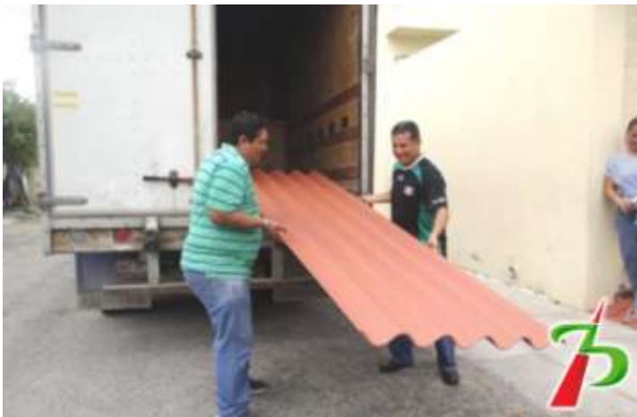
Realizando la entrega de laminas a bajo costo