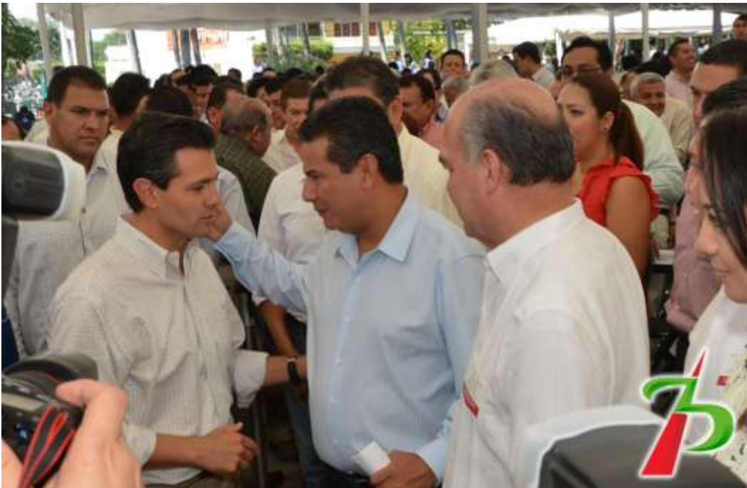
Dialogando con el presidente de la República Enrique Peña Nieto sobre los proyectos de beneficio para Colima