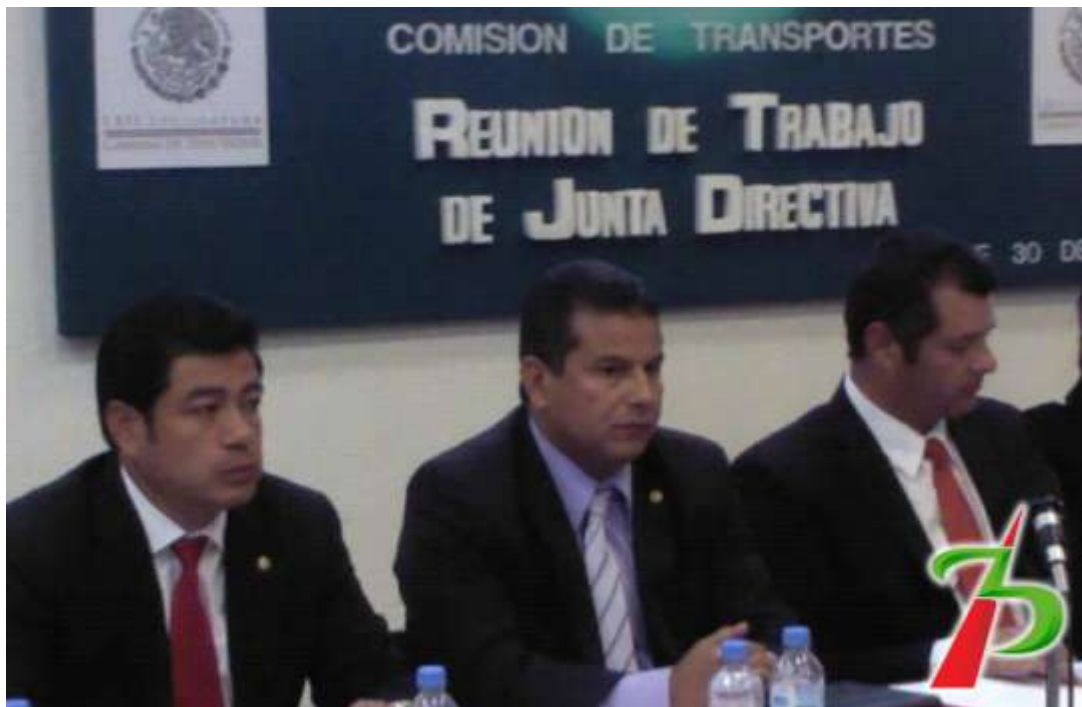
En Reunión de trabajo de la Comisión de Transportes en la que forma parte como secretario.