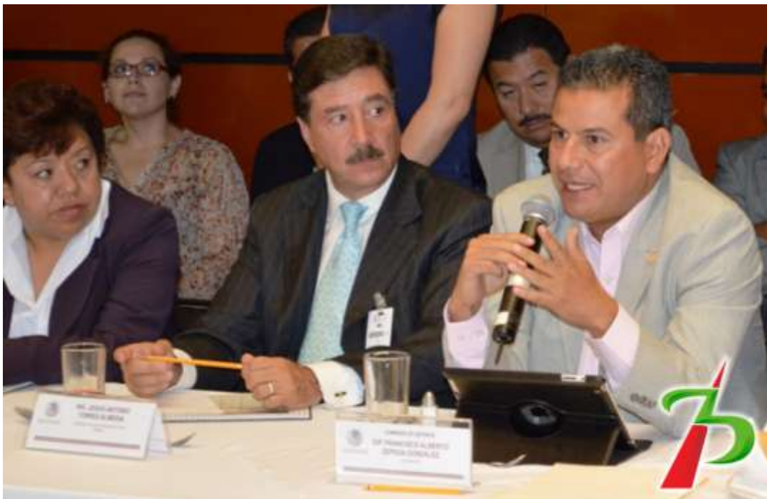
Participando en Reunión de Trabajo de la Comisión de Deporte.