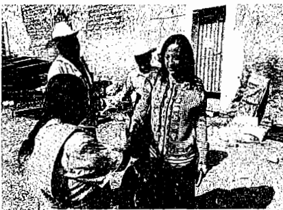
PO POBLANO Y ESTUFAS AHORRADORAS