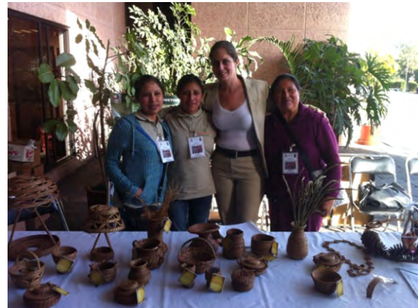
Tlachichuca, Puebla. Feria Artesanal.