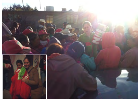
Recorrido en Puerto Nacional y Xochiloma.