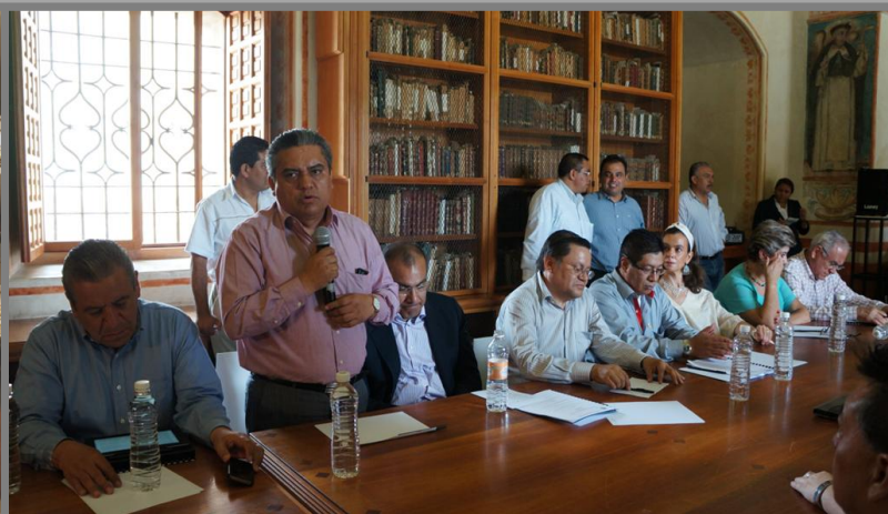
Reunión de la Comisión de Ciudades Patrimonio Ex Convento de Santo Domingo de Guzmán