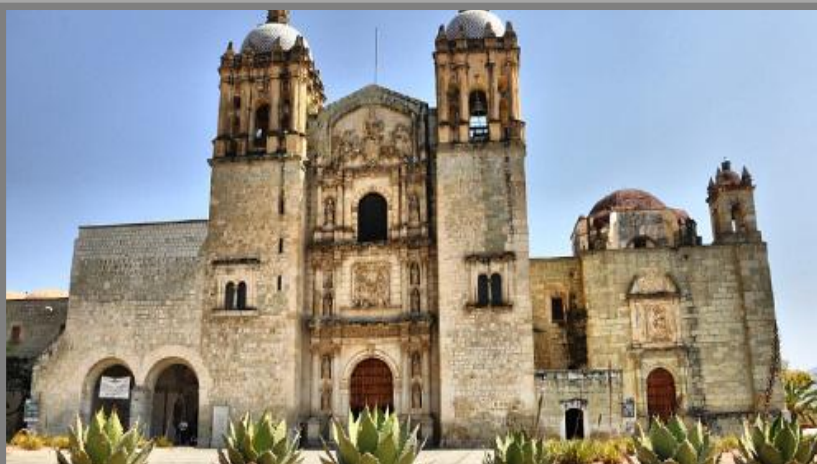
Santo Domingo de Guzmán

Del total del presupuesto a la ciudad de Oaxaca de Juárez le correspondieron 27 millones 426 mil 549 pesos.