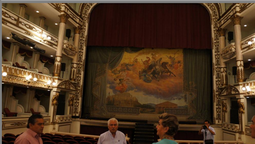
Teatro Macedonio Alcalá