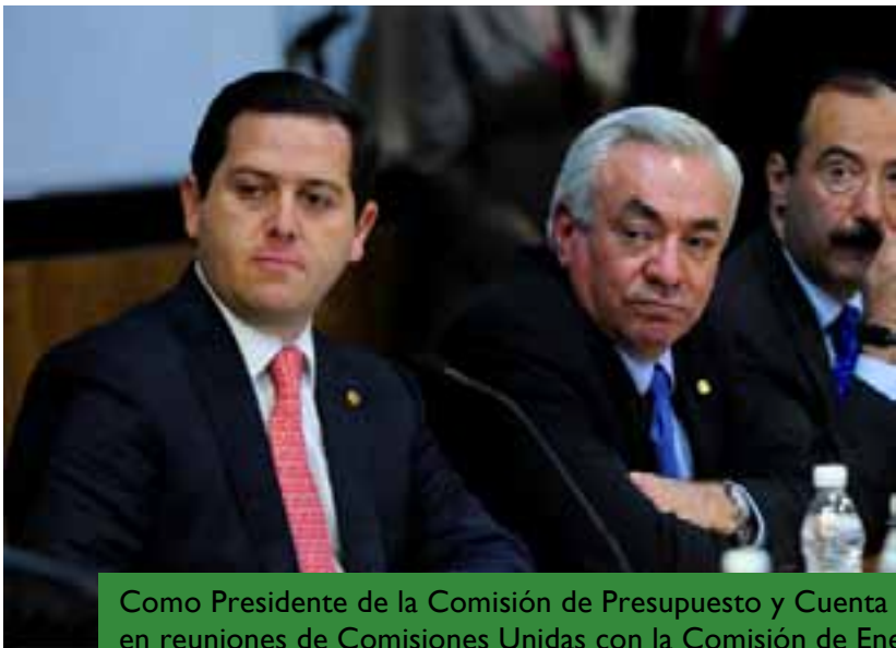
Como Presidente de la Comisión de Presupuesto y Cuenta Pública en reuniones de Comisiones Unidas con la Comisión de Energía: leyes secundarias de la Reforma Energética .

Uno de los objetivos que me he planteado como Presidente de la Comisión de Presupuesto y Cuenta Pública es el de dialogar para transformar a México. Escuchar a los distintos sectores de la economía, organizaciones de la sociedad civil, autoridades locales, expertos en política de desarrollo social y todos aquellos que contribuyan a la mejor asignación presupuestal y, por supuesto, a su evaluación porque de ello depende que se diseñen políticas públicas que sirvan. Asignar el presupuesto a proyectos que fortalezcan las capacidades de los ciudadanos será fundamental para elevar la productividad del país y contar con mejores trabajos mejor pagados, y este es mi mayor compromiso.