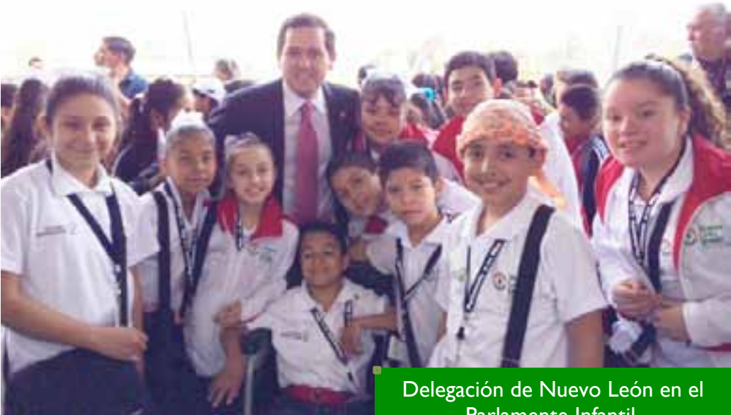
Delegación de Nuevo León en el Parlamento Infantil.