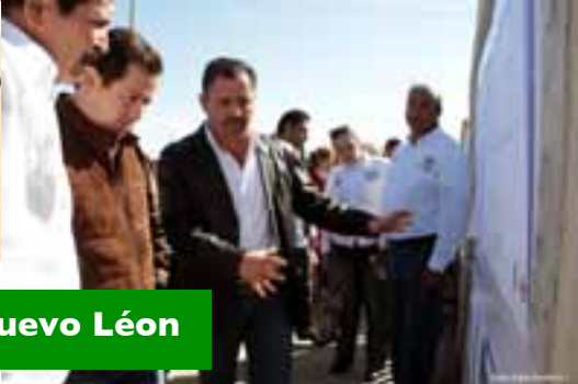
Giras por el Distrito 12, Nuevo León