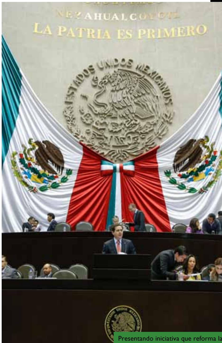
Presentando iniciativa que reforma la Ley de Bibliotecas.