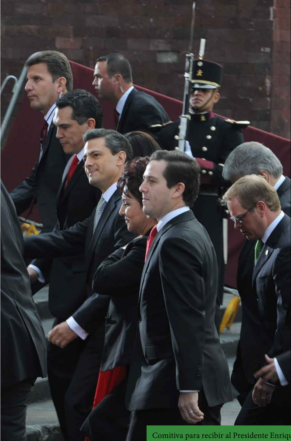
Comitiva para recibir al Presidente Enrique Peña Nieto en su toma de protesta.