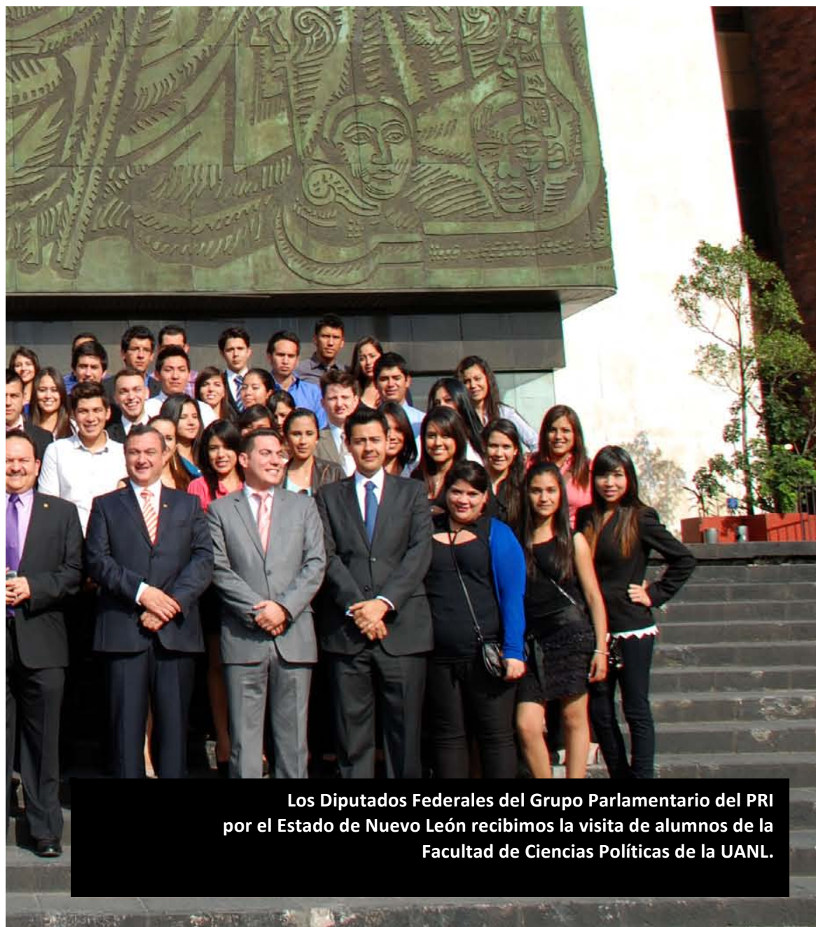
Los Diputados Federales del Grupo Parlamentario del PRI por el Estado de Nuevo León recibimos la visita de alumnos de la Facultad de Ciencias Políticas de la UANL.