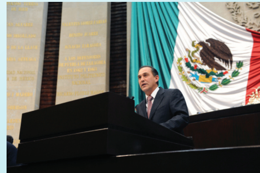
Ciudadanos que movemos a México.

Por lo anterior, el presente Informe pretende contribuir al fortalecimiento del poder de decisión y elección de nuestra ciudadanía.