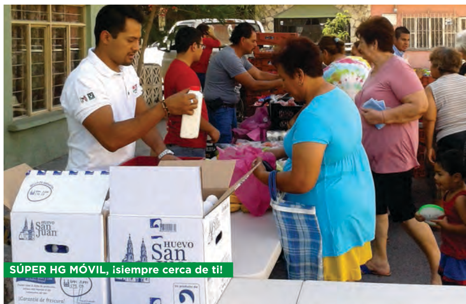
SÚPER HG MÓVIL, ¡siempre cerca de ti!