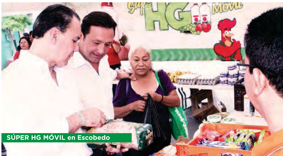
SÚPER HG MÓVIL en Escobedo

Ante la aceptación que tuvo mi programa de apoyo a la economía familiar, el Súper HG, decidí poner en marcha una modalidad móvil con la que he visitado numerosas colonias de los municipios de Apodaca, García y Escobedo.