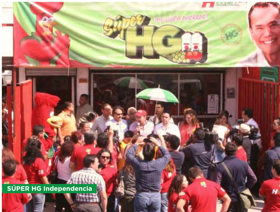
SÚPER HG Independencia

Los Súper HG ofrecen productos de la canasta básica a bajos precios y al mismo tiempo impulsan el autoempleo. Ahora tenemos cuatro sucursales de Súper HG en las colonias Valle de Santa Lucía, La Alianza, Pablo A. González (Ferrocarrilera), e Independencia.