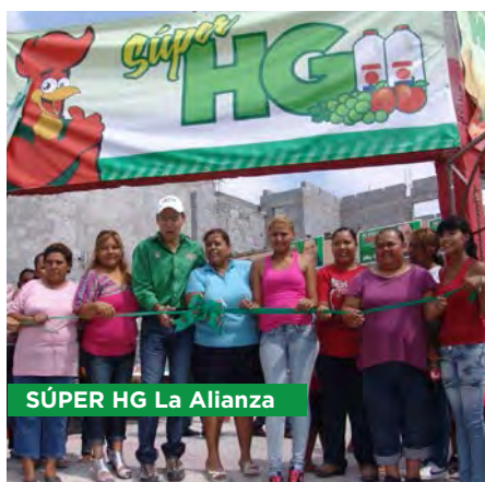
SÚPER HG La Alianza