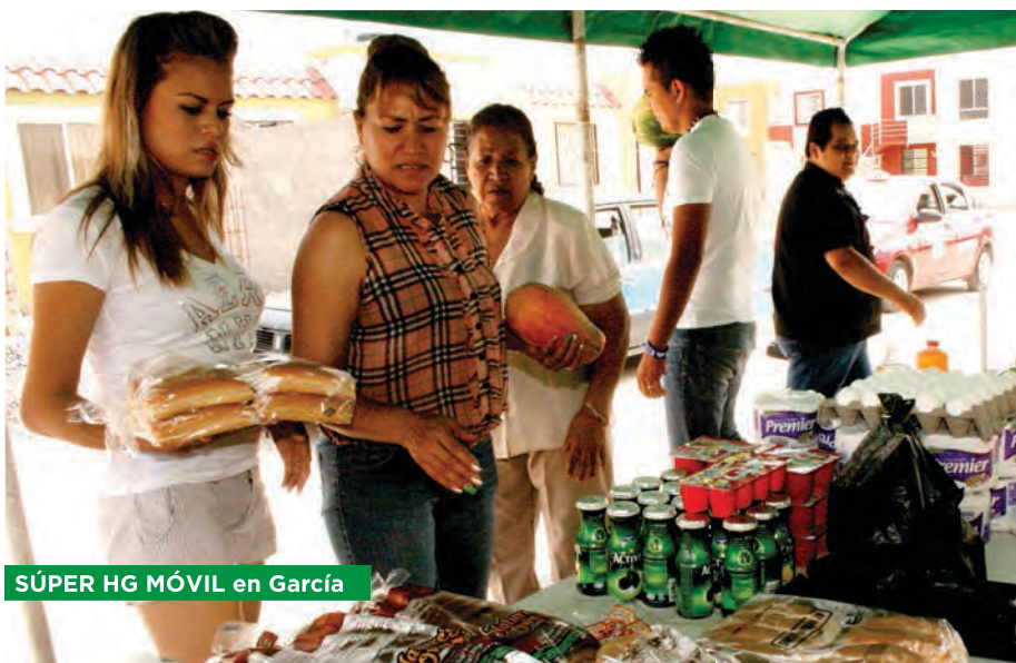
SÚPER HG MÓVIL en García