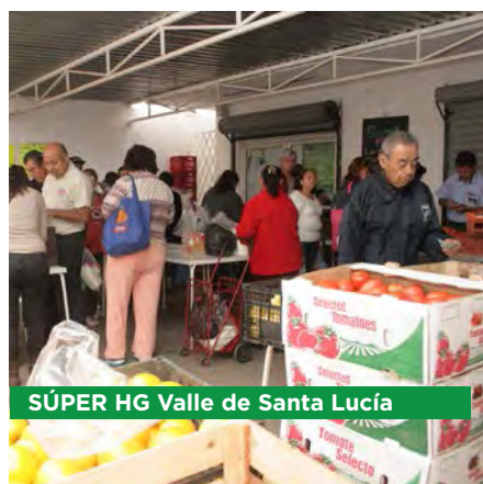
SÚPER HG Valle de Santa Lucía