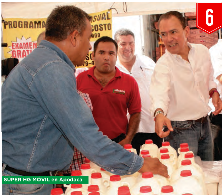
SÚPER HG MÓVIL en Apodaca