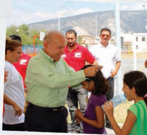
Apoyando a nuestra niñez