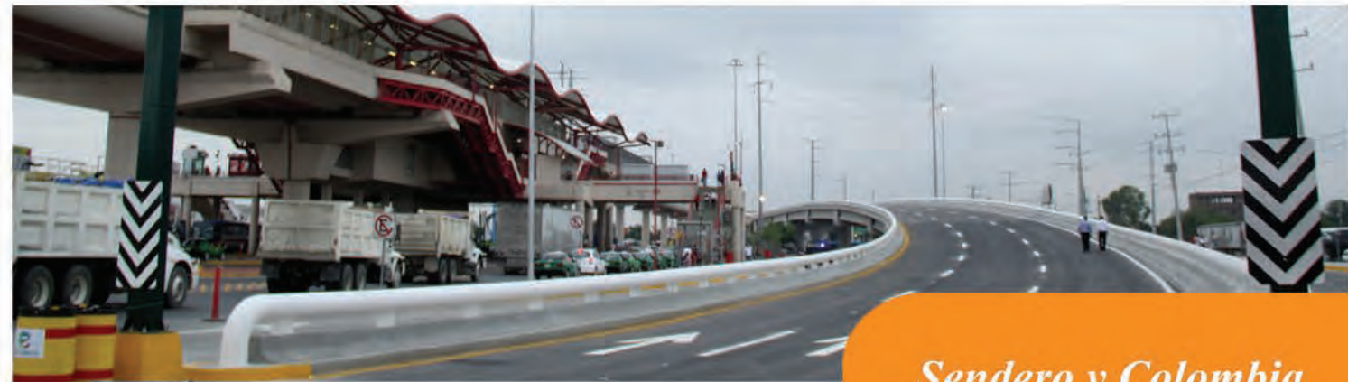
Sendero y Colombia