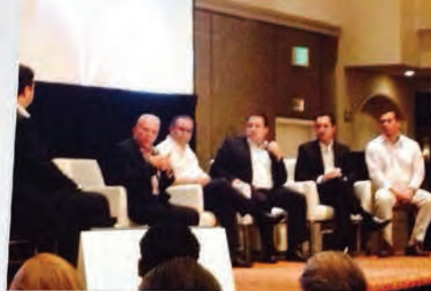
Compartiendo mi trabajo como legislador