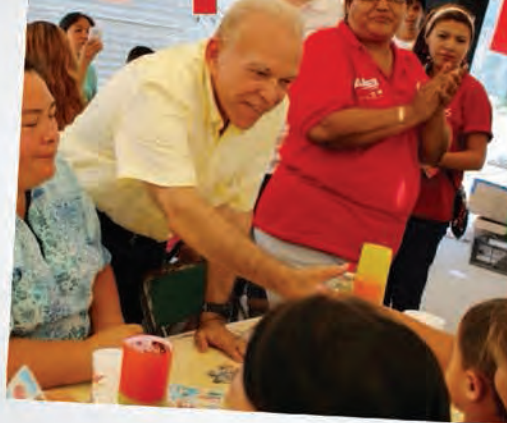
Conviviendo con nuestra gente