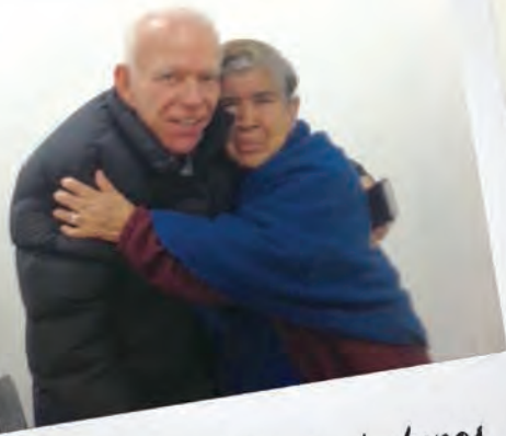
Cercanía con los ciudadanos

Una labor que también he realizado como diputado federal en esta LXII Legislatura ha sido la de Gestión Social donde desarrollé espacios para la interacción y junto con la comunidad hemos logrado impulsar proyectos para atender las necesidades sociales de la población.