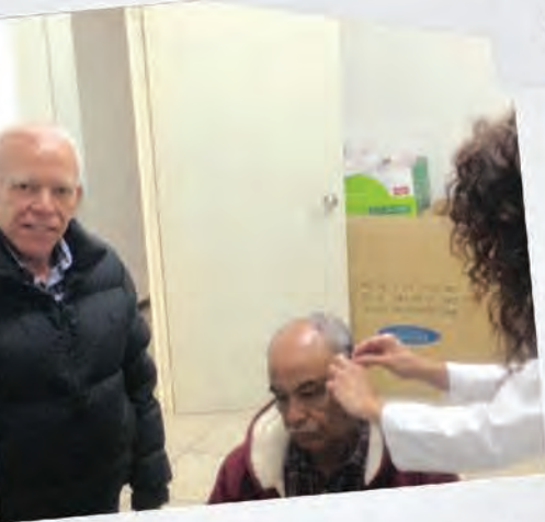
Llevando servicios a la comunidad