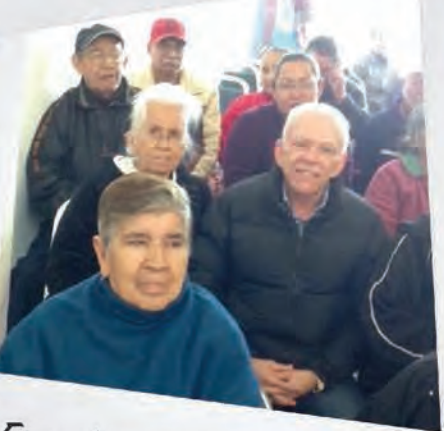
Escuchando sus necesidades