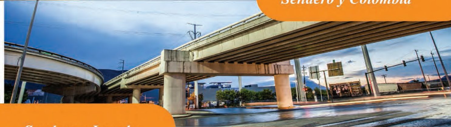
Sendero y Laredo