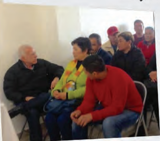
Compartiendo puntos de vista