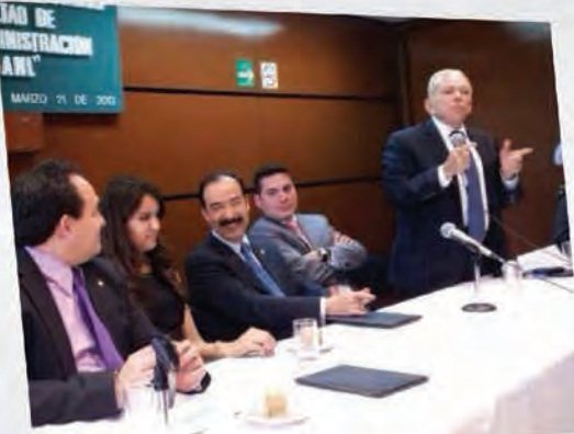
Acercando el Congreso a nuestros futuros profesionistas