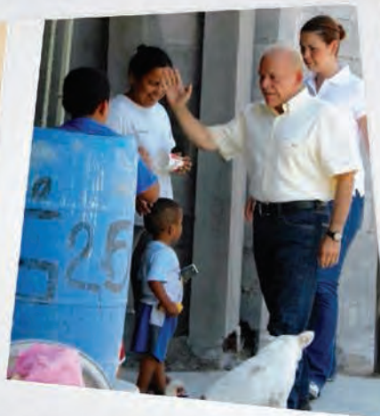
Visitando nuestro distrito