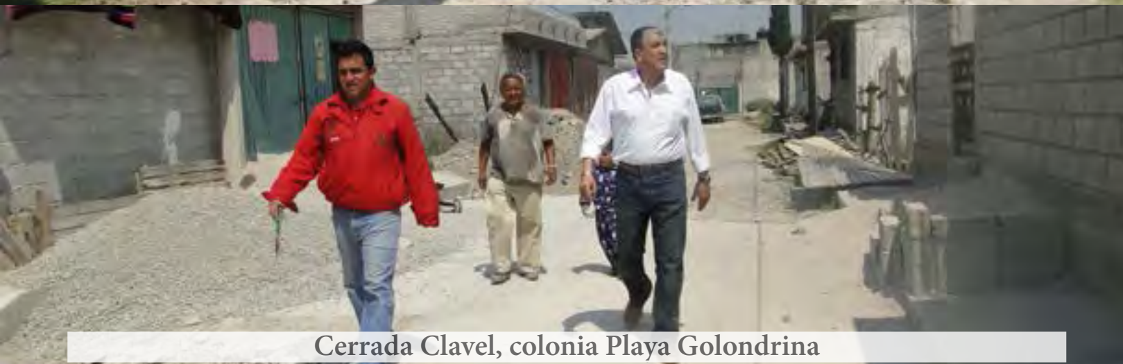
Cerrada Clavel, colonia Playa Golondrina