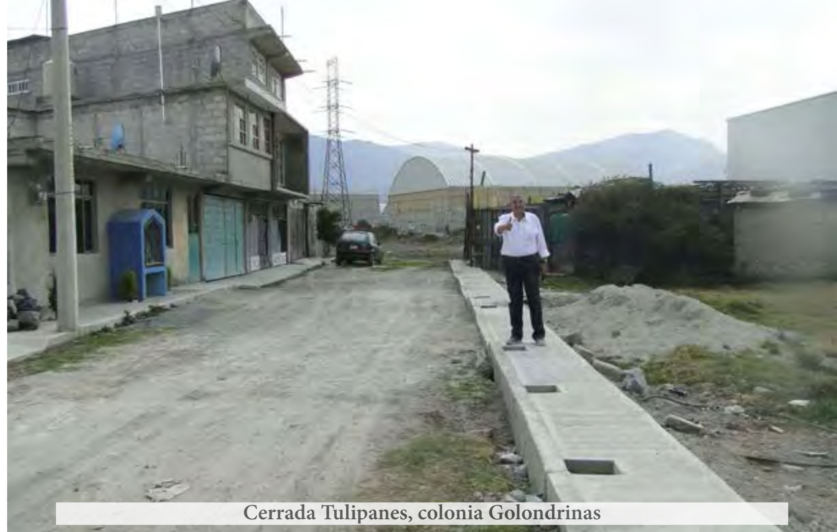
Cerrada Tulipanes, colonia Golondrinas

Estas son las calles que hemos incluido al programa de Guarniciones y Banquetas: