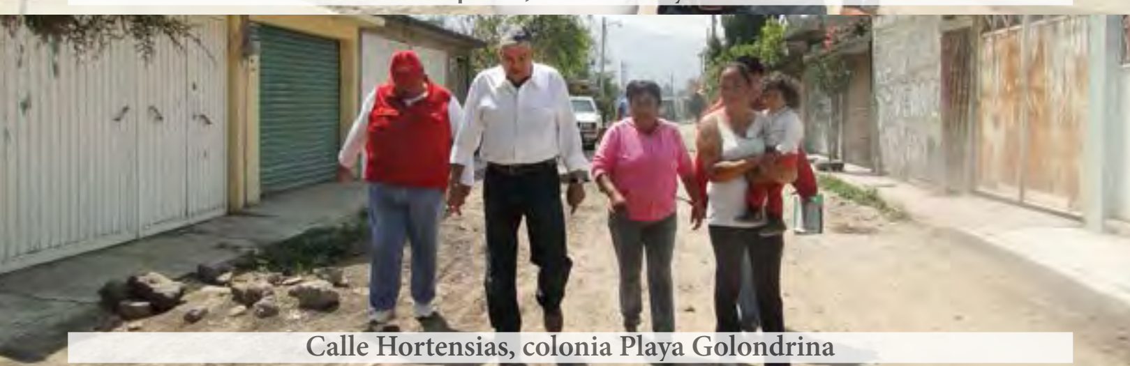
Calle Hortensias, colonia Playa Golondrina

Con gran satisfacción pongo a su conocimiento las calles que se encuentran en proceso de pavimentación.