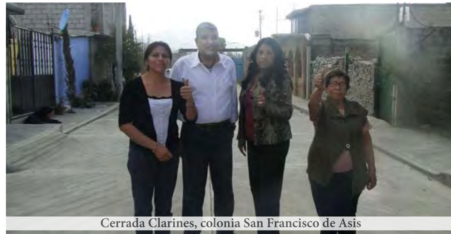
Cerrada Clarines, colonia San Francisco de Asis

Y para concluir pongo a su consideración las calles completamente concluidas en el programa de Pavimentación Participativa, guarniciones y banquetas: