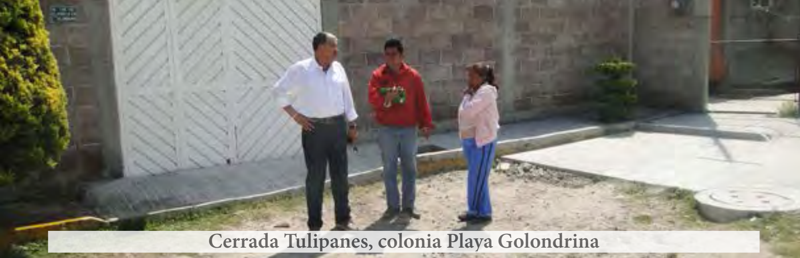
Cerrada Tulipanes, colonia Playa Golondrina