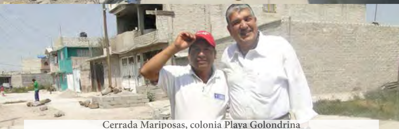
Cerrada Mariposas, colonia Playa Golondrina