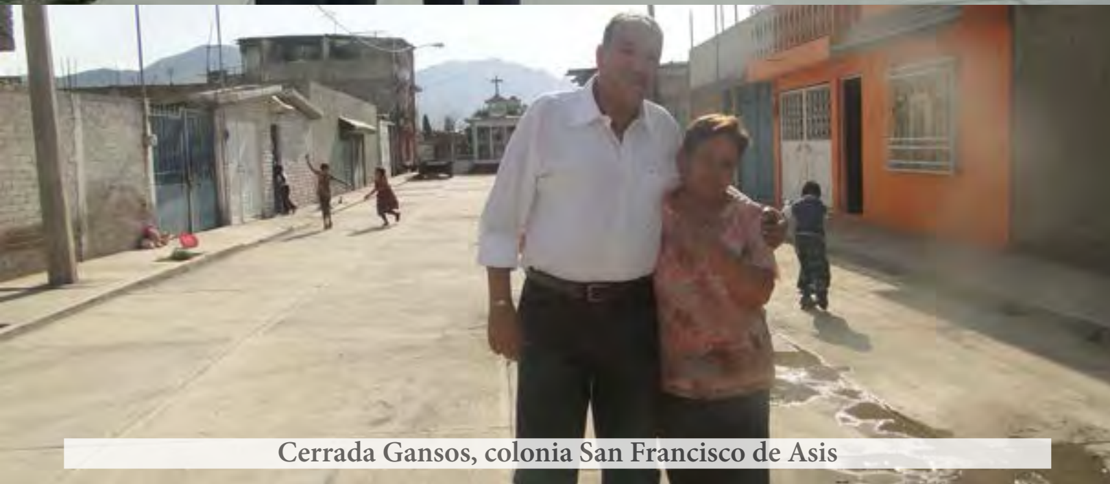
Cerrada Gansos, colonia San Francisco de Asis