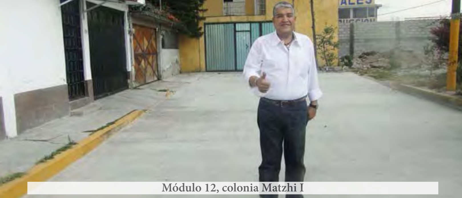
Módulo 12, colonia Matzhi I