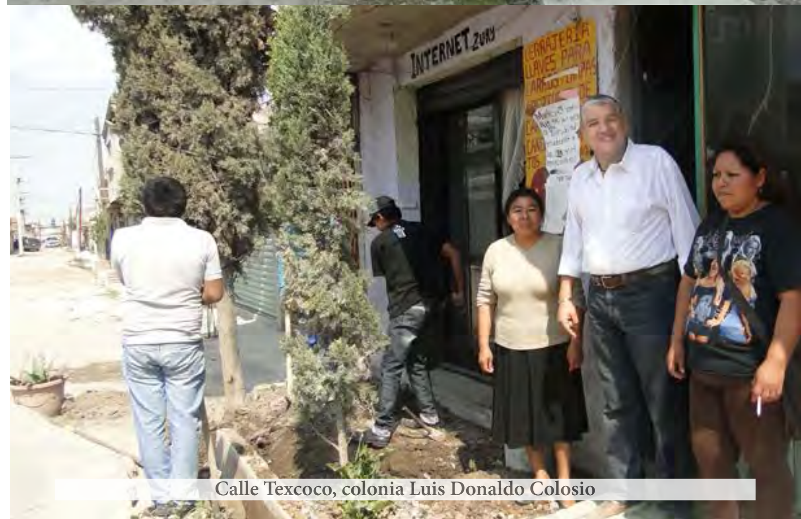
Calle Texcoco, colonia Luis Donaldo Colosio