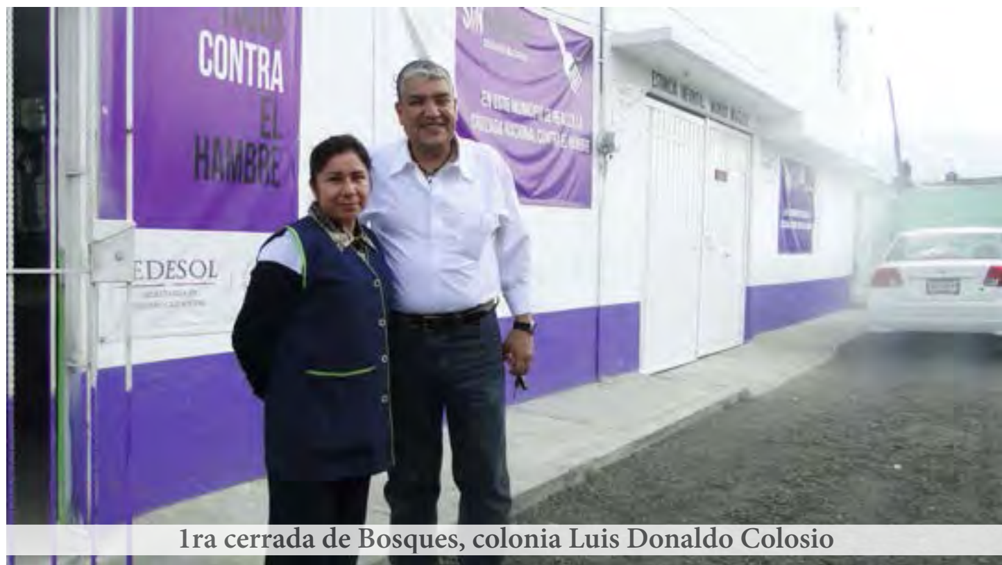
1ra cerrada de Bosques, colonia Luis Donaldo Colosio