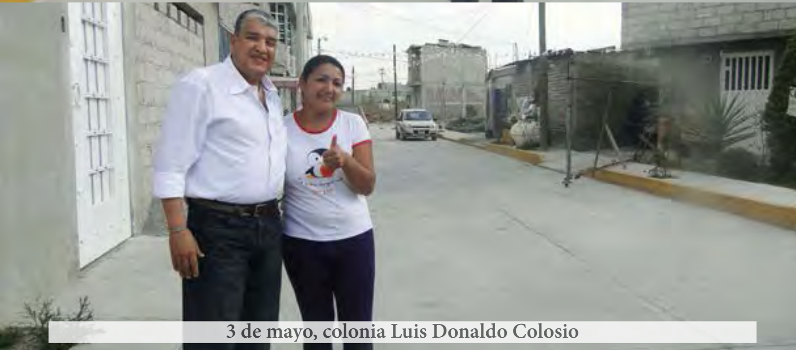
3 de mayo, colonia Luis Donaldo Colosio