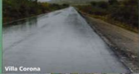
San Martín Hidalgo