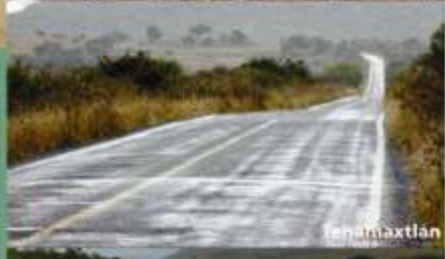
San Martín Hidalgo