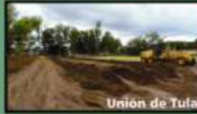
Unión de Tula