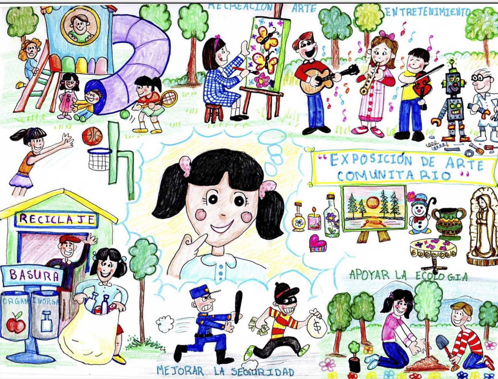
Dibujo ganador del 1er. Concurso de Dibujo infantil