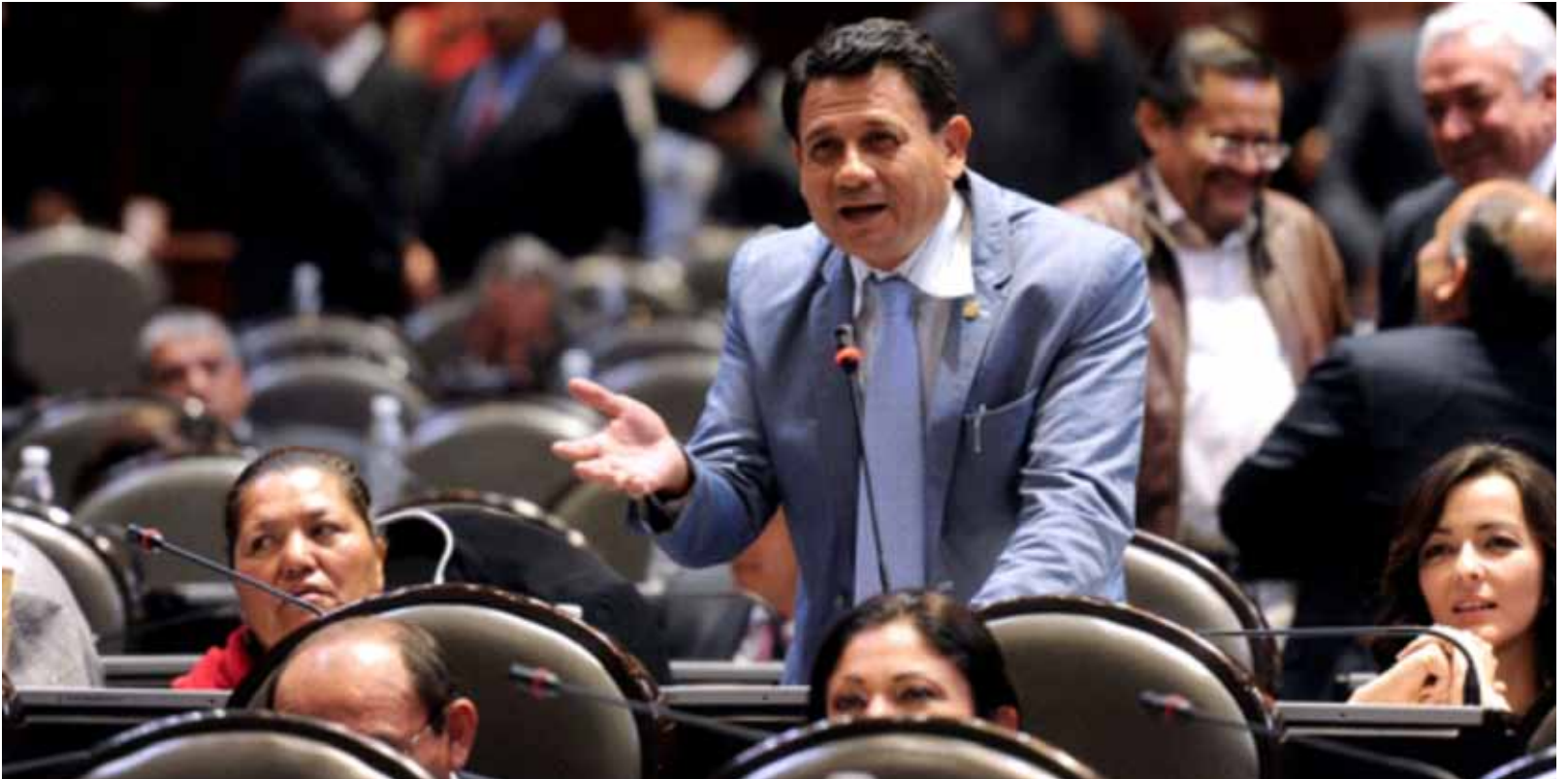
Diputado Alejandro Rangel interviene durante la discusión de la reforma energética.