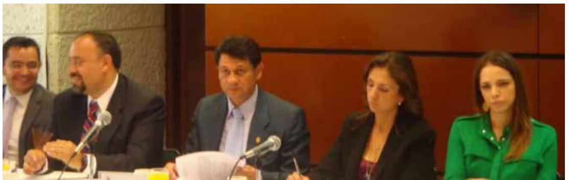
Primera mesa de trabajo en el Palacio Legislativo de San Lázaro.

Con el mismo objetivo se llevó a cabo la segunda mesa en las instalaciones del Instituto nacional de Medicina Genómica el día 16 de marzo del año en curso, uno de los Institutos Nacionales de Salud del país. En esta sesión, acudieron alrededor de 50 invitados.