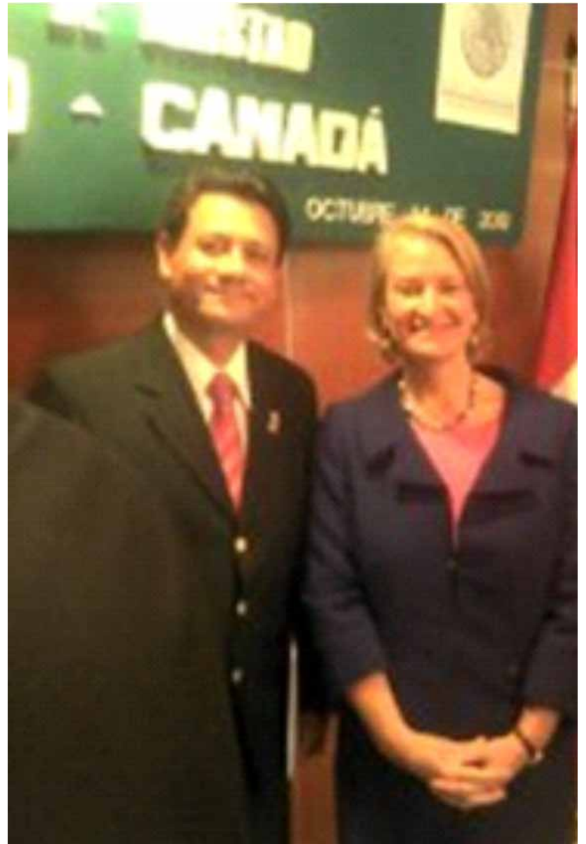
Diputado Alejandro Rangel Segovia y Sra. Sara Hradecky, Embajadora de Canadá en México.

La reunión Interparlamentaria México-Canadá se realiza cada año en forma alterna en cada país desde 1975 con el objetivo de intercambiar puntos de vista sobre temas clave de la relación bilateral.