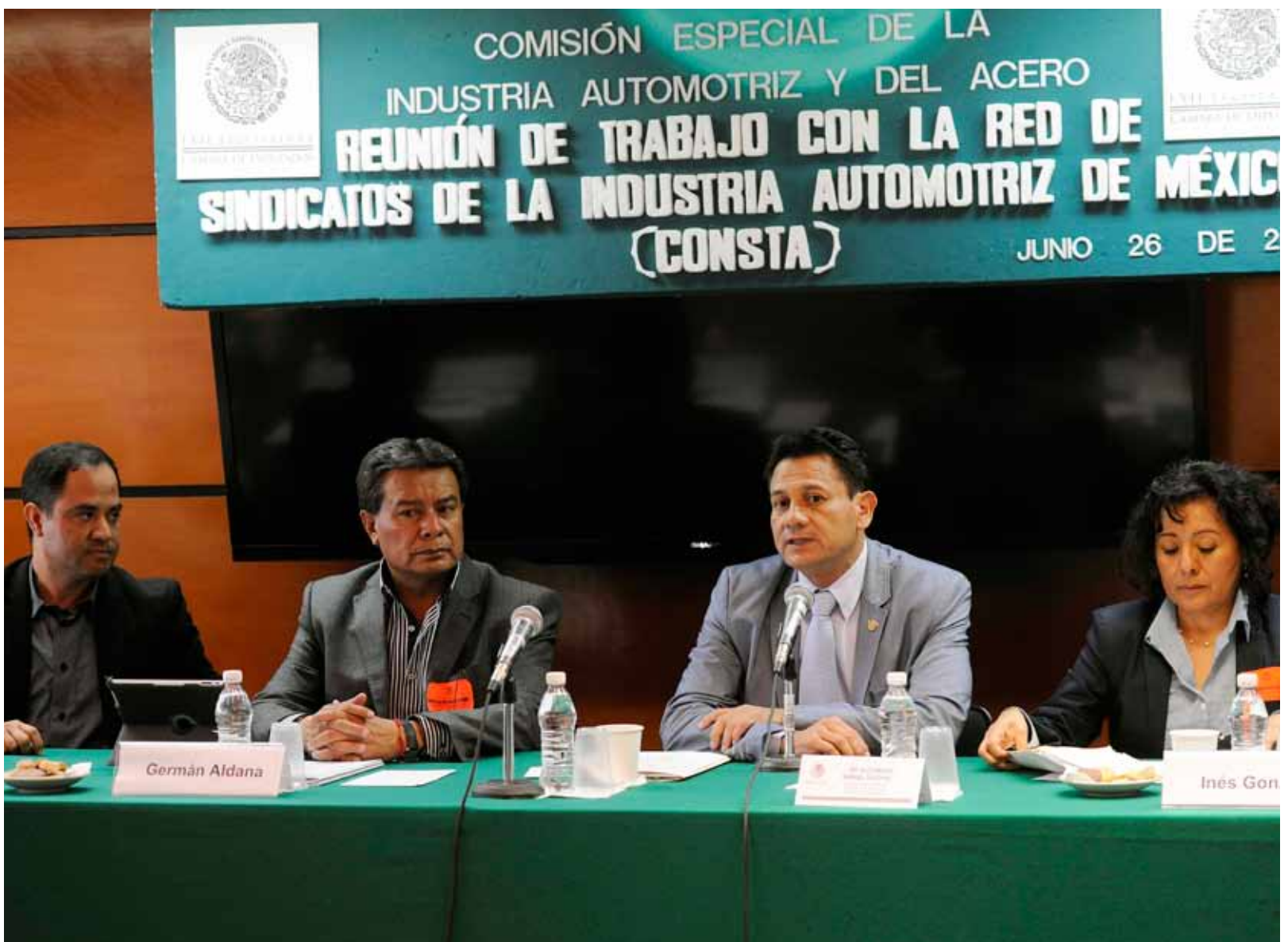
Diputado Alejandro Rangel Segovia, atiende reunión con Sindicatos de la Industria Automotriz.

aprovecharon la ocasión para solicitar a los diputados federales a fungir como intermediarios para que el Ejecutivo Federal elabore una política integral sectorial que mejore el salario de los trabajadores de este ramo, ya que sostuvieron, no es homólogo en todo el país.