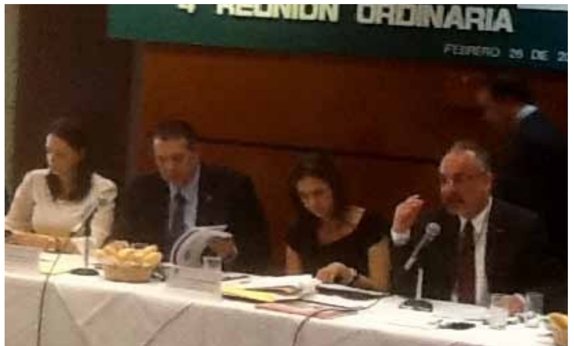
Simposium en el Langebio

En el Módulo II. “Creación y Desarrollo de Empresas con Base Científica y Tecnológica” un panel de académicos-directivos con experiencia en la generación de Empresas con Base Científica y Tecnológica expusieron desde su vivencia, los retos, requisitos, oportunidades, beneficios, obstáculos, financiamiento, etc. en la creación y desarrollo de Empresas con Base Científica y Tecnológica. De igual manera, se presentan las problemáticas encontradas y se sugieren propuestas a fin de mejorar el proceso de creación de Empresas con Base Científica y Tecnológica.