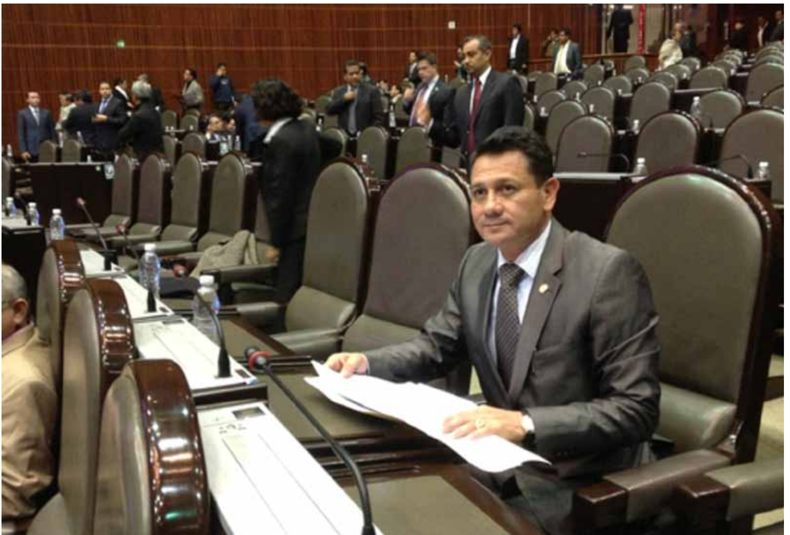
Diputado Alejandro Rangel Segovia, Consejero Nacional del PRI.

Al revisar los criterios considerados por la coordinación priista en la Cámara de Diputados, se conoció que tal nombramiento como Consejero Nacional del Diputado Rangel ha sido con base en su larga trayectoria partidista formando parte de los Consejos políticos municipal en su natal Irapuato y estatal en su estado Guanajuato, así como haber sido ya Regidor y Diputado Local en dos ocasiones.