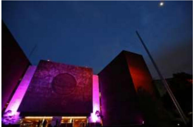
Iluminación de rosa del Frontispicio de la Cámara de Diputados, color que simboliza la lucha mundial contra el cáncer de mama.

Presentación del libro “Guerrilleras”: El 15 de marzo de 2015, la Comisión de Igualdad de Género presentó en la Cámara de Diputados el libro “Guerrilleras”, una antología de testimonios y textos sobre la participación de las mujeres en los movimientos armados socialistas en México, durante segunda mitad del siglo XX.