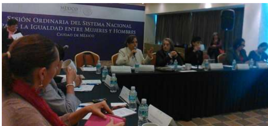
Sesión del Sistema Nacional para la Igualdad entre Mujeres y Hombres.

En esta materia, como Presidenta de la Comisión de Igualdad de Género, destaco mi participación en las XXIII y XXIV Reuniones del Sistema Nacional de Atención, Prevención, Sanción y Erradicación de la Violencia contra las Mujeres , realizadas el 8 de diciembre de 2014, así como en la XV Reunión Extraordinaria, llevada a cabo el 30 de enero de 2015.