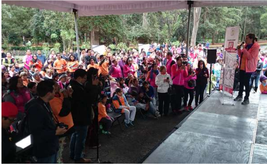
En el marco del derecho a la salud, impartimos pláticas sobre detección oportuna de cáncer de mama

Por otra parte, en recorridos en el territorio del Distrito 14 de Tlalpan, nos percatamos que las niñas y niños en edad preescolar requerían especial atención en materia de prevención de enfermedades dentales, por lo que emprendimos una activa campaña para la prevención bucodental en niñas y niños del pueblo de Chimalcoyotl, que incluyeron pláticas especializadas para el aprendizaje de las y los infantes.