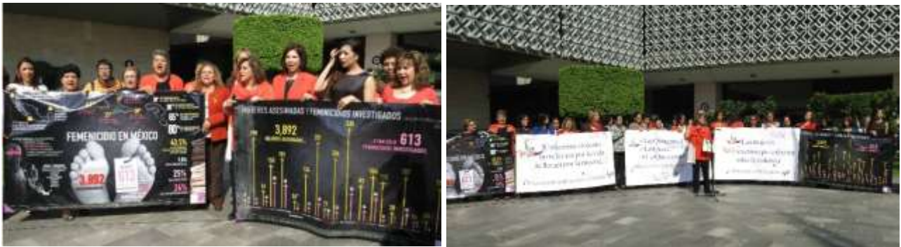
Encabezando el acto simbólico contra la violencia hacia las mujeres y las niñas, en la explanada de la Cámara de Diputados

Al encabezar los pronunciamientos, rechazé tajantemente esta grave violación a los derechos humanos que coarta la libertad, el bienestar, atenta contra la integridad y la vida de las mujeres y niñas.