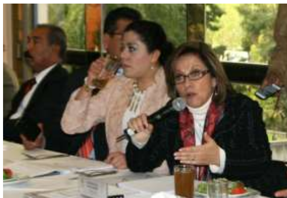
Participación en Reuniones de la Comisión de recursos Hidráulicos