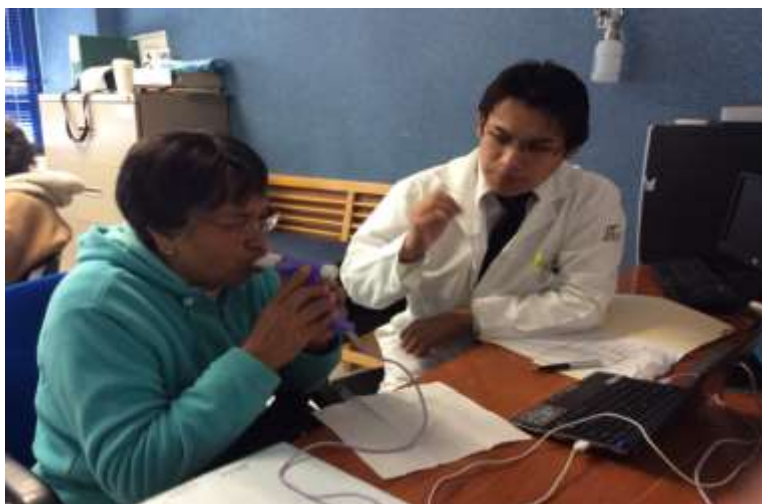
Estudios de espirometrías para la detección temprana de EPOC

Esta campaña contempló además la capacitación en el uso de nuevas tecnologías para cocinar, que incluye la introducción de estufas ecológicas, las cuales producen menor humo y lo expulsan de manera controlada. Este último año, fueron entregadas 90 estufas a familias que requería cambiar sus hábitos de cocción en beneficio de su salud.