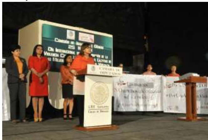
Iluminación del frontispicio de la Cámara de Diputados, con la que nos unimos a la campaña mundial de la ONU contra la violencia hacia las Mujeres

Iluminación Naranja del Frontispicio de la Cámara de Diputados: Como parte de la conmemoración del 25 de noviembre, Día Internacional para la Eliminación de la Violencia contra las Mujeres y las Niñas, organizamos la Iluminación Naranja del Frontispicio de la Cámara de Diputados, haciendo un llamado global a detener la violencia contra las mujeres.