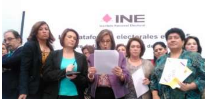
Con la Red Mujeres en Plural, presentando compromisos de partidos políticos para hacer efectiva la paridad