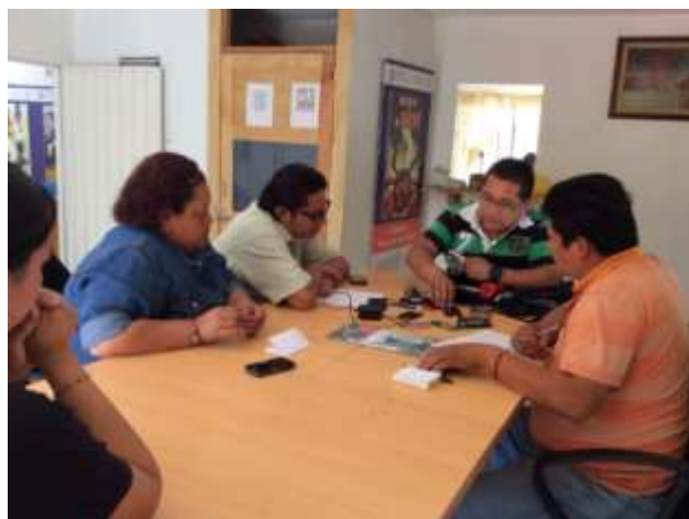
Capacitación en oficios no tradicionales. Reparación de tecnologías móviles

Para favorecer la independencia económica de las mujeres, fomentamos iniciativas productivas, mediante la impartición de talleres de oficios no tradicionales con perspectiva de género, como son: elaboración de alimentos dulces y salados a base de soya, reparación de tecnologías móviles y curso básico de primeros auxilios.