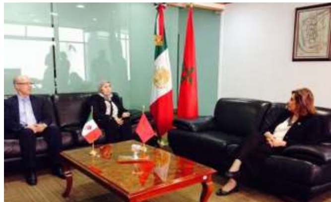
Con la Dip. Kenza El Gahli Vicepresidenta de la Cámara de Diputados del Reino de Marruecos.