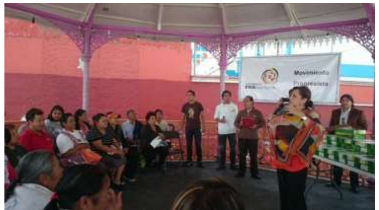
Zapatos terapéuticos para personas de escasos recursos con diabetes