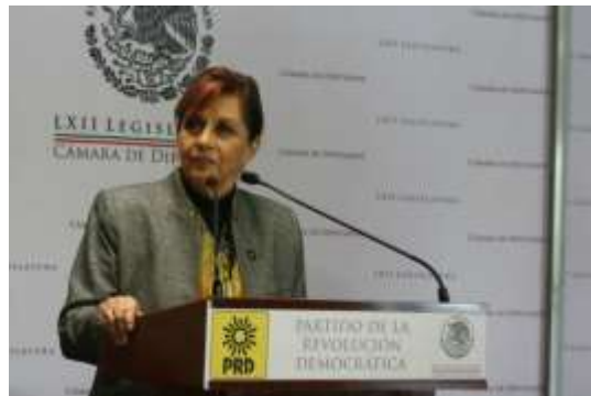
En rueda de prensa para presentar mi renuncia al Partido de la Revolución Democrática