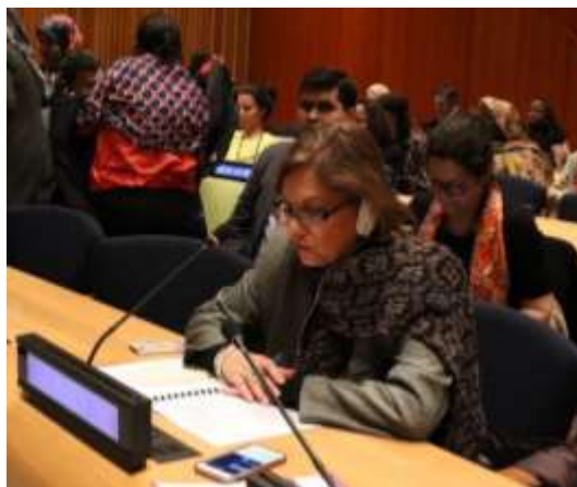
Durante la 59º periodo de sesiones de la Comisión de la Condición Jurídica y Social de la Mujer en Naciones Unidas

Este evento internacional permitió llamar la atención del mundo en torno a la persistente desigualdad de género; en este sentido y ante la presencia de las y los representantes, el Secretario General de la Organización de Naciones Unidas, Ban Ki-Moon, señaló que “los avances siguen siendo inaceptablemente lentos y los logros no son irreversibles”.