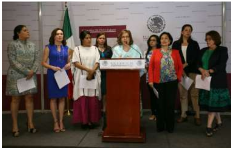
Diputadas y la Red de Mujeres en Plural nos manifestamos en contra de la violencia política contra las mujeres candidatas.

Asimismo, para que los gobiernos Federal, de los Estados y del Distrito Federal, así como las autoridades de procuración y administración de justicia de la federación y de las entidades federativas, investiguen y en su caso sancionen la violencia contra las mujeres candidatas y garanticen su seguridad.