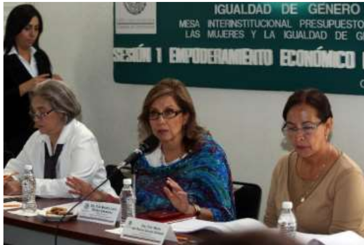
Sesión 1 de la Mesa Interinstitucional Presupuestos para las Mujeres y la Igualdad de Género