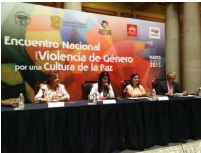
Encuentro Nacional sobre Violencia de Género. Por una cultura de Paz. Universidad Guanajuato 26 marzo 2015