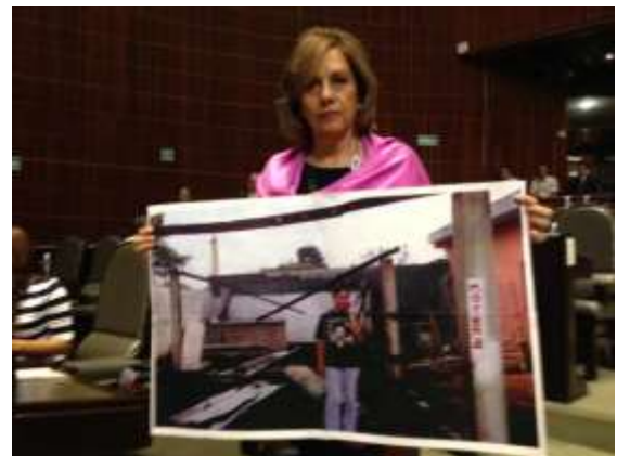
Participación desde mi curul en contra de la violencia política contra las mujeres, abril 2015