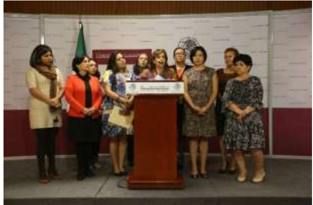
En rueda de prensa para denunciar el vacío en la aprobación de la Iniciativa de reforma a la Ley General de Acceso de las Mujeres a una Vida libre de Violencia