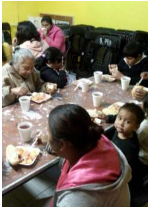
Coadyuvar con la operación del Comedor comunitario, en coordinación con la Secretaría de Desarrollo Social del DF

Por otra parte, las asesorías psicológicas y jurídicas siguieron siendo una de mis prioridades, por lo que en el último año brindamos 384 consultas y 278 asesorías especializadas a habitantes de los pueblos y colonia del sur de Tlalpan.