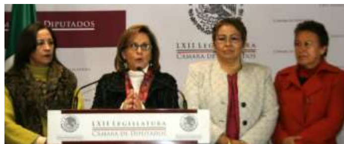
En rueda de prensa con Diputadas de la Comisión de Igualdad de Género para dar a conocer los beneficios de la Iniciativa de Reforma a la Ley General de Acceso de las Mujeres a una Vida libre de Violencia