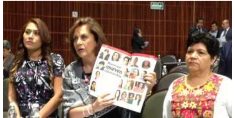
Intervención en Tribuna para denunciar la discriminación en contra de mujeres y defensoras de derechos humanos en Quintana Roo, marzo 2015.