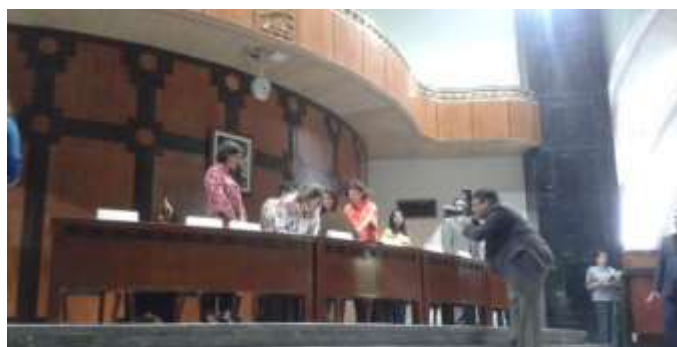
8 de marzo de 2015. Sorteo Conmemorativo por el 20 Aniversario de la Conferencia Mundial sobre la Mujer de Beijing en la Lotería Nacional.

El 8 de marzo de 2015, se llevó a cabo el Sorteo Zodiacal No. 1245 en las instalaciones de la Lotería Nacional, cuya imagen refirió al Aniversario de la Conferencia de Beijing y su importancia.