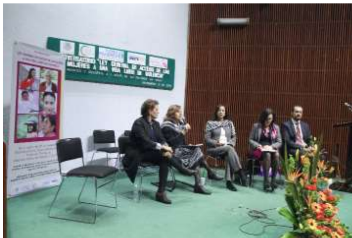
Conversatorio Ley General de Acceso de las Mujeres a una Vida Libre de Violencia. Avances y Desafíos a 7 Años de su Entrada en Vigor

perfeccionar la Ley General para el Acceso de las Mujeres a una Vida Libre de Violencia, debido a que la atención a las víctimas y la rehabilitación de agresores no son las más efectivas, además de que no existe un registro real sobre los feminicidios en México. Las y los participantes cuestionamos la falta de órdenes de protección a víctimas y su tardía tramitación, lo cual, ha incrementado las agresiones en contra de las mujeres.