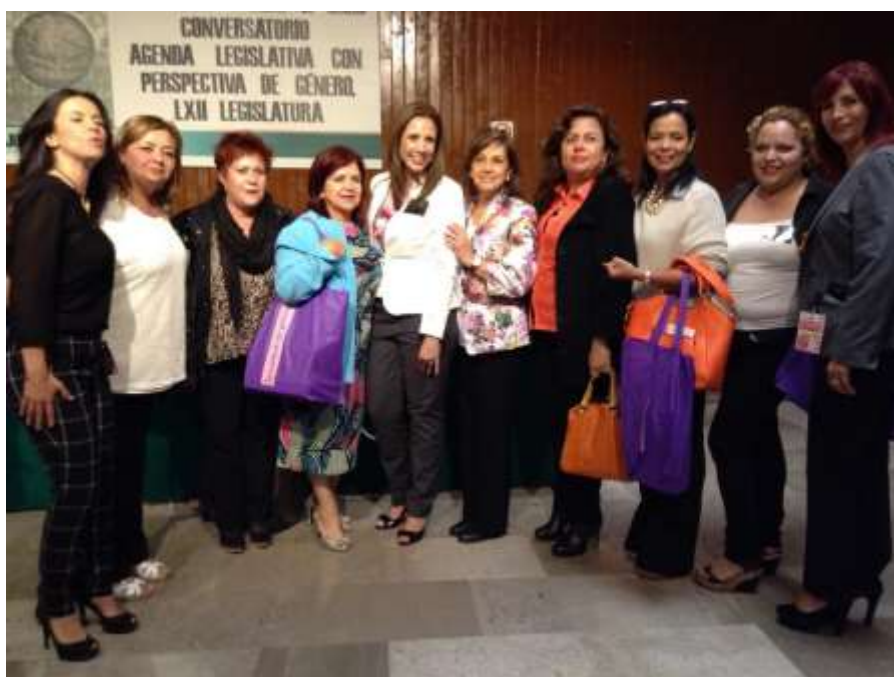
Con Diputadas electas a la LXIII Legislatura