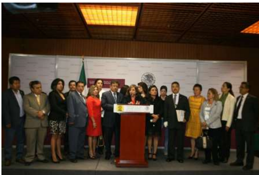
Con mi grupo parlamentario, por la defensa de los derechos humanos.

La creación de la Unidad de Igualdad de Género es un logro importante de la izquierda y representa un parte aguas que da al poder legislativo la oportunidad para replantear nuevas formas de prácticas laborales y una cultura organizacional fincada en los principios de igualdad, equidad y no discriminación, que inhiba cualquier acto de hostigamiento laboral o sexual, y que busque un equilibrio en el trato y en el acceso a oportunidades entre mujeres y hombres, basado en sus capacidades y no en razón del género.