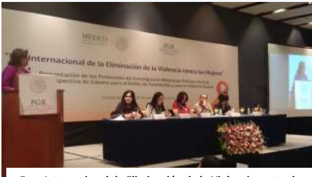
Foro Internacional de Eliminación de la Violencia contra las Mujeres, noviembre 2014