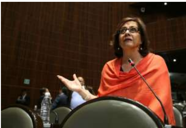
Participación desde mi curul, por la defensa de los derechos sexuales y reproductivos de las mujeres, abril 2015