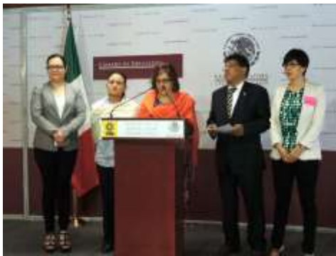
En rueda de prensa con la Diputada Aleida Alavés, Guadalupe Moctezuma y el Diputado Miguel Alonso Raya, así como la sociedad civil, para denunciar el retiro del orden del día en la Comisión de salud, de la Iniciativa de Reformas a la Ley General de Salud en materia de salud sexual y reproductiva