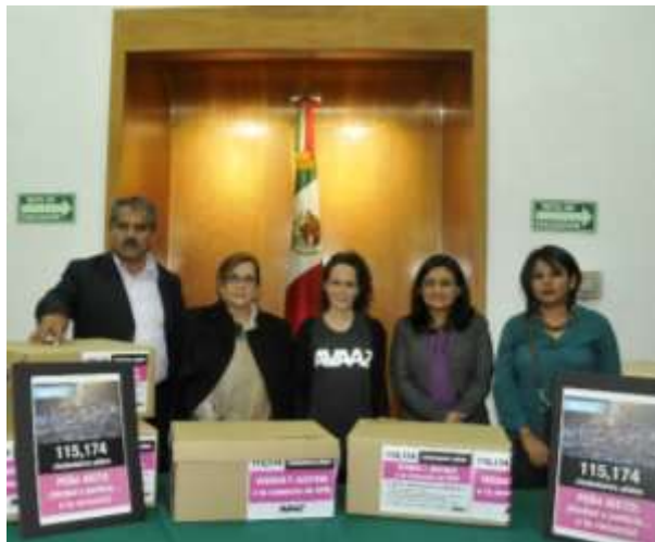
Entrega de firmas ciudadanas: Verdad y Justicia o la renuncia de Peña Nieto