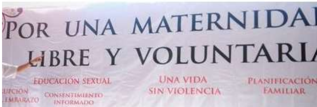
Por una maternidad libre y voluntaria

En el evento, se brindó información sobre prevención de embarazo y maternidad libre a más de 300 mujeres, quienes además participaron en diversas actividades culturales y de esparcimiento.