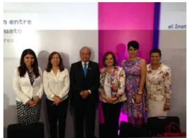
En la Firma del Convenio de Colaboración entre el Inmujeres y el Gobierno de Guanajuato, por la Igualdad entre mujeres y hombres