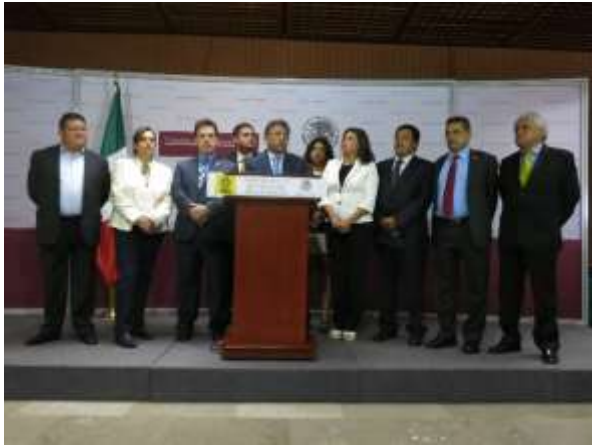
En rueda de prensa con el GPPRD para hablar el rechazo de la SCJN al recurso de consulta popular sobre la reforma energética