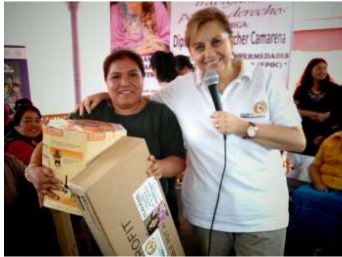
Uso de nuevas tecnologías para la cocción de alimentos, para la prevención de enfermedades pulmonares en las mujeres y sus familias de Tlalpan.