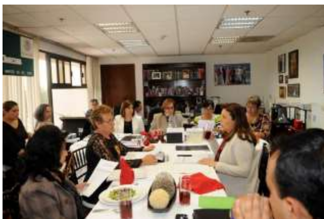
Vigésima Séptima Reunión de Junta Directiva de la CIG

Asimismo, en la Comisión de Igualdad de Género aprobamos diversos exhortos, entre los que destacan: