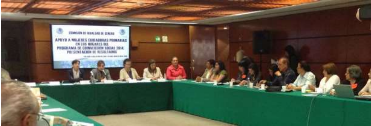
Reunión con actores sociales beneficiarios del Programa de Apoyo a Mujeres Cuidadoras primarias en los hogares.