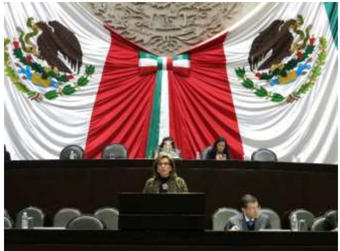
Participación en tribuna para fundamental reformas a la Ley General para la Igualdad entre Mujeres y Hombres, a fin de que madres y padres adoptivos cuenten también con