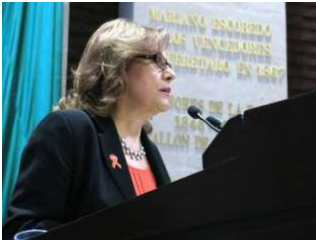
Participación en Tribuna, para defender el presupuesto con perspectiva de género en el Programa de Egresos de la Federación 2015, noviembre 2014