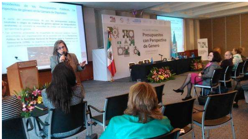
Intervención durante el Encuentro Nacional de Presupuestos con Perspectiva de Género, 4 diciembre 2014