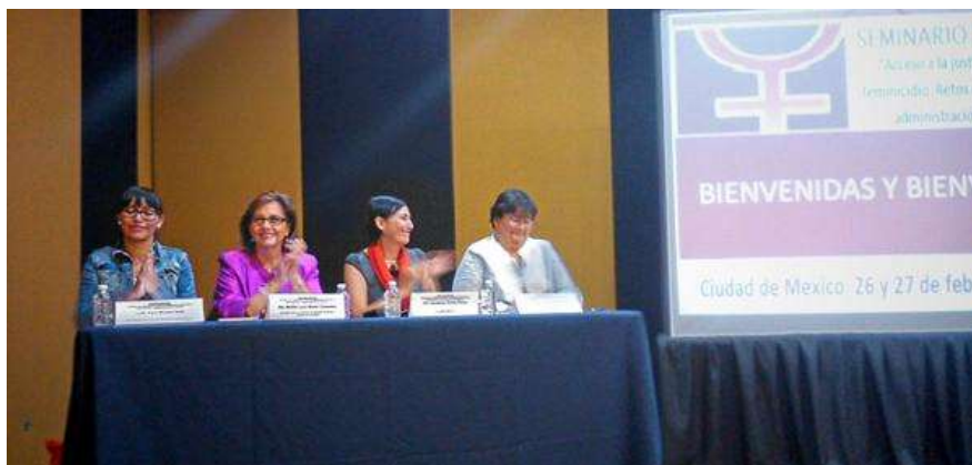
Durante la Inauguración del Seminario "Acceso a la justicia en los casos de femicidio", 26 febrero 2015