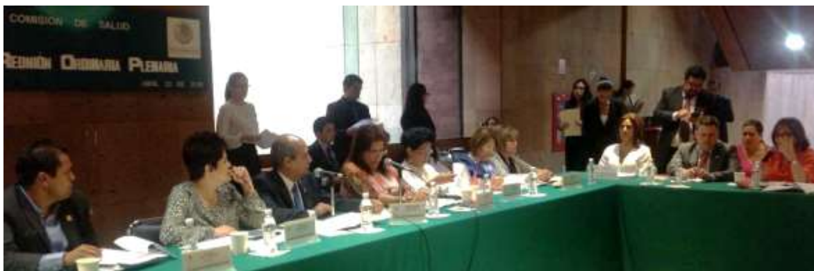
Reunión ordinaria de Plano de la Comisión de Salud

Se realizaron diversos foros y reuniones con autoridades federales y locales, así como con personas expertas en materia de salud, a fin de allegarnos de experiencias exitosas que coadyuven al mejoramiento de una adecuada cobertura sanitaria, el análisis y la consideración de opciones para su buen funcionamiento.