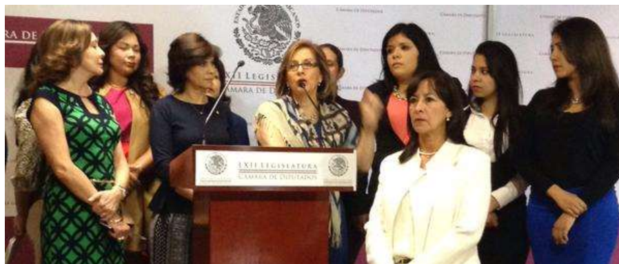
Diputadas de todas las fuerzas políticas unidas para denunciar públicamente la violencia política en contra de las mujeres candidatas, abril 2015