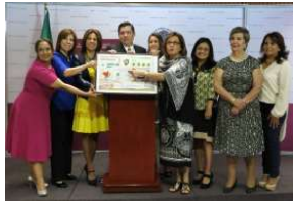
En rueda de prensa para presentar el Billeto de la Lotería Nacional, conmemorativo por el vigésimo aniversario de la Conferencia de la Mujer de Beijing