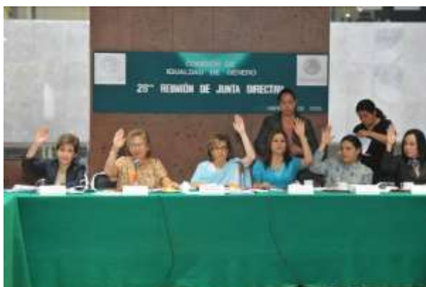
En la primera sesión de la Vigésima Octava Reunión de Junta Directiva de la CIG, declarada en permanente

Destaca también la Opinión emitida por la Comisión de Igualdad de Género a la Minuta con Proyecto de Decreto por el que se expide la Ley General de Derechos de Niñas, Niños y Adolescentes y se reforman diversas disposiciones de la Ley General de Prestación de Servicios para la Atención, Cuidado y Desarrollo Integral Infantil.