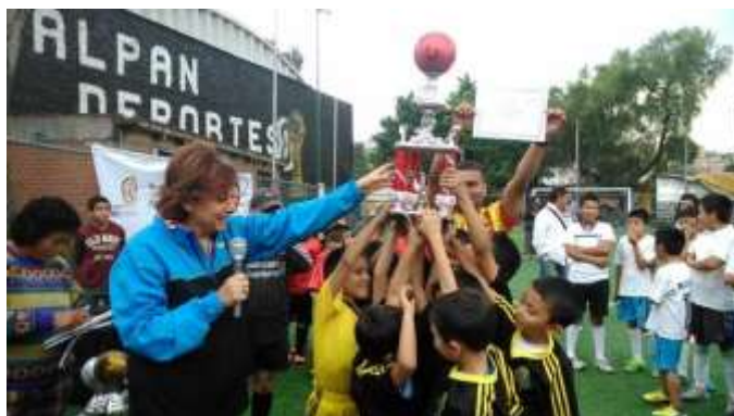
Liga de futbol infantil en Tlalpan

Con motivo del Día Internacional de las Mujeres, y en colaboración con la Lotería Nacional, se imprimió un Billete conmemorativo alusivo al 20 aniversario de la Convención de Beijín. El evento del Sorteo, celebrado en el Edificio principal de la Lotería Nacional se llevó a cabo el 8 de marzo y contó con la presencia de mujeres líderes de Tlalpan, como invitadas especiales.