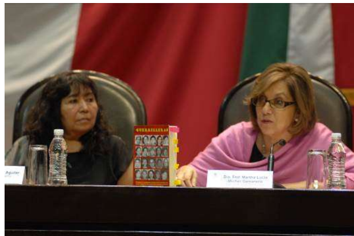
Presentación del libro “Guerrilleras” en la Cámara de Diputados

Presentación del libro “Guerrilleras”: El 15 de marzo de 2015, la Comisión de Igualdad de Género presentó en la Cámara de Diputados el libro “Guerrilleras”, una antología de testimonios y textos sobre la participación de las mujeres en los movimientos armados socialistas en México, durante segunda mitad del siglo XX.