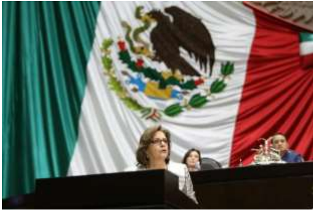
Intervención en Tribuna para hablar sobre la situación de los derechos de las mujeres en México, el marco del Día Internacional de las Mujeres, marzo 2015