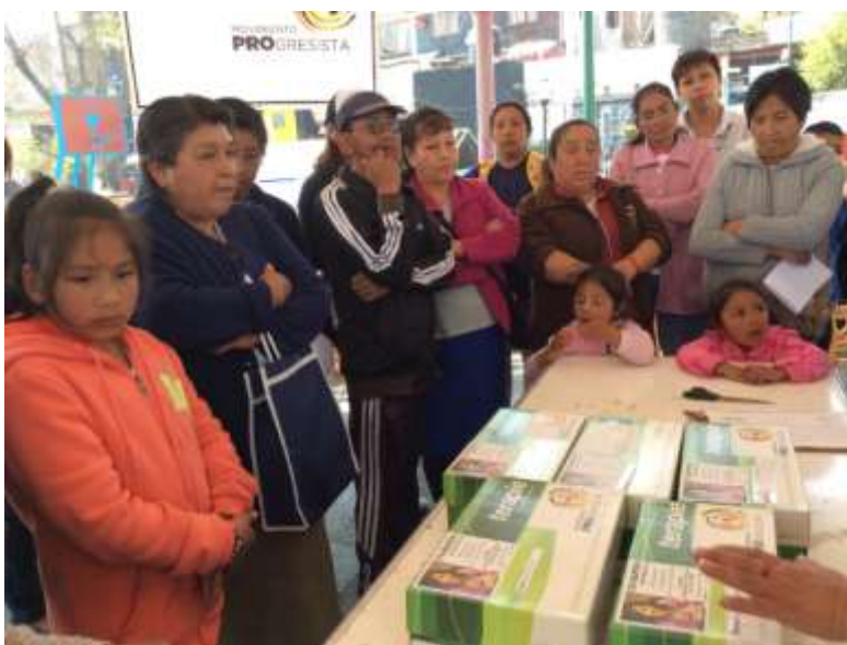
Entrega de calzado terapéutico para personas de escasos recursos con diabetes