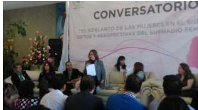
Conversatorio "El Adelanto de las Mujeres en siglo XXI, Retos y perspectivas del Sufragio Femenino en México", Guanajuato octubre 2014