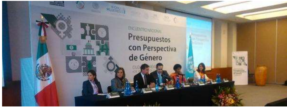
Con la Directora Ejecutiva de ONU Mujeres, Phumzile Mlambo, en el Encuentro Nacional Presupuestos con perspectiva de Género, 4 diciembre 2014