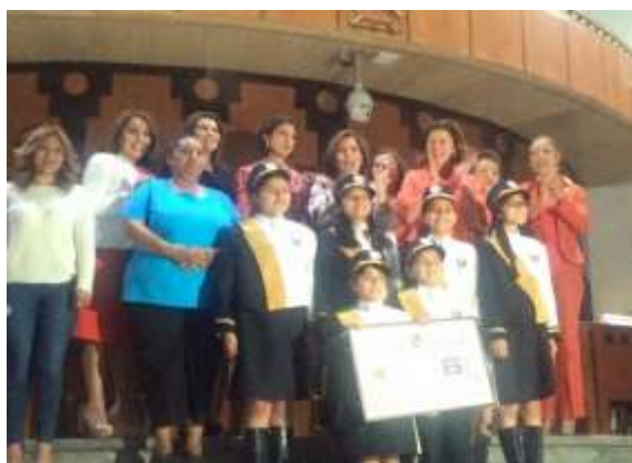
Mujeres líderes de Tlalpan durante el Sorteo de la Lotería Nacional por el Vigésimo Aniversario de la Conferencia de la Mujeres de Beijing.