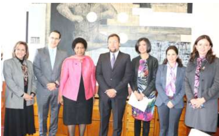
Con la Señora Phumzile Mlambo-Ngcuka, Directora Ejecutiva de ONU Mujeres, durante su visita a México y participación en el 2º Encuentro Nacional de Legisladoras de las Comisiones para la Igualdad de Género y Titulares de los Mecanismos para el Adelanto de las Mujeres.

En este marco, tuve la oportunidad de participar en el Segundo Encuentro Nacional de Legisladoras de las Comisiones para la Igualdad de Género y Titulares de los Mecanismos para el Adelanto de las Mujeres en las Entidades Federativas , que se llevó a cabo el 4 y 5 de diciembre de 2014, con la presencia de la Señora Phumzile Mlambo-Ngcuka, Directora de ONU Mujeres.