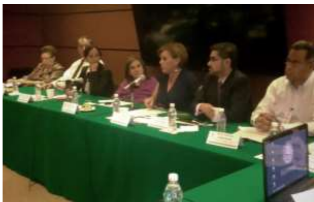
Mesa Interinstitucional Presupuestos para las Mujeres y la Igualdad de Género. Bienestar de las Mujeres

La Comisión de Igualdad de Género llevó a cabo una reunión de trabajo el día 7 de octubre con la Secretaría de Desarrollo Social en la que se abordaron temas como: la Unidad de Igualdad de Género de la Secretaría de Desarrollo Social, el Programa de Estancias Infantiles y el Seguro de Vida para Jefas de Familia, así como el análisis de los temas del Prospera y el Programa de Apoyo a las Instancias de Mujeres en las Entidades Federativas (PAIMEF) de INDESOL.