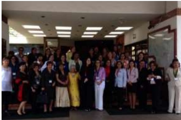
Encuentro con Diputadas Presidentas e Integrantes de comisiones de equidad e igualdad en Latinoamérica