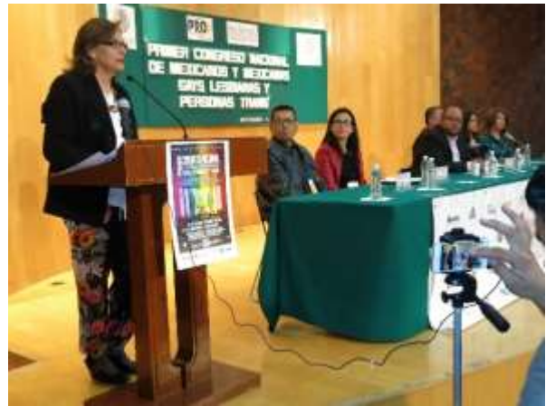
En el Primer Congreso Nacional de Mexicanas y mexicanos gays, lesbianas y personas transgénero