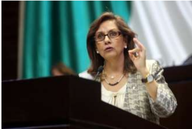
Participación en Tribuna. Análisis de la glosa del Segundo Informe del Ejecutivo. Septiembre de 2014