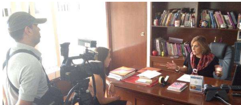
Entrevista en materia de participación política de las mujeres, abril 2015.