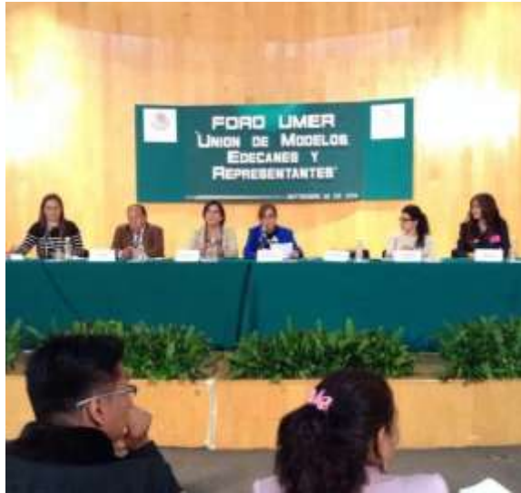
Participación en el Foro de UMER, Unión de Modelos y Edecanes, donde hice un llamado a realizar diagnósticos sobre violencia, trata y condiciones laborales de mujeres edecanes y modelos, septiembre 2014