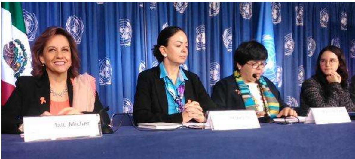
En el lanzamiento en México de la campaña Únete para poner fin a la violencia contra las mujeres @ONUMujeresMX, noviembre 2014