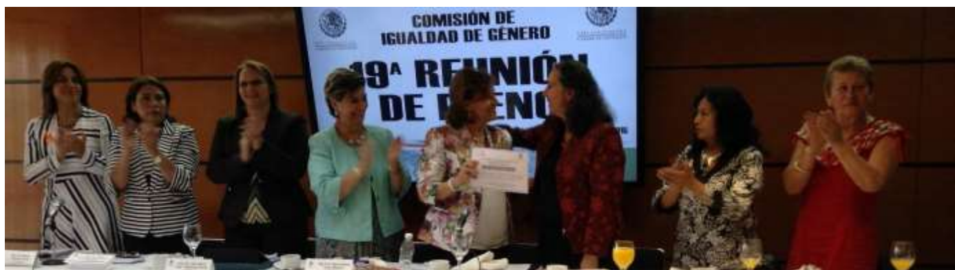
Diputadas de la Comisión de Igualdad de Género entregamos un reconocimiento a la Dra. Marcela Lagarde y de los Ríos, durante la Clausura del Seminario “Género y Democracia”

Como parte de las actividades de actualización para fortalecer el trabajo legislativo en materia de igualdad de género, organizamos el Seminario “Género y Democracia”, impartido por la Doctora Marcela Lagarde y de los Ríos, con sesiones durante los meses de septiembre y octubre de 2014, así como en febrero de 2015.