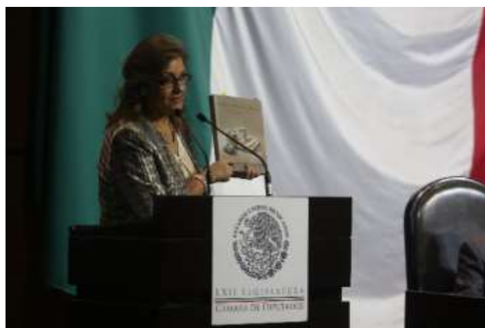
Presentación del libro “Mañana te escribiré otra vez”, de Minou Tavarez Mirabal