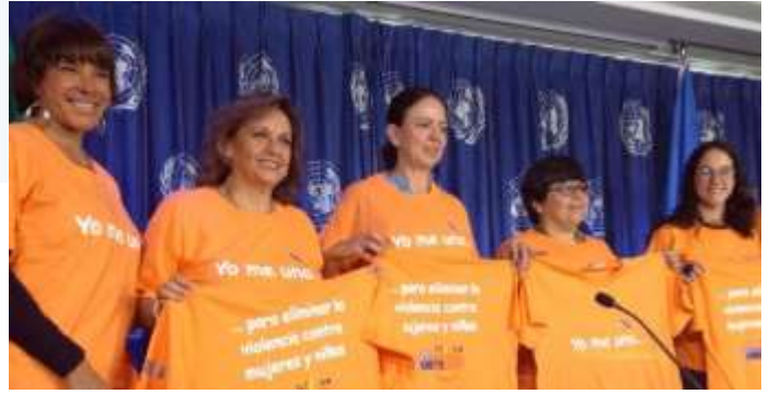
Día Naranja contra la violencia hacia las mujeres, noviembre 2015