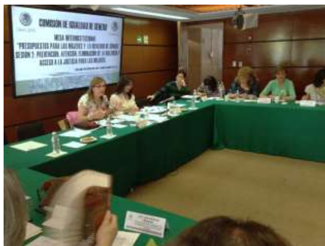
Mesa Interinstitucional Presupuestos para las Mujeres y la Igualdad de Género. Prevención, Atención y Eliminación de la Violencia y Acceso a la Justicia para las Mujeres

Además de la Procuraduría General de la República representada por la Subprocuraduría Especializada en Investigación de Delincuencia Organizada; la Secretaría de Turismo representada por la Subsecretaría de Planeación y Política Turística, la Dirección General de Desarrollo de Productos Turísticos y el Fondo Nacional de Fomento al Turismo y finalmente, la Comisión Nacional de los Derechos Humanos representada por la Cuarta Visitaduría General.