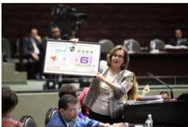
Billete conmemorativo 20 Aniversario de la Conferencia Mundial sobre la Mujer de Beijing 1995-2015

En el marco del Día Internacional de las Mujeres y como parte de esta línea de trabajo, desde la Comisión de Igualdad de Género gestionamos la emisión de un billete de la Lotería Nacional, conmemorativo al vigésimo aniversario de la Cuarta Conferencia Mundial sobre la Mujer.