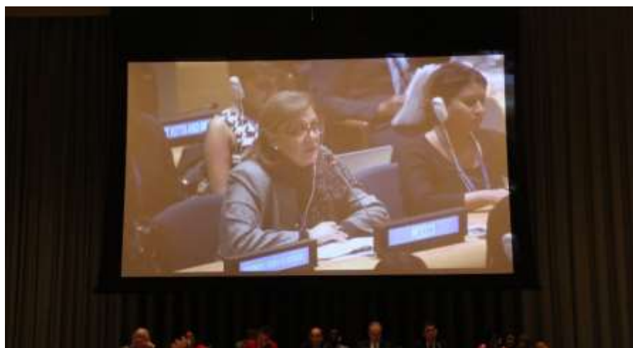
Durante mi participación en el 59º periodo de sesiones de la Comisión de la Condición Jurídica y Social de la Mujer en Naciones Unidas