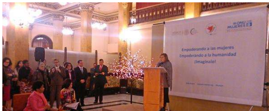
Ante la Secretaria de la ONU Mujeres Phumzile Mlambo, diciembre 2014