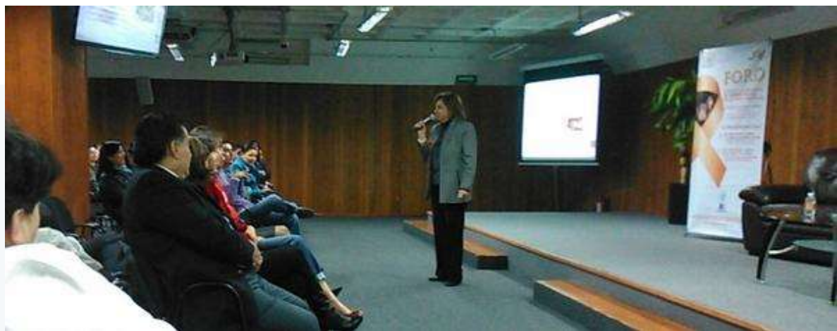
Foro "Género y Acoso Sexual Laboral", Junta Local de Conciliación y Arbitraje del Distrito Federal, 28 de noviembre 2014