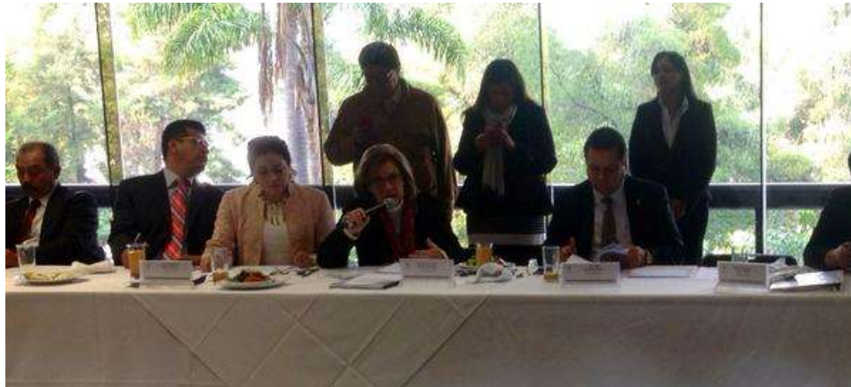
Reunión de la Comisión de recursos Hidráulicos

Para este fin, las Diputadas y Diputados que integramos la Comisión de Recursos Hidráulicos llevamos a cabo múltiples foros y encuentros regionales, talleres, seminarios, coloquios y mesas redondas, así como una consulta ciudadana para generar los espacios de interlocución con la sociedad civil, las instituciones, las universidades, las autoridades, las expertas y expertos en este tema.