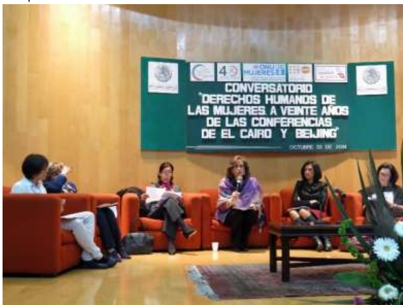
Conversatorio “Derechos Humanos der las Mujeres. A 20 años de la Conferencia de Beijing y el Cairo”.

mortalidad materna y la violencia contra las mujeres y las niñas, aún son asuntos pendientes en el país.