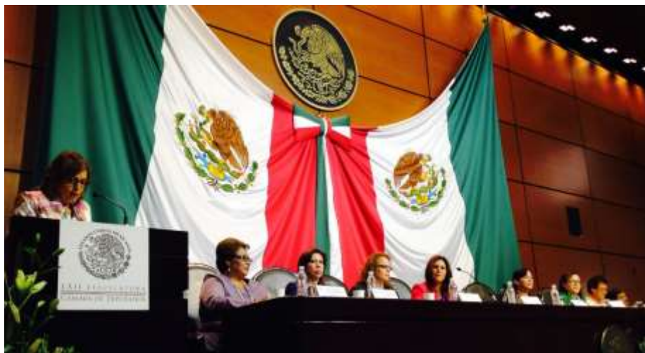
Evento "Agenda Legislativa con Perspectiva de Género, Legislatura LXIII"

Diputadas federales y las Diputados electas, a fin de esbozar los avances y retos de la agenda legislativa para la igualdad de género en México.