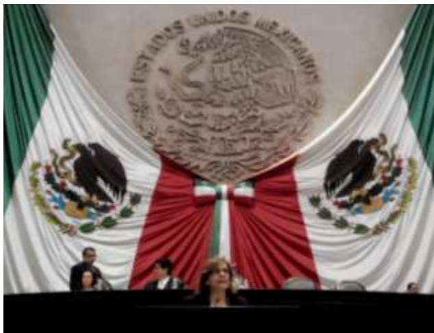
Posicionamiento en Tribuna de la Cámara de Diputados

Di seguimiento puntual al análisis, discusión y votación de la legislación en materia político electoral, de telecomunicaciones y energética, expresé en tribuna mi rechazo a la aprobación de leyes y reformas secundarias que considero contrarias al interés público y violatorias de los derechos humanos del pueblo de México. Por eso, propuse modificaciones a esas propuestas legislativas, para darles un sentido social y humano con visión de género.