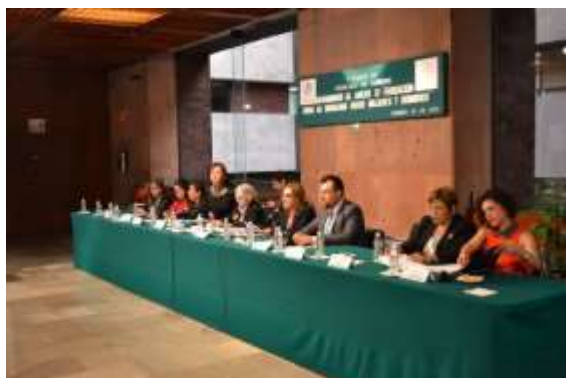
Seguimiento al Anexo 12 "Erogaciones para la Igualdad entre Mujeres y Hombres"

En las reuniones promovimos la unificación de esfuerzos, la coordinación interinstitucional y el trabajo conjunto, esto a fin de evitar duplicidades en funciones o en programas entre las dependencias.