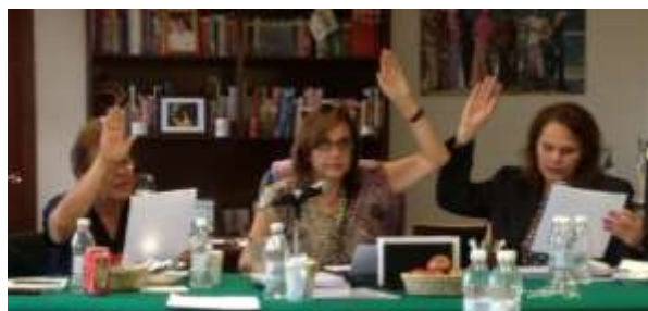
Reunión de Junta Directiva de la Comisión de Igualdad de Género

Aprobamos también exhortos a los a los Gobiernos estatales y municipales, para realizar actividades conmemorativas al 60 aniversario del derecho al voto de las mujeres en México; así como para sumarse a la campaña Naranja para poner fin a la violencia contra las mujeres. De igual forma aprobamos exhortos a los Poderes Ejecutivos de los Estados para que incorporen la perspectiva de género en la planeación y diseño de su Presupuesto de Egresos; para tipificar el feminicidio; así como para derogar delitos como el de “adulterio” en Estados donde aún era penado.