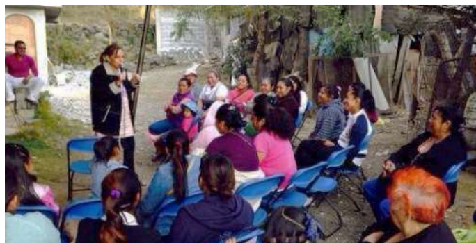
Taller con mujeres en Tlalpan, Ciudad de México