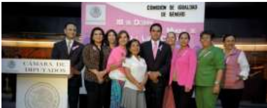
Iluminación del Frontispicio del Palacio Legislativo de San Lázaro, en el marco del Día de lucha contra el Cáncer de Mama