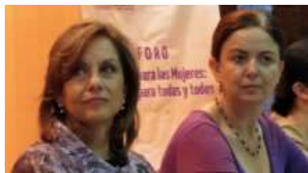
Foro "Igualdad para las Mujeres, Progreso para todas y todos"

Foro "Agenda Legislativa sobre Igualdad de Género, Cambio Climático y Bosques en México": Se llevó a cabo el 29 de abril de 2014 con el objetivo de generar propuestas para avanzar en la agenda de armonización legislativa sobre igualdad de género, cambio climático y manejo forestal sustentable en México.