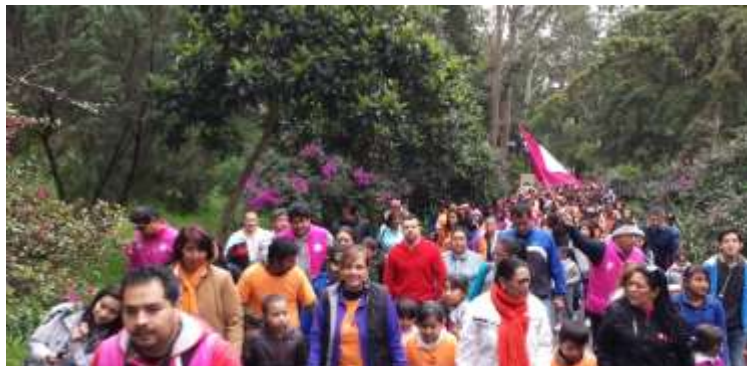
Caminata del Día Internacional para la Eliminación de la Violencia contra las Mujeres y las Niñas

Con el fin de apoyar a quienes no cuentan con su Acta de Nacimiento, realizamos las gestiones necesarias para que el Registro Civil llevara a cabo los registros extemporáneos.