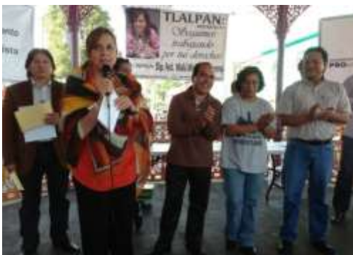
Dialogando con vecinas y vecinos de Tlalpan

En apoyo de la economía familiar, se beneficiaron a cerca de 4,000 familias, otorgándoles gratuitamente productos de la canasta básica. Asimismo, con el objetivo de fomentar la convivencia familiar y las tradiciones de los pueblos, llevamos a las zonas con alta vulnerabilidad 4,000 bolsas de dulces, 500 piñatas y más de 4,000 juguetes.