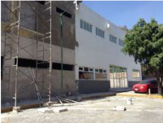
Recursos para la construcción del Centro de Justicia para Mujeres Víctimas de Violencia, Ciudad de México