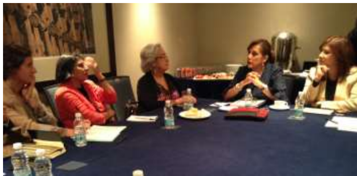
Reunión con la Relatora Especial de Naciones Unidas sobre la violencia contra las Mujeres, Sra. Rashida Manjoo.

De igual forma, destaca la reunión sostenida el 9 de julio de 2014 con la Sra. Rashida Manjoo, Relatora Especial de Naciones Unidas sobre la Violencia Contra la Mujer, sus Causas y Consecuencias. En dicha reunión, intercambiamos puntos de vista a propósito del trabajo legislativo para el ejercicio pleno del derecho de las mujeres a vivir sin violencia.