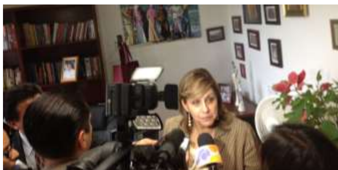
Posicionamiento de la agenda de los derechos de las mujeres en medios de comunicación

Durante este periodo, como Diputada Federal, como integrante del Grupo Parlamentario del Partido de la Revolución Democrática y como Presidenta de la Comisión de Igualdad de Género, he generado o participado en más de 60 comunicados de prensa, posicionamientos y boletines informativos; en más de 25 conferencias de prensa y en cerca de 100 entrevistas para distintos medios de comunicación en televisión nacional, internacional y local, radiodifusoras con cobertura nacional y local, traducidas a lenguas indígenas, diversos diarios y medios impresos; así como en diferentes medios de comunicación que se publican vía internet.