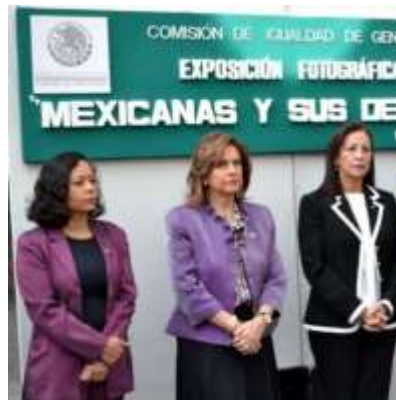
Inauguración de la Exposición "Las Mexicanas y sus Derechos"