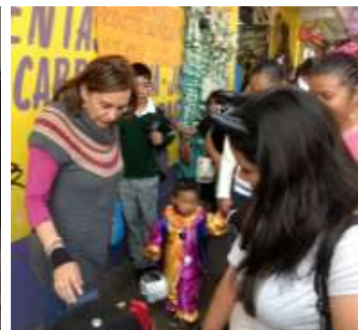
Entrega de juguetes a niñas y niños en Tlalpan