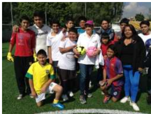
Equipos de la Liga Progresista de Futbol