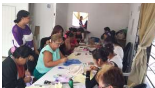
Talleres para promover el empoderamiento y la independencia económica de las mujeres