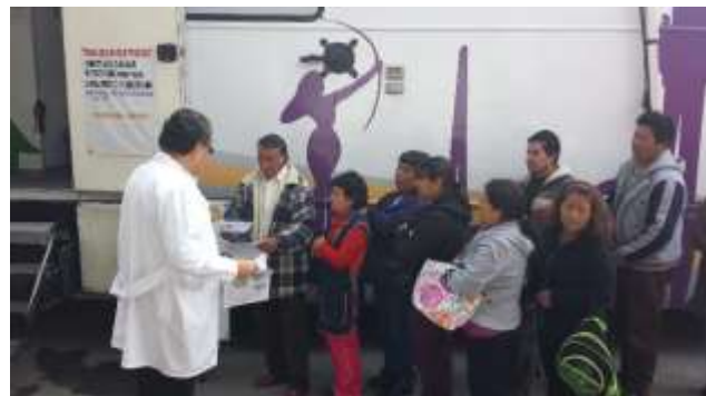
Jornada de Salud en Tlalpan