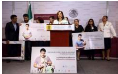
Presentación de la Campaña "Pásala si no embarazas", para la prevención del embarazo adolescente