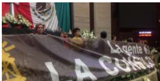
Contra de la privatización del petróleo

Expuse mi preocupación sobre estas reformas y lo seguiré haciendo, porque la privatización del petróleo afectará la economía del país y la capacidad de las mujeres para lograr la seguridad económica, porque no es ninguna novedad que las políticas de inversión extranjera suelen acentuar la desigualdad entre los géneros y disminuye la capacidad de autonomía de las mujeres.