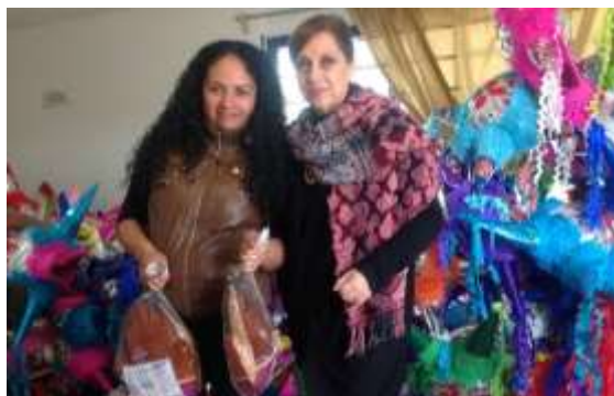
Entrega de piñatas en Tlalpan, fomentando la convivencia comunitaria y las tradiciones