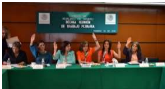
Reunión de Pleno de la Comisión de Igualdad de Género