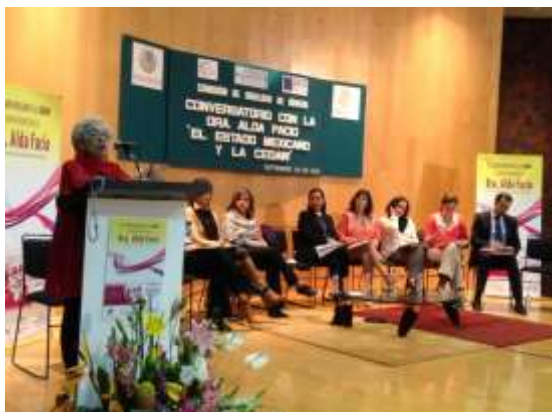
Conversatorio: “El Estado Mexicano y la CEDAW”

Ambos fueron impartidos por la Doctora Alda Facio, Jurista, experta internacional, especialista en género y derechos humanos de las mujeres y designada por el Consejo de Derechos Humanos de Naciones Unidas como integrante del Grupo de Trabajo sobre el tema de la discriminación contra las mujeres en la ley y en la práctica.