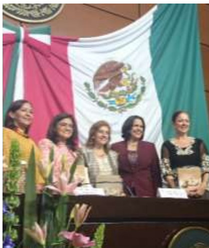
Presentación del libro "Mañana te escribiré otra vez", de Minou Tavárez Mirabal

de Belem Do Pará y el trigésimo quinto aniversario de la Convención sobre la Eliminación de todas las formas de Discriminación contra la Mujer (CEDAW).