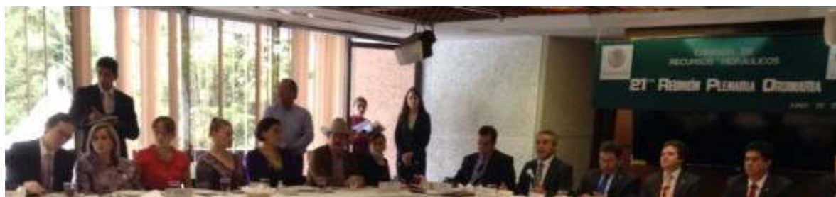
Reunión Plenaria de la Comisión de Recursos Hidráulicos

Dentro del periodo se han realizado 7 reuniones plenarias, en las cuales hemos suscrito los dictámenes e informes de los asuntos turnados a la comisión. Se recibieron 13 iniciativas de reforma y 6 proposiciones de punto de acuerdo.