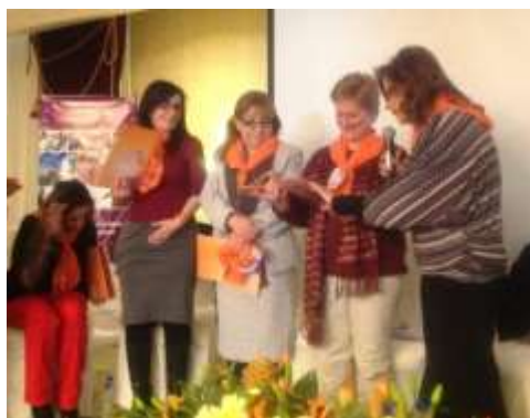
Conversatorio "Derecho de las mujeres a una vida libre de violencias"