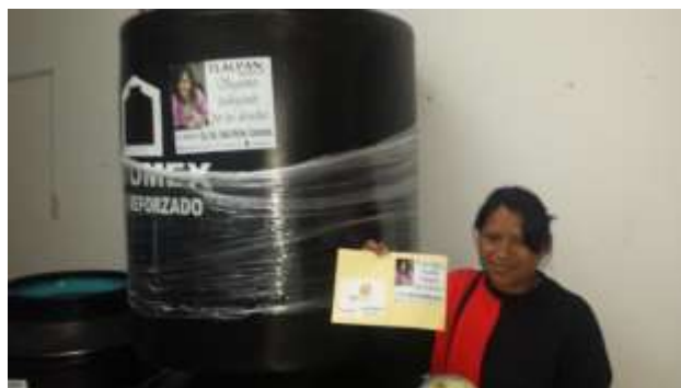
Entrega de tinacos para almacenamiento de agua Tlalpan, Ciudad de México

Tlalpan es una de las Delegaciones con más carencia de agua potable, así que durante este último año, mediante la colaboración del Sistema de Aguas de la Ciudad de México, acercamos pipas de agua a las poblaciones con más carencias de este vital líquido de la Delegación y entregamos tinacos para el almacenamiento de agua.