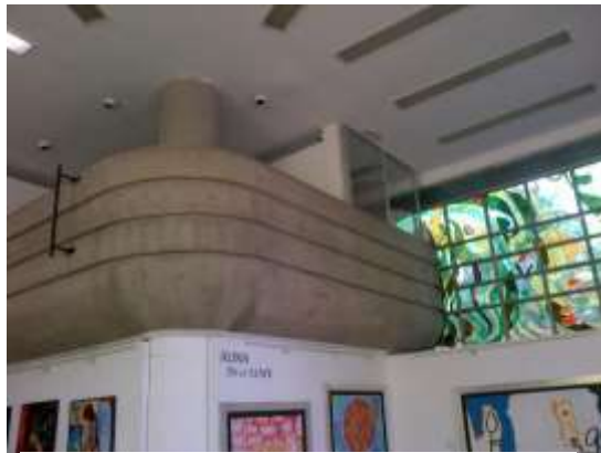
Recursos para mantenimiento Casa de la Cultura en Tlalpan, Ciudad de México