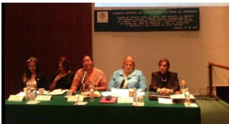
Reunión de la Comisión Especial de Lucha contra la Trata de Personas

También apoyamos con nuestra opinión, en la elaboración del dictamen de la Minuta de la iniciativa de reforma presentada por la Senadora Adriana Dávila y suscrita por las y los integrantes de la Comisión de Lucha contra la Trata de Personas del Senado.