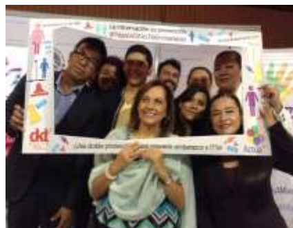
Presentación de la Campaña para la prevención de embarazo adolescente