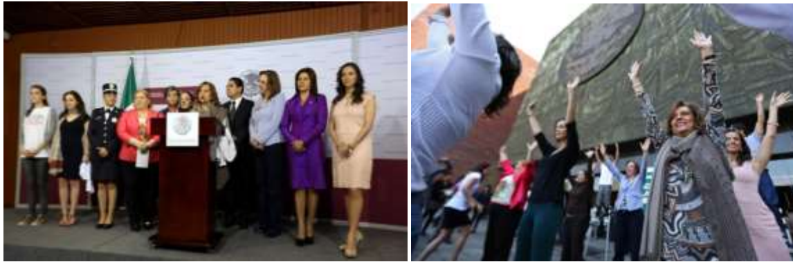
Conferencia de prensa y acto simbólico de adhesión a la Campaña "Un billón de pie" contra la trata de personas