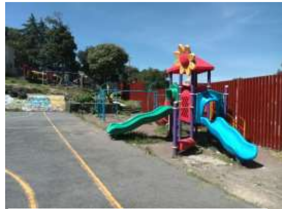
Recursos para el rescate de Parque en la Colonia Cultura Maya, Tlalpan, Ciudad de México.