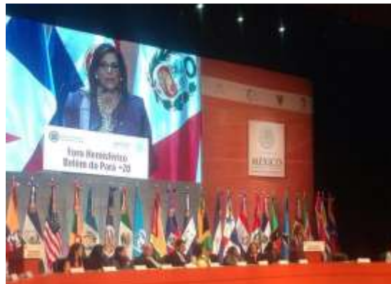
Foro Hemisferio Belém do Pará + 20

“Taller para el Desarrollo de Capacidades en los medios de Comunicación” , cuyo objetivo fue fortalecer las capacidades de las y los legisladores en el manejo de los medios de comunicación sobre los temas de especial relevación para la promoción de la salud y los derechos sexuales y reproductivos en la región latinoamericana. Llevado a cabo los días 18 y 19 de septiembre de 2014, en Panamá.