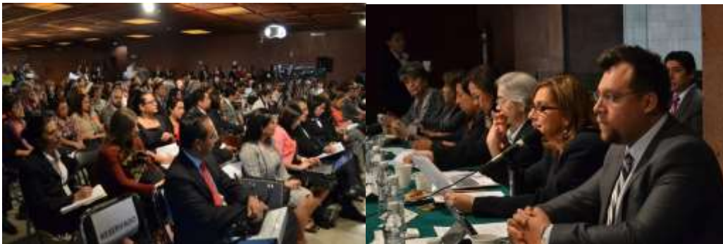
Reuniones de la Mesa Interinstitucional "Presupuestos para la Igualdad entre Mujeres y Hombres"

Sé que los retos son grandes, sin embargo, el avance que se ha tenido en materia presupuestal ha sido significativo. Como Diputada, Presidenta de la Comisión de Igualdad de Género y sobre todo como mujer, seguiré trabajado para que la igualdad entre mujeres sea una realidad.