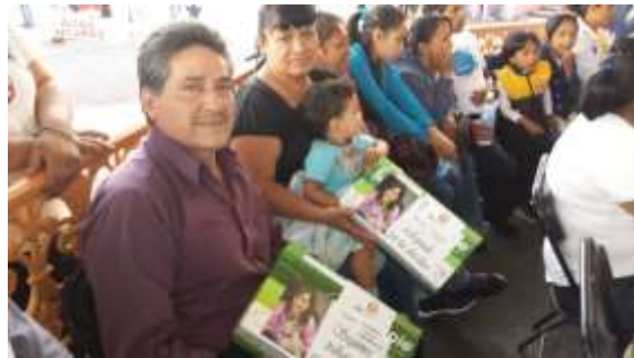
Entrega de zapatos terapéuticos especializados a habitantes de Tlalpan

Para atender los embates de la diabetes y mejorar la calidad de vida de quienes la padecen, proporcioné zapatos terapéuticos especializados, beneficiando a 98 mujeres y 42 hombres, particularmente a adultas y adultos mayores tlalpenses.