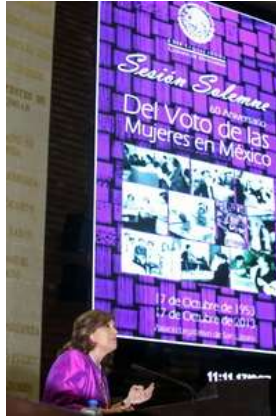
Sesión solemne del 60 Aniversario del Voto de las Mujeres en México

Foro Paridad en la toma de decisiones: En el marco de la conmemoración de los 60 años del voto de las mujeres en México, participamos a lo largo de varios meses en una Mesa Interinstitucional encargada de organizar diversos eventos a lo largo de la semana del 23 al 27 de septiembre de 2013. En este contexto, como Comisión de Igualdad de Género organizamos el Foro “Paridad en la toma de decisiones”, el miércoles 25 de septiembre de 2013.