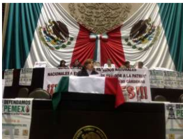
Toma de Tribuna en contra de la privatización del petróleo