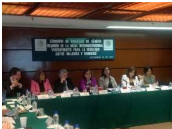
Reunión de la Mesa Interinstitucional "Presupuestos para la Igualdad entre Mujeres y Hombres"