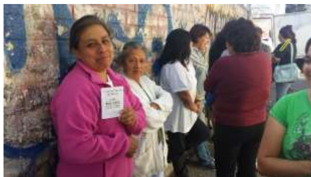
Prevención del Cáncer de mama entre mujeres de Tlalpan

Uso de nuevas tecnologías para la cocción de alimentos, que prevengan enfermedades pulmonares en las mujeres y sus familias de Tlalpan.