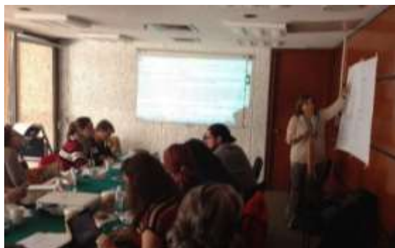
Reunión con expertas para el análisis y discusión de la reforma integral a la Ley General de Acceso de las Mujeres a una Vida libre de Violencia

Durante una de mis intervenciones, hice del conocimiento de la titular de CONAVIM diversos cuestionamientos que realizaron las organizaciones de la sociedad civil relativos a la investigación de la Alerta en Guanajuato, en torno a la metodología de investigación y aspectos de tipo presupuestal. De su respuesta, se advirtió la necesidad de llevar a cabo diversas adecuaciones al marco normativo que permitan llevar a cabo una investigación eficaz en este tema.