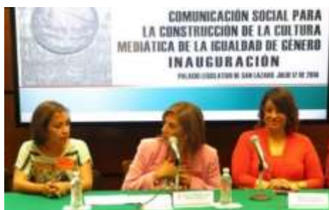
Inauguración del Seminario: Comunicación Social para la construcción de la cultura mediática de la Igualdad de Género

Diplomado: La Responsabilidad de la Comunicación Social para la construcción de la cultura mediática de la Igualdad de Género: El 17 de julio de 2014 inauguramos el Diplomado "La responsabilidad de la comunicación social para la construcción de la cultura mediática de la igualdad de género", organizado por el Centro de Estudios, Difusión, Investigación y Desarrollo, A.C. Con este proyecto se busca sensibilizar y formar a un grupo de servidores y servidoras del Gobierno federal para que incluyan la perspectiva de género en todas las campañas mediáticas, y eviten la reproducción de la discriminación.