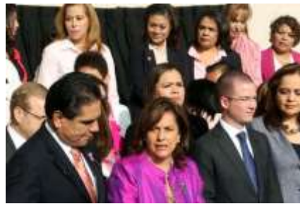
60 Aniversario del Voto de las Mujeres en México

Foro Paridad en la toma de decisiones: En el marco de la conmemoración de los 60 años del voto de las mujeres en México, participamos a lo largo de varios meses en una Mesa Interinstitucional encargada de organizar diversos eventos a lo largo de la semana del 23 al 27 de septiembre de 2013. En este contexto, como Comisión de Igualdad de Género organizamos el Foro “Paridad en la toma de decisiones”, el miércoles 25 de septiembre de 2013.