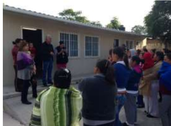
Entrega de donativos en Tlalpan, Ciudad de México.