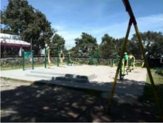
Recursos para rescate de Parque en la Colonia Cultura Maya, Tlalpan, Ciudad de México.