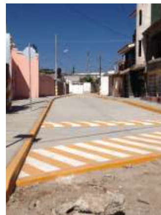
Pavimentación en Silao, Gto.