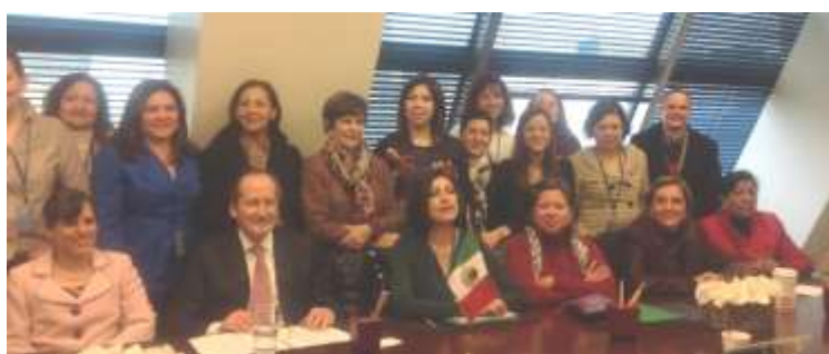
Delegación de México en la 58 Sesión de la Comisión Jurídica y Social de la Mujer

Este evento favoreció la consolidación de una agenda mundial para el desarrollo y posicionó al empoderamiento de las mujeres y las niñas como el foco principal de atención.