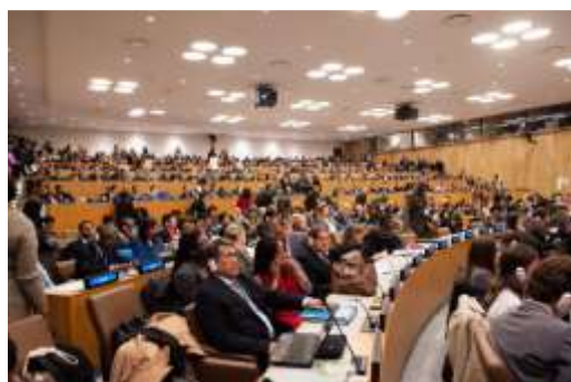
58 Sesión de la Comisión Jurídica y Social de la Mujer, Nueva York