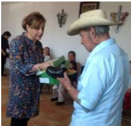
Entrega de zapatos terapéuticos especializados a habitantes de Tlalpan

Realizamos 4 jornadas de salud visual, ofreciendo examen gratuito de la vista y anteojos a bajo costo; proporcionamos sillas de ruedas y bastones a personas que demandaban estos artículos para su rehabilitación. Asimismo, se entregaron donativos para la compra de medicamentos a personas de escasos recursos, y se impartieron 45 pláticas sobre detección oportuna de cáncer de mama, autoexploración y derechos humanos de las mujeres.