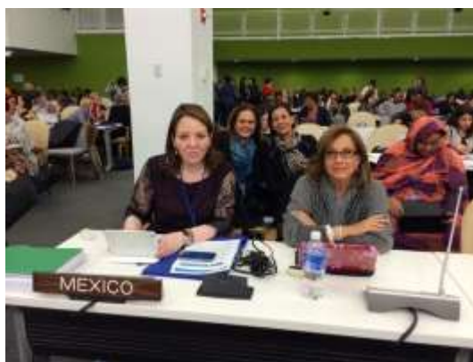
58 Sesión de la Comisión Jurídica y Social de la Mujer, Nueva York

Derivado de estos puntos, se planteó la necesidad de crear un nuevo Objetivo de Desarrollo sostenible independiente, que tenga en cuenta estas cuestiones; lo cual requerirá tanto de voluntad política, como de la asignación de recursos acordes a dicho Objetivo.