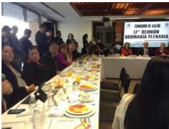
Reunión Plenaria de la Comisión de Salud

Se llevaron a cabo diversos foros y reuniones con personas expertas en materia de salud, a fin de allegarnos de experiencias exitosas que coadyuven al mejoramiento de una adecuada cobertura sanitaria, así como el análisis y la consideración de opciones para su buen funcionamiento.