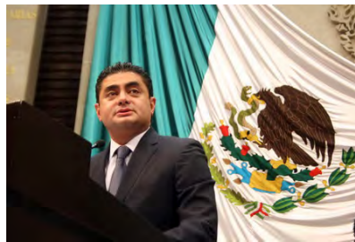
Haciendo uso de la tribuna para posicionar, a nombre del Grupo Parlamentario del PRD, nuestra postura en materia educativa.