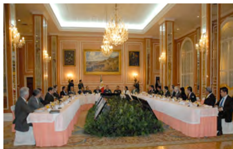
Sesiones de la Comisión de Defensa Nacional