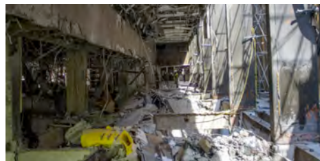
Visita al Complejo Administrativo Pemex, después del siniestro ocurrido en enero del presente año, en las instalaciones del edificio B2.