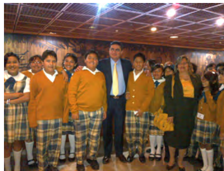
Visitas guiadas a la H. Cámara de Diputados