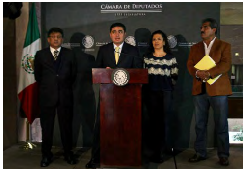
Posicionamiento con los Integrantes de la Comisión de Energía del GP PRD frente a una Reforma Energética, durante una rueda de prensa