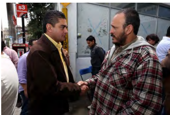
Evento de apertura de mi Módulo de Atención Ciudadana en la Delegación Cuajimalpa