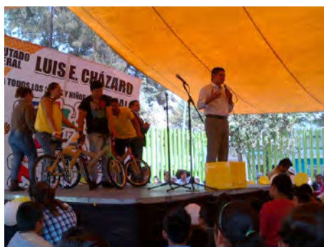
Celebración del Día del Niño en mi Módulo de Atención Ciudadana en Iztacalco