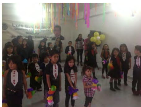
Evento de Clausura de Cursos de Verano en mi Módulo de Atención Ciudadana en Iztacalco.