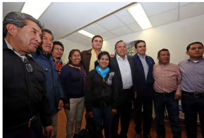
Conviviendo con amigos y la ciudadanía en varios eventos